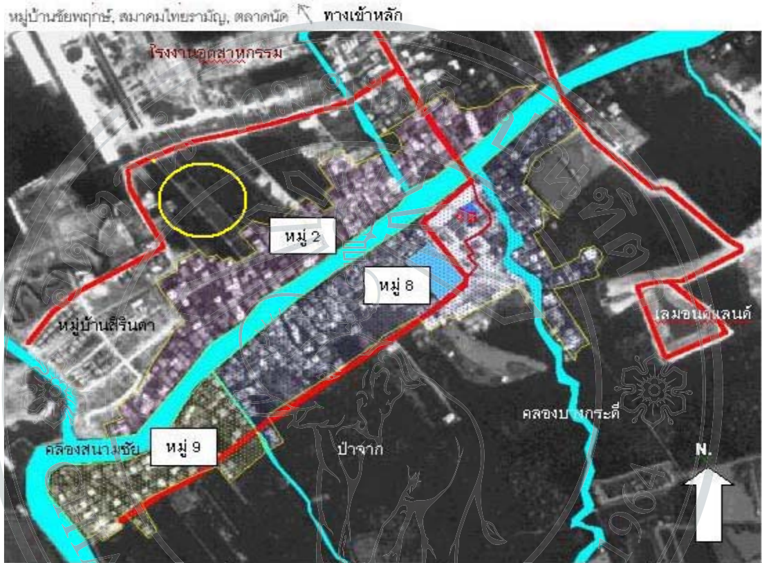
แผนที่แสดงการใช้ที่ดินบริเวณโดยรอบชุมชนบางกระทัด