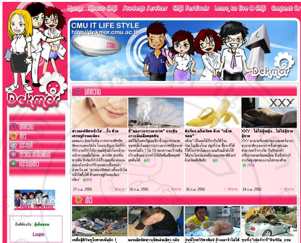
ภาพที่ B-1 แสดงหน้าจอแรกของเว็บไซต์เด็กมอที่ผู้ใช้เห็น