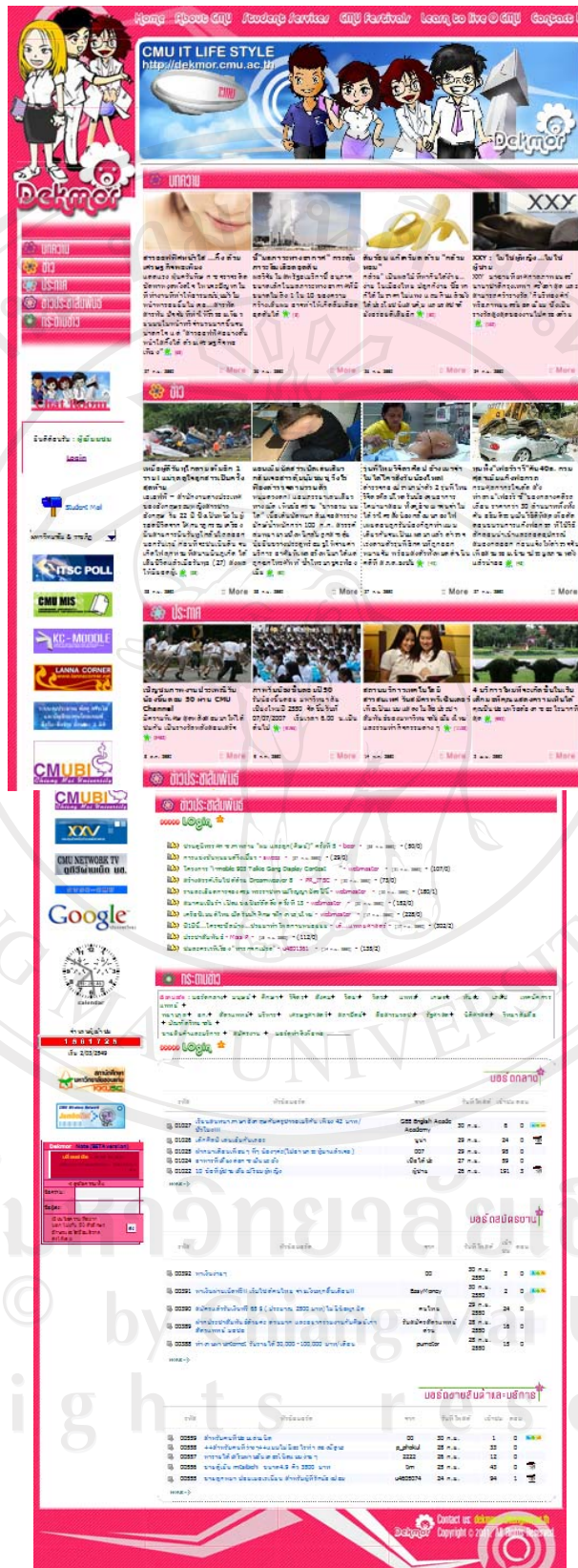
ภาพที่ B-2 แสดงหน้าแรกของเว็บไซต์เด็กมอทั้งหน้า

ลิขสิทธิ์ © โดย มหาวิทยาลัยเชียงใหม่ Copyright © by Chiang Mai University All rights reserved