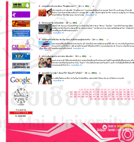
ภาพที่ B-4 แสดงหน้าเว็บเพจหมวด “ข่าว” ของเว็บไซต์เด็กมอทั้งหน้า