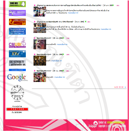
ภาพที่ B-5 แสดงหน้าเว็บเพจหมวด “ประกาศ” ของเว็บไซต์เด็กมอทั้งหน้า