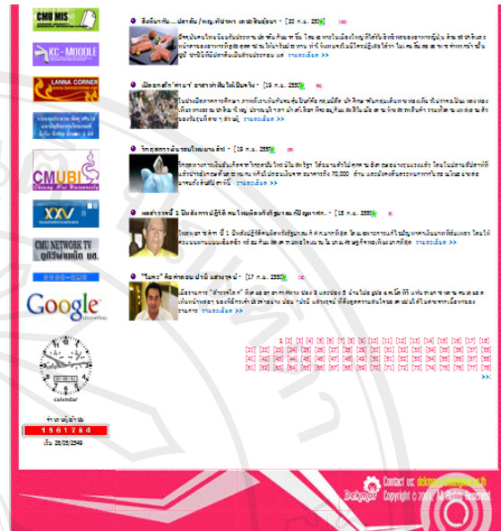
ภาพที่ B-3 แสดงหน้าเว็บเพจหมวด “บทความ” ของเว็บไซต์เด็กมอทั้งหน้า