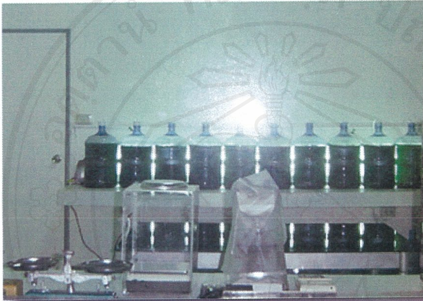
รูป 2.2 ภาพแสดงการเพาะเลี้ยงสาหร่ายเกลียวทองในห้องปฏิบัติการ

ภาพแสดงขั้นตอนการเพาะเลี้ยงสาหร่ายเกลียวทอง ซึ่งเป็นกระบวนการผลิตบางส่วนของสถานประกอบการที่เป็นสถานที่ดำเนินการศึกษา โดยเริ่มจากการคัดเลือกสายพันธุ์ซึ่งใช้เกณฑ์ที่กำหนดขึ้นตามความสมบูรณ์ของลักษณะสายพันธุ์ และทำการเพาะเลี้ยงในห้องปฏิบัติการ ดังแสดงในรูป 2.2