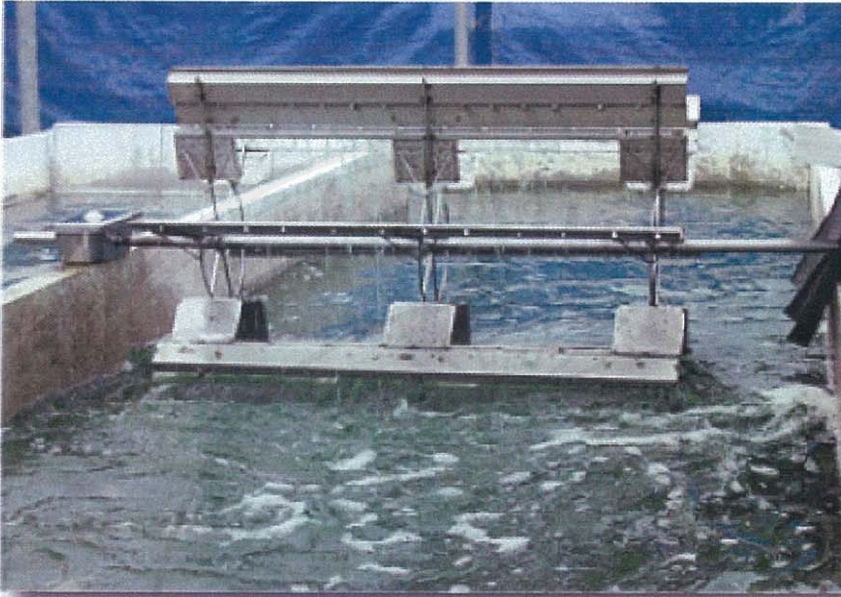
รูป 2.3 ภาพแสดงการเพาะเลี้ยงสาหร่ายเกลียวทองในบ่ออนุบาล