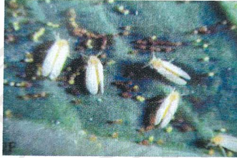
แมลงหีข้าวเพศเมียไข่บริเวณใต้ใบพืช