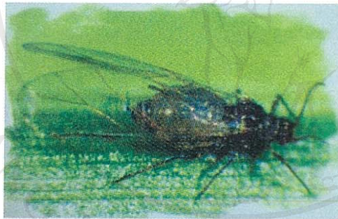
ตัวเต็มวัยเพลี้ยอ่อน