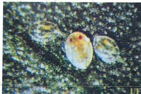
ตัวอ่อนแมลงหีข้าว