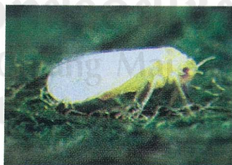
ตัวเต็มวัยแมลงหีข้าว