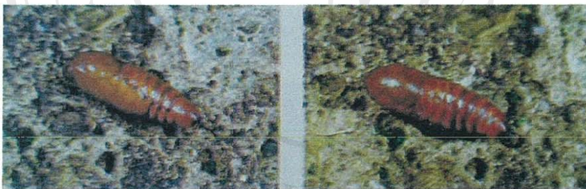
ดักแด้หนอนเจาะสมอฝ้าย