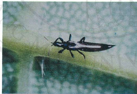
ตัวเต็มวัยเพลี้ยไฟพริก