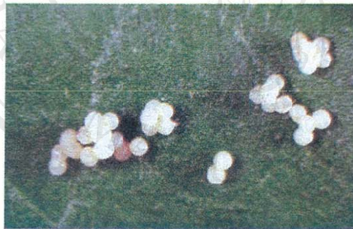
ไข่หนอนเจาะสมอฝ้าย