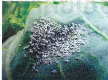
เพลี้ยอ่อนอาศัยเป็นกลุ่มใต้ใบพืช