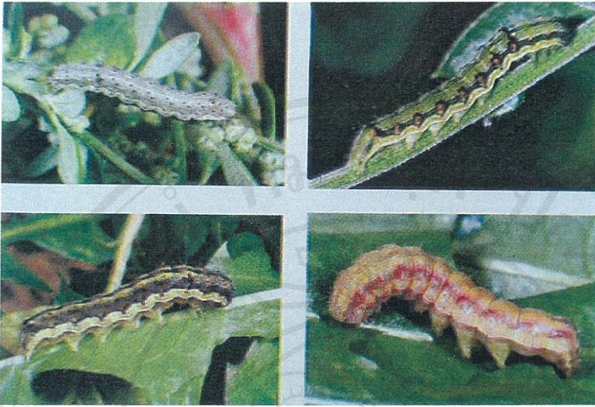
หนอนเจาะสมอฝ้ายหลากสีสั้นตามอายุ