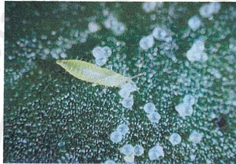
ตัวอ่อนเพลี้ยไฟพริก