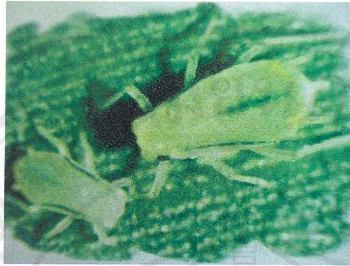
ตัวอ่อนเพลี้ยอ่อน