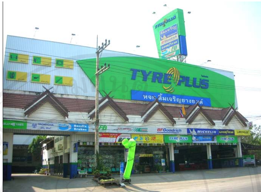
ห้างหุ้นส่วนจำกัด ลิ้มเจริญยางยนต์