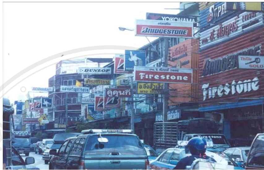
ร้านยางแบบดั้งเดิม