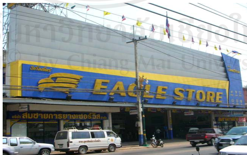
ร้านยางรูปแบบใหม่