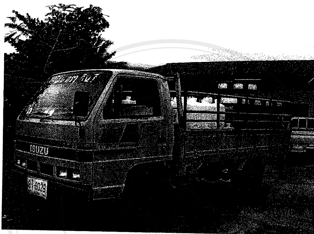
รูปที่ 7 รถบรรทุกเตรียมออกจำหน่าย คันที่ 2