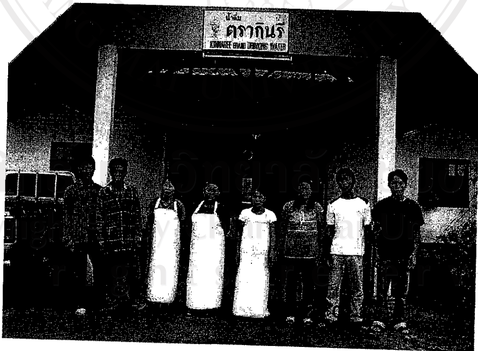
รูปที่ 2 พนักงานน้ำดื่มकिनรี