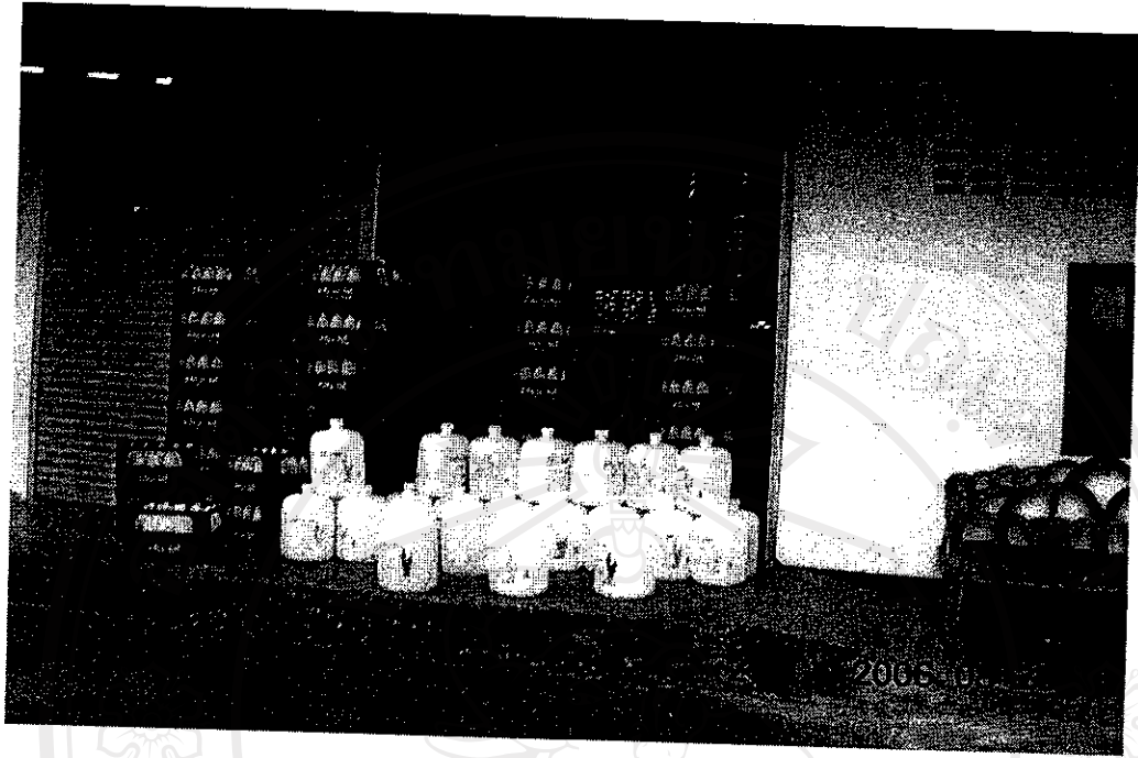
รูปที่ 3 ภาชนะเตรียมเลี้ยง