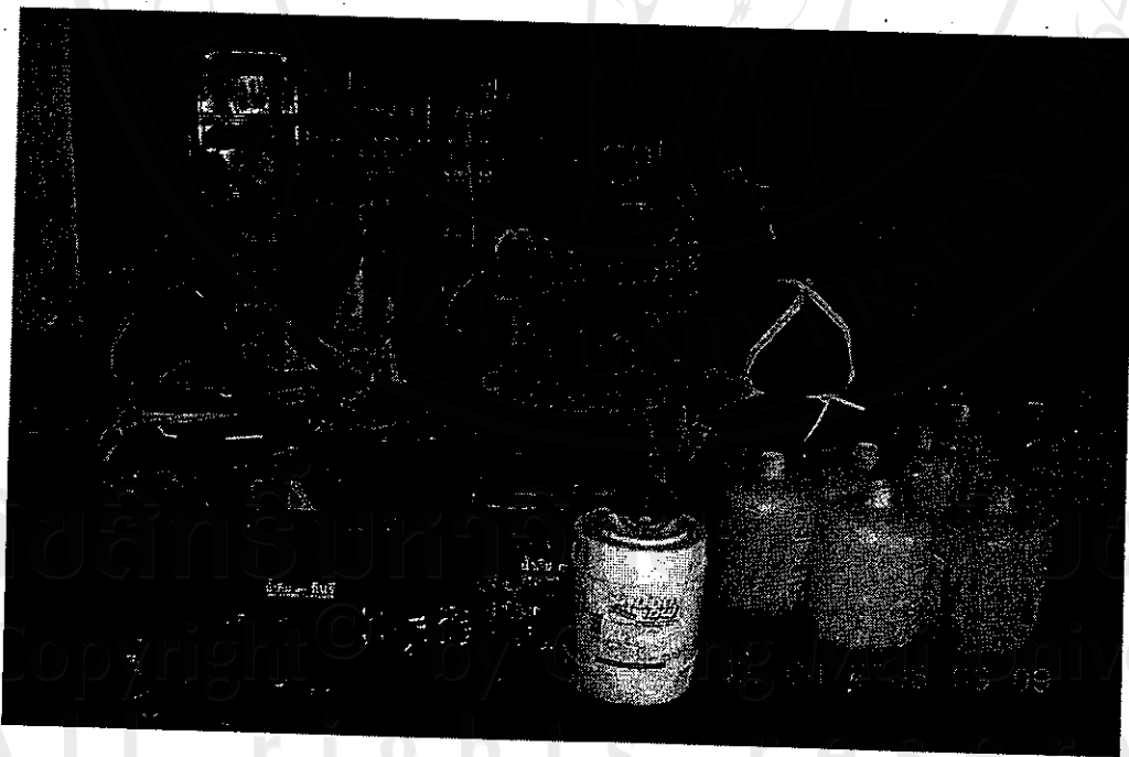
รูปที่ 4 การล้างภาชนะบรรจุน้ำดื่มกินรี