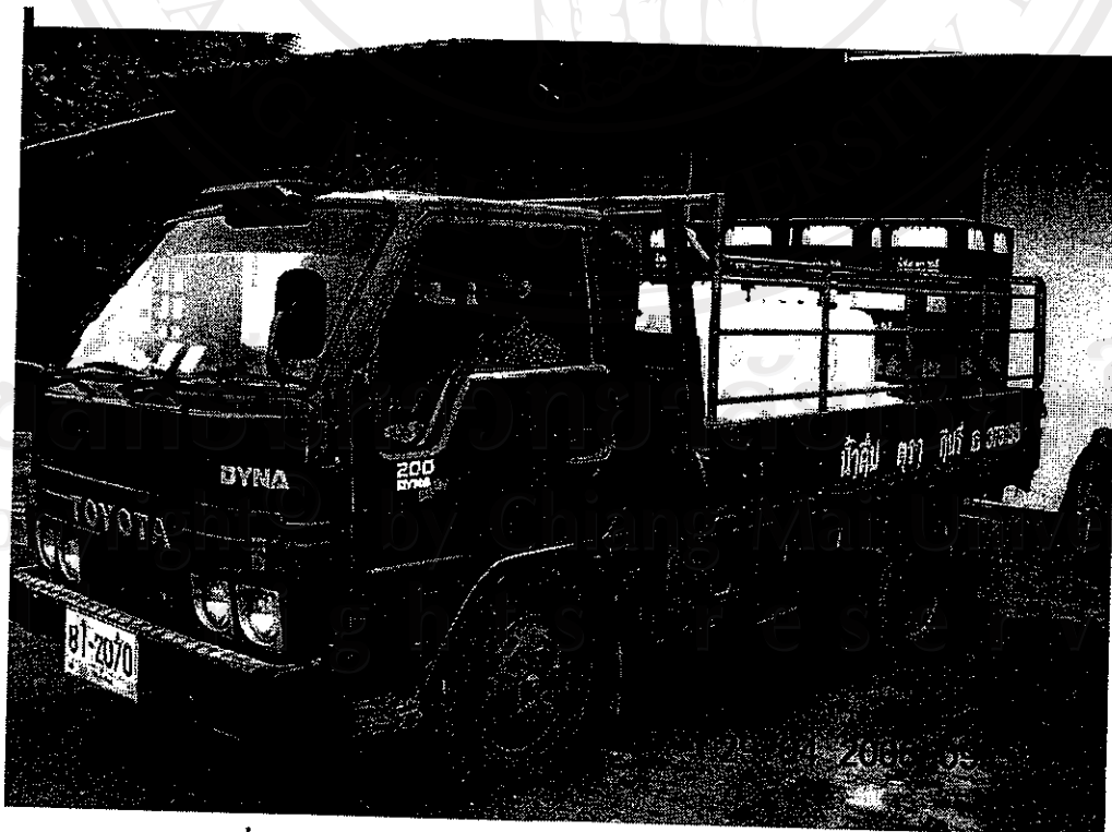
รูปที่ 6 รถบรรทุกเตรียมออกจำหน่าย คันที่ 1