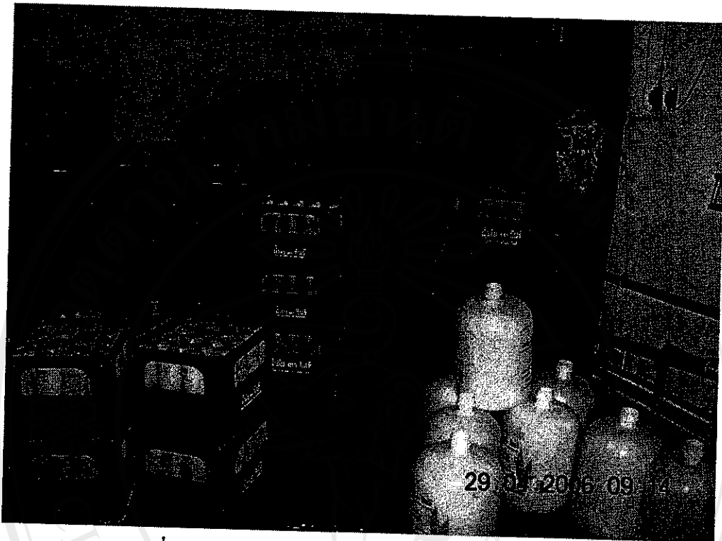
รูปที่ 5 การล้างภาชนะโดยเครื่องพ่นน้ำ