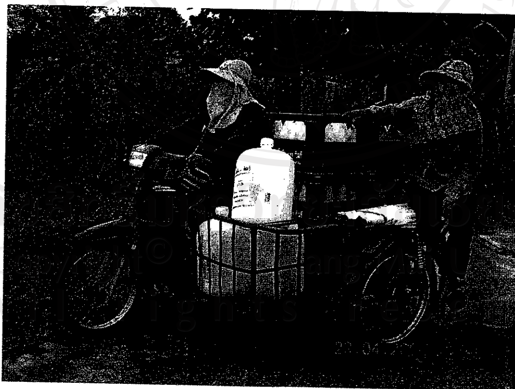
รูปที่ 8 รถพ่วงสำหรับส่งบริเวณใกล้เคียง