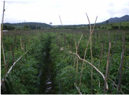
รูปที่ 6 การปลูกมะเขือเทศเชอร์รี่ (นอกโรงเรือน)