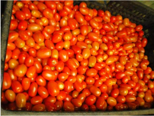
รูปที่ 2 ผลผลิตมะเขือเทศเชอร์รี่