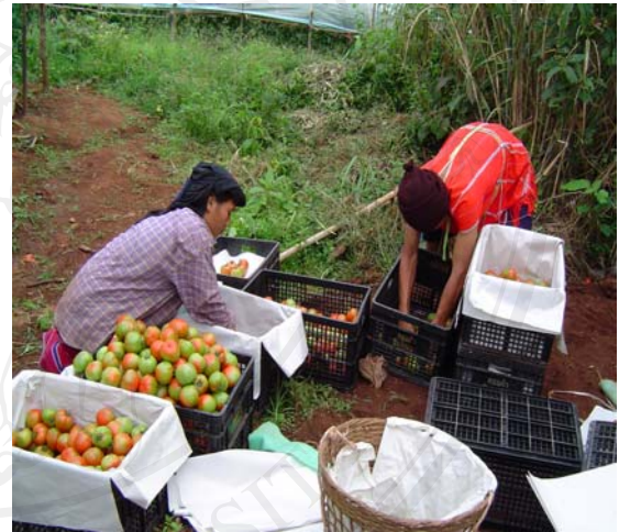
รูปที่ 12 การเก็บเกี่ยวผลผลิต