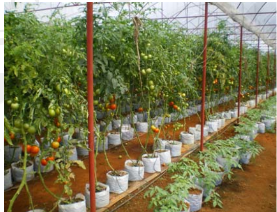
รูปที่ 5 การปลูกมะเขือเทศลูกโต ในวัสดุปลูก (substrate)