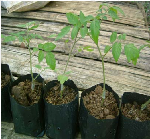
รูปที่ 11 ต้นกล้ามะเขือเทศผลโตที่มีการเปลี่ยนยอด