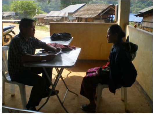
รูปที่ 1 การสัมภาษณ์เกษตรกรที่ปลูกมะเขือเทศ