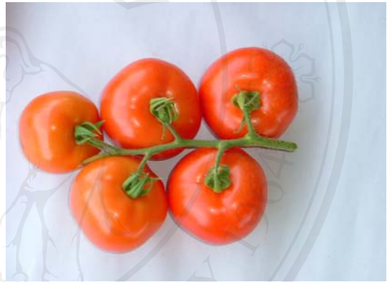
รูปที่ 3 ผลผลิตมะเขือเทศลูกโต