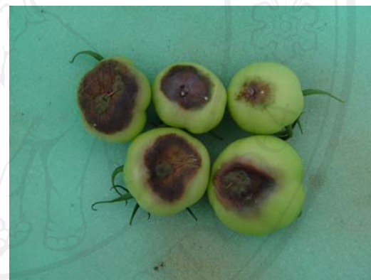
รูปที่ 16 ความเสียหายที่เกิดจากการขาดธาตุอาหาร (ปลูกในวัสดุปลูก)