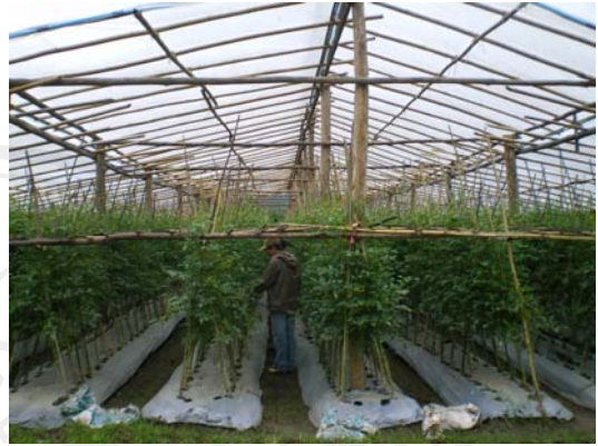
รูปที่ 7 การปลูกมะเขือเทศเชอร์รี่ (ในโรงเรือน)