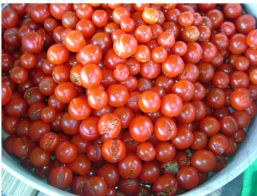
รูปที่ 15 ความเสียหายที่เกิดจากน้ำมากเกินไป