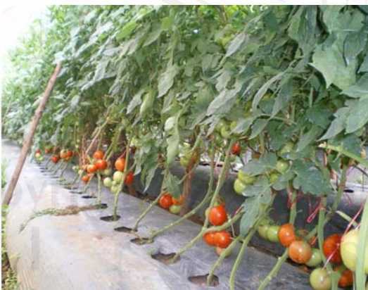
รูปที่ 4 การปลูกมะเขือเทศลูกโตลงดิน