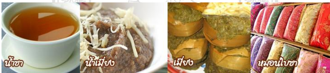
ภาพที่ 4.27 แสดงการแปรรูปชาเป็นผลิตภัณฑ์ชาวบ้านแม่กำปอง

ทุกวันนี้ต้นเมี่ยงหรือต้นชาในป่าเมี่ยงยังคงเจริญเติบโตไปพร้อมกับชาวบ้านแม่กำปอง ป่าเมี่ยงยังคงเป็นแหล่งทำกินที่ก่อเกิดประโยชน์มากมาย ใช้ทำเมี่ยงต่อไป ตราบดที่ยังมีคนกิน ใช้ทำน้ำชาเพื่ออบอุ่นร่างกาย ใช้ทำน้ำเมี่ยงที่เป็นอาหาร และใช้ทำเป็นหมอน ใบชาช่วยเสริมรายได้ให้กับครอบครัว ต้นเมี่ยงหรือต้นชาจะไม่เป็นเพียงพืชเศรษฐกิจบนดอยสูงแต่จะเป็นพืชที่เชื่อม ชีวิตและจิตใจของคนในชุมชนให้อยู่ร่วมกันกับธรรมชาติอย่างมีความสุขและมองเห็นคุณค่าประโยชน์ของธรรมชาติจะได้ช่วยกันรักษาต่อไป