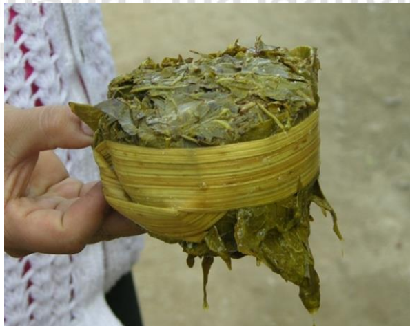
ภาพที่ 4.24 แสดงเมี่ยงที่ได้จากการหมัก