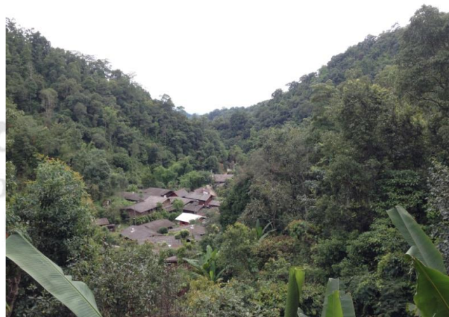
ภาพที่ 4.3 แสดงสภาพหมู่บ้านแม่กำปอง

รวมทั้งสิ้น 128 หลังคาเรือน ประชากรจำนวน 418 คน 11