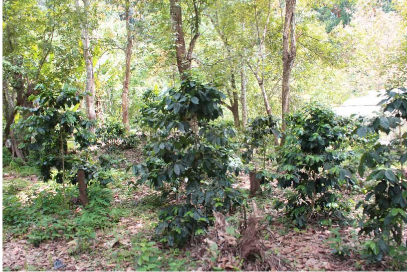
ภาพที่ 4.28 สภาพสวนชาของชุมชนแม่กำปอง

การรับรู้สภาพทางกายภาพของพื้นที่ มรดกวัฒนธรรมแบบรูปธรรม (Tangible Heritage)