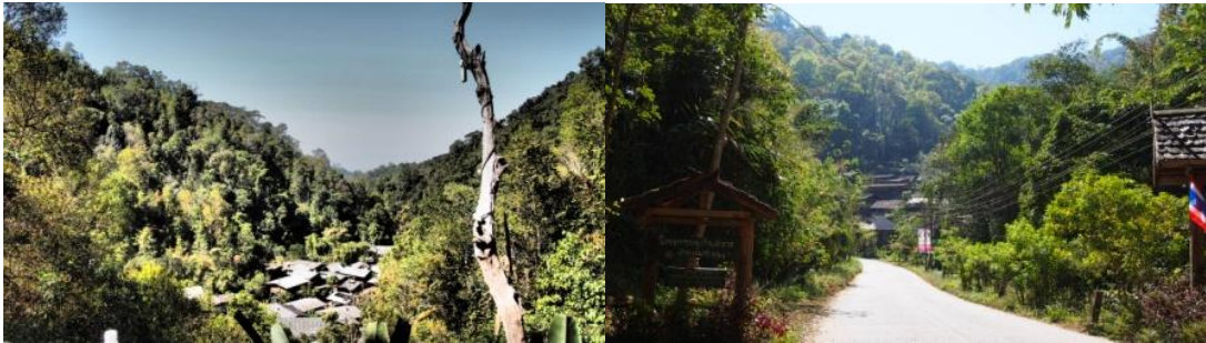
ภาพที่ 4.1 แสดงสภาพโดยทั่วไปของชุมชนป่าเหมียง บ้านแม่กำปอง

ฤดูกาล ในปี 2547 บ้านแม่กำปองมีจำนวนประชากร 418 คน 130 ครัวเรือน บ้านแม่กำปอง เป็นหมู่บ้านที่ทำเหมืองเป็นอาชีพหลัก 9