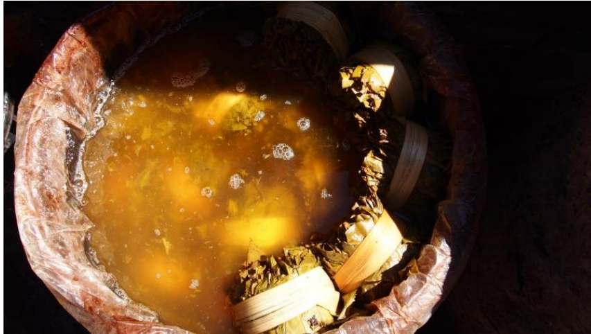
ภาพที่ 4.34 แสดงภาพเมียงที่ได้จากการหมักใบชา