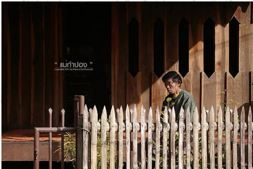
ภาพที่ 4.40 แสดงสภาพวิถีชีวิตของชาวหมู่บ้านแม่กำปองที่อยู่กับแสดงแดด อันเนื่องมาจากพื้นที่ตั้งหมู่บ้านมีความหนาวเย็น

ภูมิปัญญาการใช้เวลาและผลผลิตอันเนื่องมาจากกิจกรรมการทำเมียง