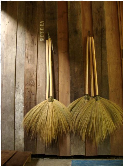
ภาพที่ 4.35 แสดงผลิตภัณฑ์ไม้กวาดดอกหญ้าผลิตภัณฑ์ที่เกิดขึ้นระหว่างรอดูดการเก็บเกี่ยว