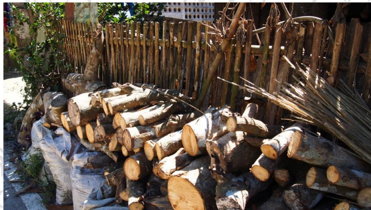
ภาพที่ 4.37 แสดงผลิตผลไม้ฟืนผลิตผลที่เกิดขึ้นระหว่างรอดูดการเก็บเกี่ยว เพื่อใช้ในกิจกรรมการทำเมียง