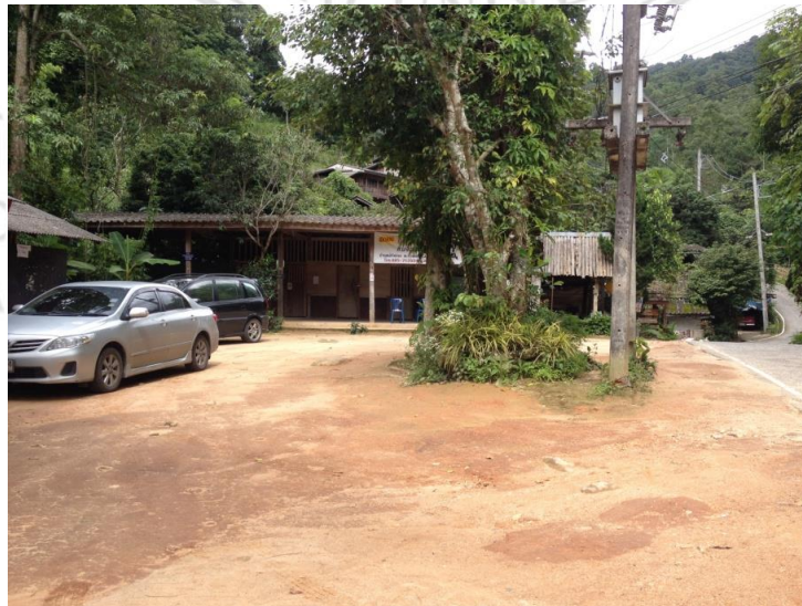
ภาพที่ 4.29 แสดงการใช้พื้นที่วัดเรียงไปกับถนนในหมู่บ้าน