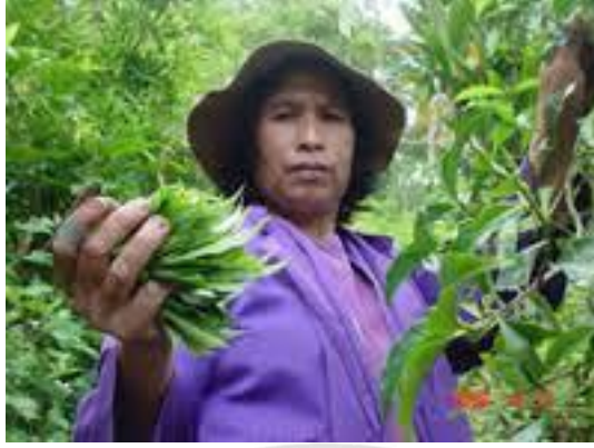
ภาพที่ 4.17 แสดงการเก็บเมี่ยงของชาวบ้าน