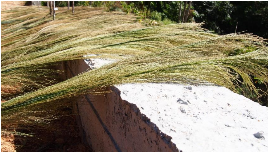
ภาพที่ 4.39 แสดงการตากดอกหญ้าเพื่อใช้ทำไม้กวาด

ภูมิปัญญาการใช้เวลาและผลผลิตอันเนื่องมาจากกิจกรรมการทำเมียง