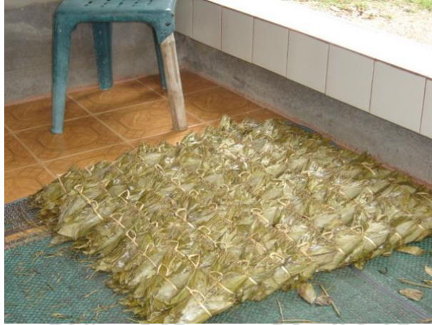
ภาพที่ 4.22 แสดงการผึ่งเมี่ยงให้เย็น