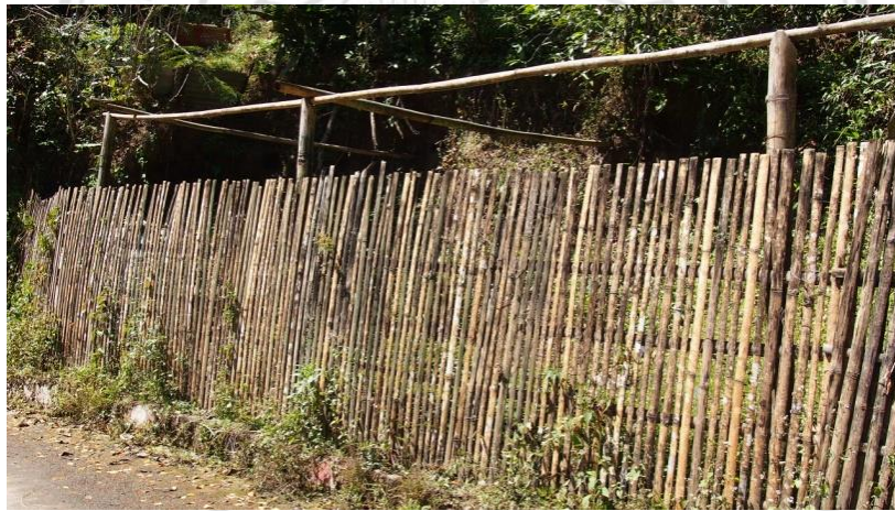
ภาพที่ 4.33 แสดงลักษณะรั้วบ้านที่ใช้วัสดุธรรมชาติในการทำ