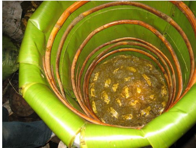
ภาพที่ 4.23 แสดงการหมักเมี่ยง