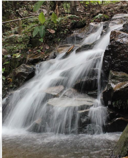
ภาพที่ 4.5 แสดงสภาพน้ำตกแม่กำปอง

น้ำตกแม่กำปอง น้ำตก แม่กำปองมีต้นกำเนิดจากแหล่งน้ำธรรมชาติในเขตบ้านแม่กำปอง มีความสวยงามไหลลดหลั่นลงมาเป็นระดับรวม 7 ชั้น น้ำมีความใสสะอาด ซึ่งการเดินทางตามเส้นทางท่องเที่ยวจะผ่านน้ำตกก่อนขึ้นไปชมสภาพทิวทัศน์บนดอยม่อนล้าน