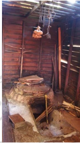
ภาพที่ 4.30 แสดงลักษณะเตาสำหรับนั่งเมี่ยงซึ่งอยู่ในอาคารบ้านพักอาศัย