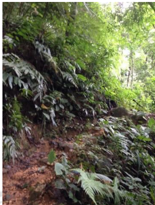
ภาพที่ 4.15 แสดงถึงสภาพทางเดินในป่าเมี่ยงที่มีในปัจจุบัน