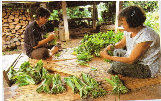
ภาพที่ 4.18 แสดงการมัดเมี่ยงของชาวบ้าน

หลังจากเก็บมาแล้ว ก็จะนำใบเมี่ยงมาหอม หรือมัดให้สวยงามเพื่อเตรียมนึ่ง โดย 1 กิโลกรัม จะได้ประมาณ 5-6 มัด