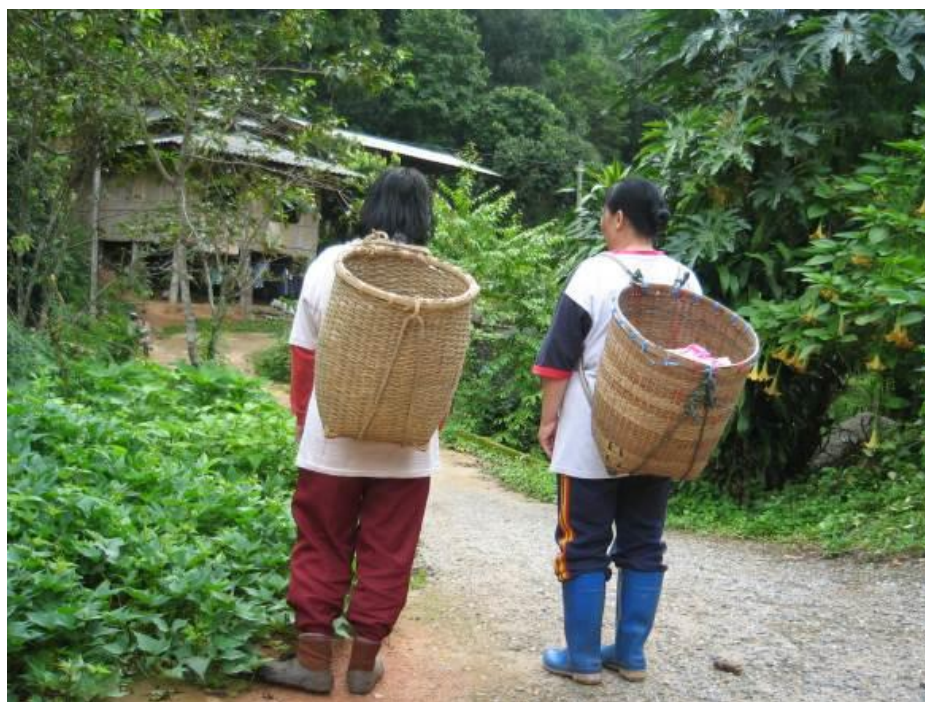
ภาพที่ 4.16 แสดงลักษณะชุดเก็บใบเมี่ยงและถ้วยเปื้อะของชาวบ้านแม่กำปอง

การเก็บเมี่ยงต้องออกแต่เช้าตรู่ ใช้อุปกรณ์ในการเก็บหรือเด็ดยอดคือ เล็บเหล็กที่ทำจากโลหะพวกสังกะสี ทำเป็นปลอกสวมนิ้วมือ เมื่อเก็บได้เต็มกำมือแล้วจะใช้ตอกที่มีขนาดกว้าง 1 เซนติเมตร ยาวประมาณ 30 เซนติเมตร มัดรวมไว้เรียกว่า 1 กำ แล้วใส่ถ้วยเปื้อะที่อยู่ด้านหลัง