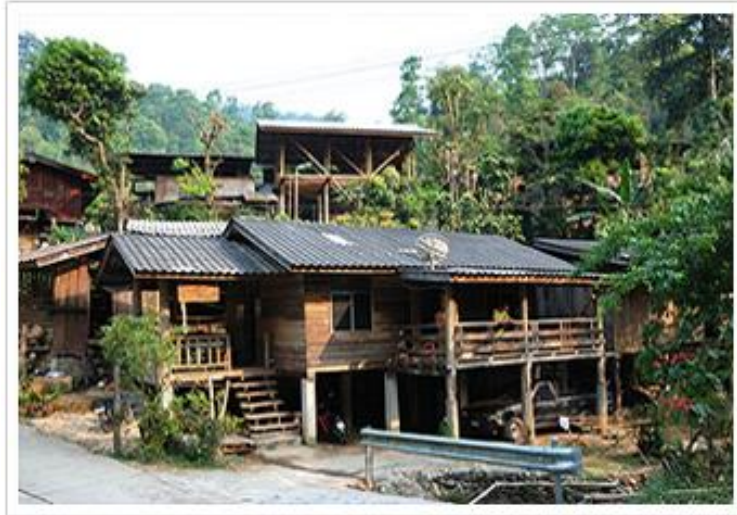
ภาพที่ 4.32 แสดงลักษณะการก่อสร้างสิ่งปลูกสร้างและสถาปัตยกรรมบ้านแม่กำปอง