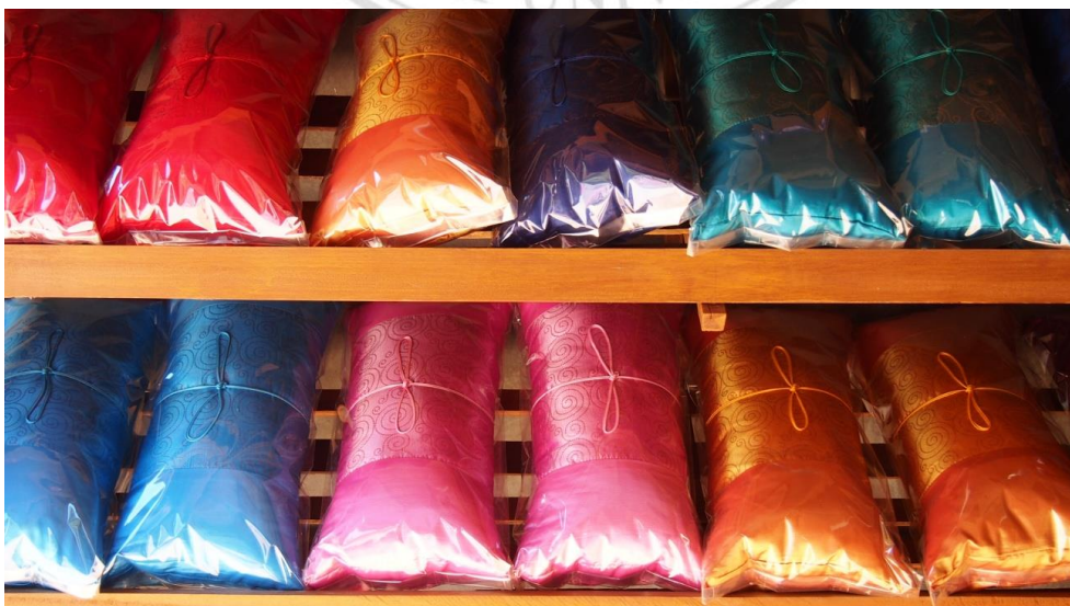
ภาพที่ 4.8 แสดงลักษณะรูปแบบหมอนใบชา

ปัจจุบันบ้านแม่กำปอง มีกลุ่มอาชีพที่เกิดขึ้น ซึ่งเป็นผลจากการพัฒนาการท่องเที่ยวชุมชน ซึ่งกลุ่มอาชีพเหล่านี้ได้เข้ามามีส่วนร่วมในการสนับสนุนการท่องเที่ยวของ ชุมชน และช่วยกระจายผลประโยชน์ของการท่องเที่ยวชุมชนสู่ชาวบ้านทั้งชุมชน กลุ่มที่สำคัญ ได้แก่ กลุ่มสมุนไพร กลุ่มหมอนใบชา และกลุ่มนวดแผนไทย