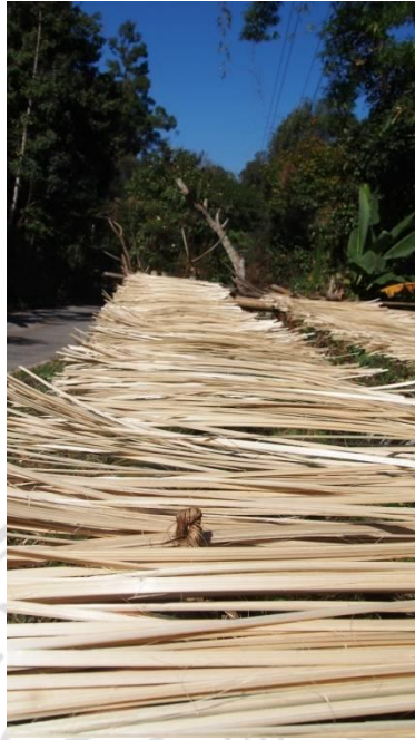
ภาพที่ 4.36 แสดงผลิตผลตอกมัดเมียงผลิตผลที่เกิดขึ้นระหว่างรอดูดการเก็บเกี่ยว เพื่อใช้ในกิจกรรมการทำเมียง