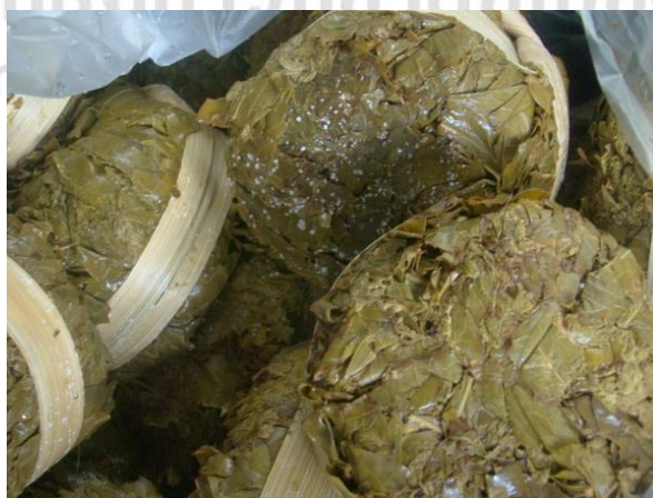
ภาพที่ 4.21 แสดงลักษณะเมี่ยงนึ่ง