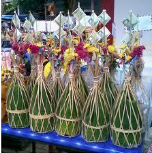
ภาพที่ 4.14 แสดงลักษณะของกำยสล้าก