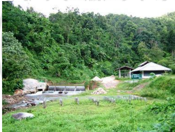
ภาพที่ 4.12 แสดงลักษณะโรงไฟฟ้าพลังน้ำของหมู่บ้านแม่กำปองใหม่