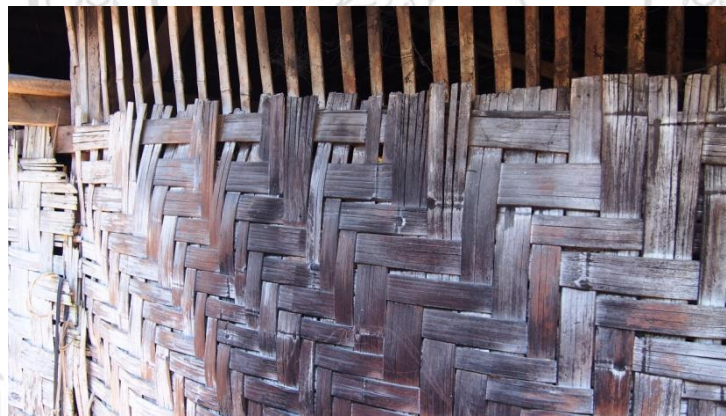
ภาพที่ 4.31 แสดงลักษณะของผนังเพื่อการระบายความร้อนบริเวณเตานั่งเมี่ยง