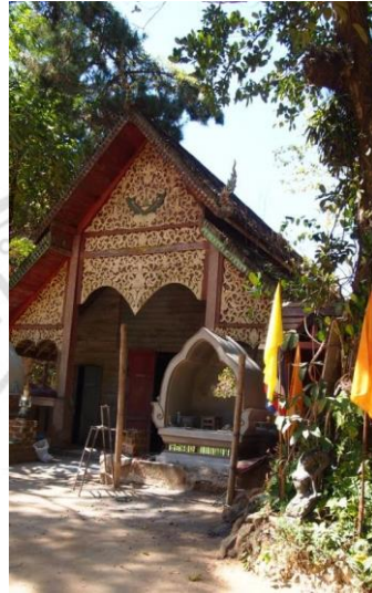
ภาพที่ 4.7 แสดงลักษณะวิหารวัดคันธาพุกษา

วัดคันธาพุกษา เป็นวัดเก่าแก่ที่สร้างขึ้น ตั้งแต่ในยุคการตั้งถิ่นฐานของชุมชน ลักษณะของการก่อสร้างใช้สถาปัตยกรรมแบบเรียบง่ายโดยวิหาร สร้างจากไม้ทั้งหลัง พระอุโบสถตั้งอยู่กลางน้ำ เพื่อใช้เป็นตัวกำหนดเขตเช่นเดียวกับการใช้เสาหินตามหลักของวัดในวัฒนธรรม ภาคกลาง มีพระจำพรรษา 3 รูป