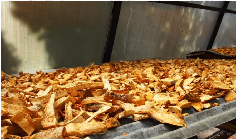
ภาพที่ 4.10 แสดงลักษณะรูปแบบการแปรรูปสมุนไพร