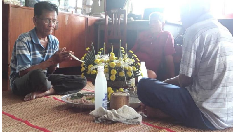
ภาพที่ 4.13 แสดงพิธีกรรมฮ้องขวัญของชาวบ้าน