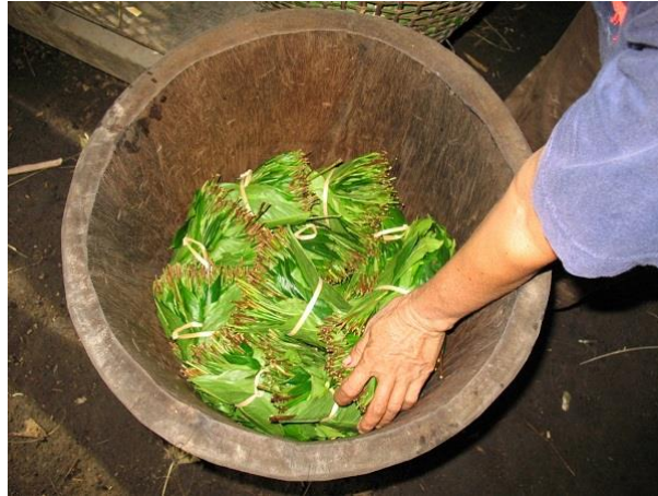
ภาพที่ 4.19 แสดงการเรียงใบเมี่ยงสดในไหนึ่งเมี่ยง