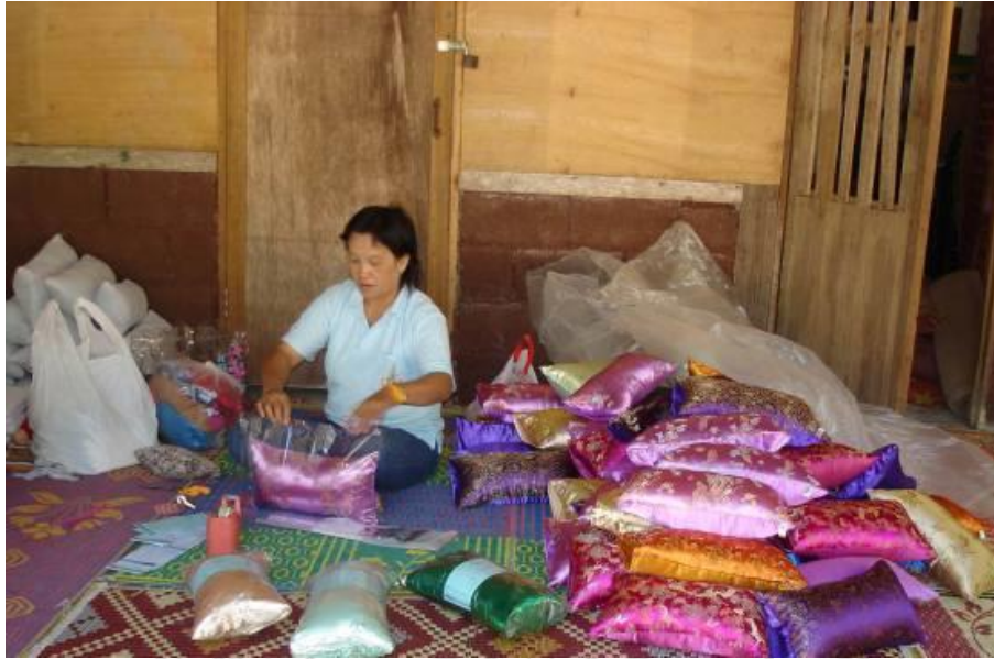
ภาพที่ 4.9 แสดงกระบวนการทำหมอนใบชาของกลุ่มแม่บ้าน