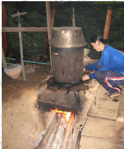
ภาพที่ 4.20 แสดงการนึ่งเมี่ยง