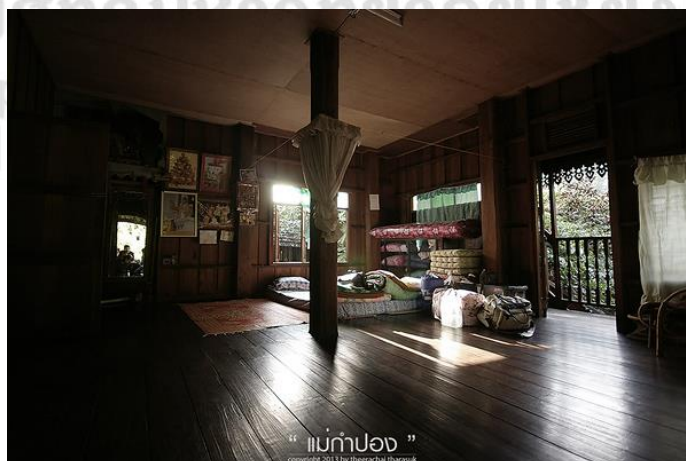
ภาพที่ 4.41 แสดงลักษณะการพักแบบ“Home Stay”

พ่อหลวงพรมมินทร์ พวงมาลา ผู้ใหญ่บ้านแม่กำปอง ว่าการจัดการบ้านพัก “Home Stay” นั้นในช่วงแรกก็ยังมีบ้านที่มีความพร้อมน้อย ซึ่งมีประมาณ 9 หลังที่สนใจและคิดว่าพร้อมในการรับนักท่องเที่ยวเข้าไปพักร่วมในบ้าน