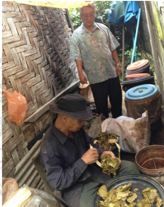
ภาพที่ 4.38 แสดงสภาพวิถีชีวิตของชาวหมู่บ้านแม่กำปองที่มีชีวิตอยู่กับเหมือง

ลิขสิทธิ์มหาวิทยาลัยเชียงใหม่ Copyright © by Chiang Mai University All rights reserved