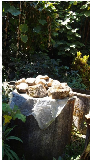
ภาพที่ 4.25 แสดงหลุมซีเมนต์สำหรับเก็บเมี่ยงเพื่อรอจำหน่าย

การจำหน่ายผลิตภัณฑ์เมี่ยงจะจำหน่ายให้กับพ่อค้าคนกลางโดยคิดราคาต่อ หนึ่งภาชนะบรรจุพ่อค้าคนกลางรายใหญ่จะรับซื้อเมี่ยงหมักจากผู้ผลิตเมี่ยง หมักแล้วนำมาเก็บเอาไว้ในหลุมซีเมนต์ขนาดใหญ่ หรือท่อซีเมนต์ เพื่อรอบรรจุใส่ภาชนะบรรจุย่อยเพื่อจำหน่ายไปยังตลาดต่อไป