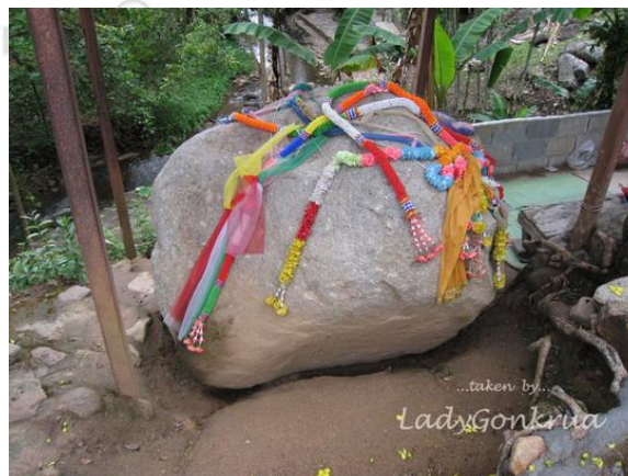
ภาพที่ 4.6 แสดงลักษณะหิน โยกหินคลอน

หินโยกหินคลอน หิน โยกหินคลอนตั้งอยู่ในเขตบ้านธารทอง ตามเส้นทางเข้าสู่หมู่บ้านแม่กำปอง ลักษณะเด่นของหินโยกหินคลอน คือ หินจะโยกคลอนเท่าเดิมไม่ว่าจะผลักแรงขนาดไหน ซึ่งนักท่องเที่ยวให้ความสนใจหินโยกหินคลอนอย่างมาก โดยเฉพาะนักท่องเที่ยวท้องถิ่นจะอธิษฐานให้สมหวังและผลักให้หินโยก เพื่อให้ตนเองบรรลุในสิ่งที่ตั้งความหวัง