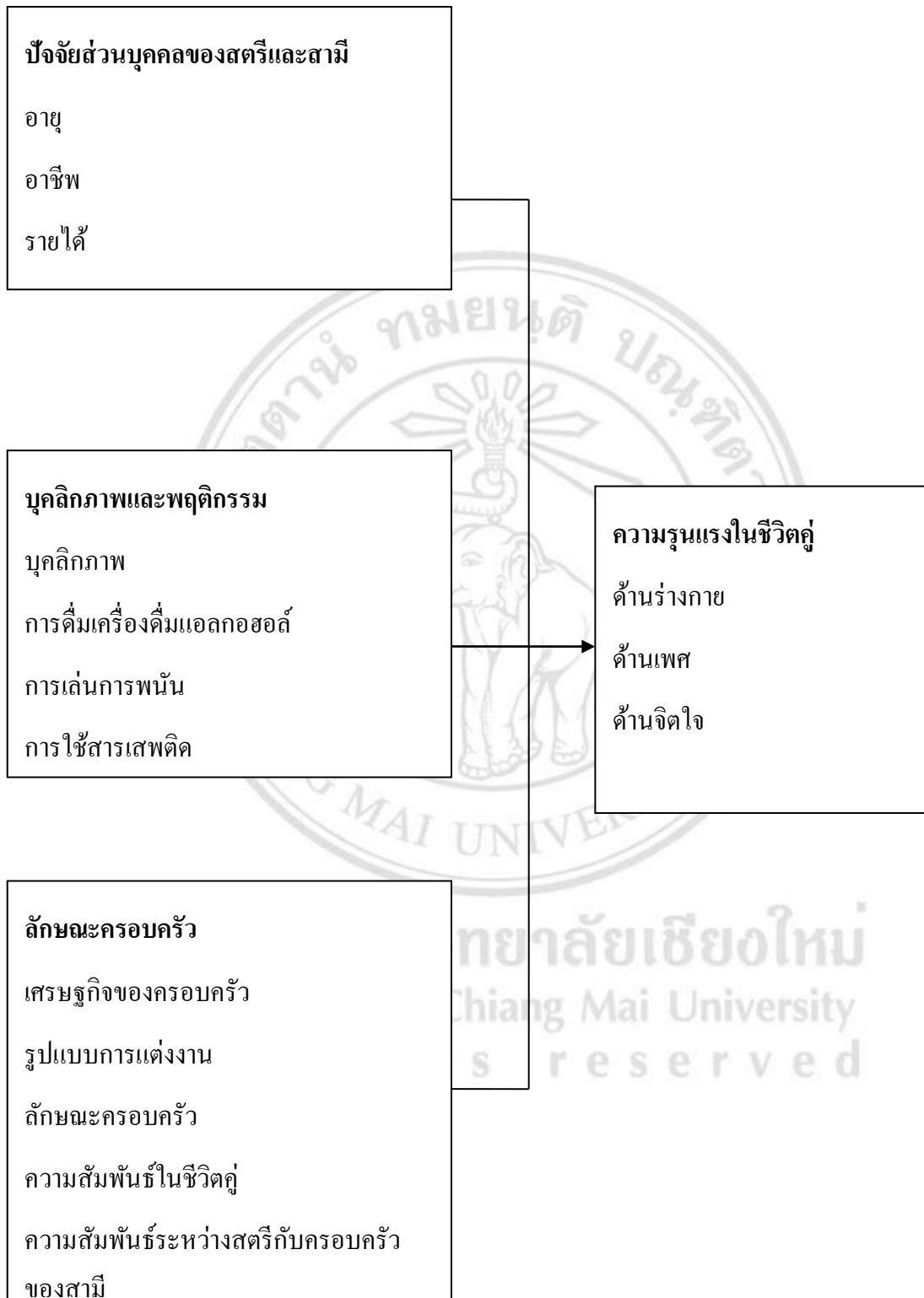
ภาพที่ 1.1 กรอบแนวคิดในการศึกษา