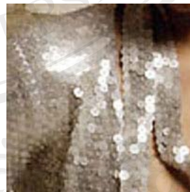
รูปภาพที่ 5.1 ลูกปัดเพชร