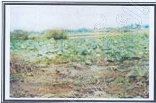
บริเวณพืชไหล่น้ำ