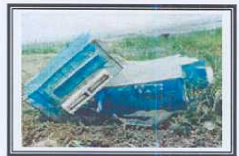
กระชังเลี้ยงปลา