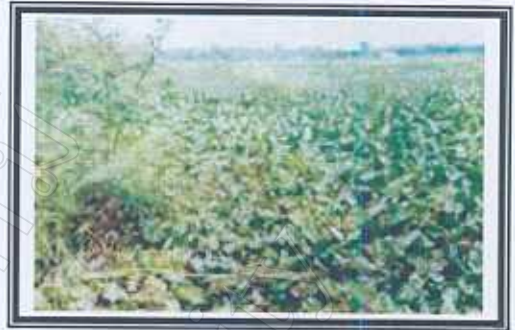
บริเวณพืชลอยน้ำ