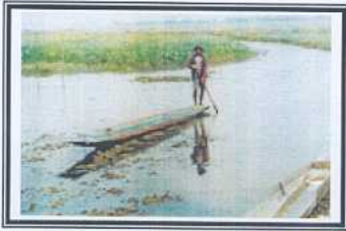
การหาปลาในกว๊านพะเยา