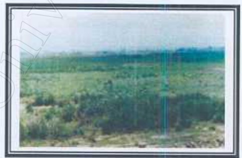
บริเวณพื้นที่สนุ่นน้ำ