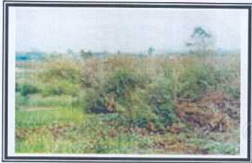
บริเวณไม้ชายน้ำ