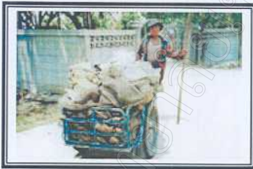
ตาข่ายที่จะไปลงในกว๊าน