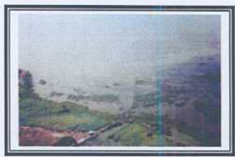
ภาพมองจากเบื้องสูงของป่าชายน้ำ