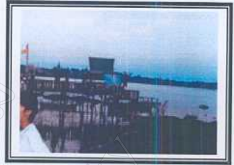
กลุ่มประมงพื้นบ้านฝั่งตะวันออก