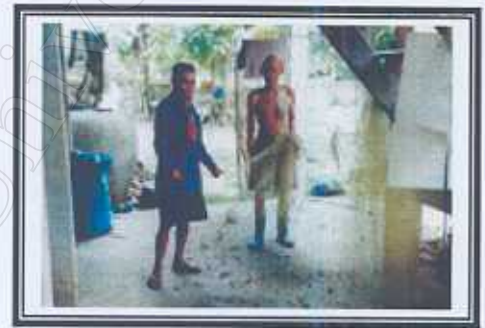
แหเป็นอุปกรณ์พื้นฐาน