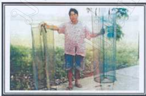
รอบดักกุ้ง