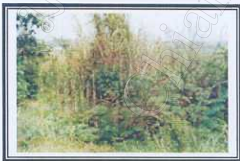
ป่าไม้อร่าบยักษ์ชายน้ำ