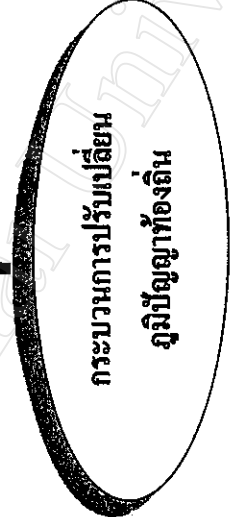
แผนภูมิที่ 1 กรอบแนวคิดการศึกษาของพัฒนาการภูมิปัญญาของชุมชนในการจัดการที่ดินเพื่อการเกษตร

ประเภท - การทำไร่หมุนเวียน - นามธรรม ( นวัตกรรมใหม่) - รูปธรรม ( การอนุรักษ์ดิน น้ำ ป่า) เป้าหมาย - การพึ่งพาตนเองและการมีส่วนร่วม ในการพัฒนาคุณภาพชีวิต และสิ่งแวดล้อม