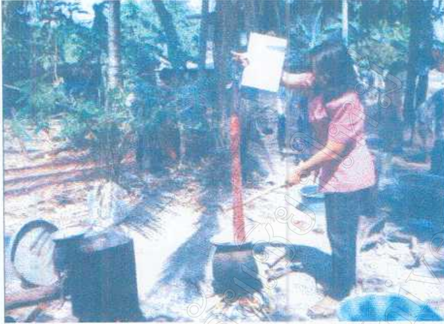
ภาพ 5 การย้อมด้ายด้วยวัสดุจากธรรมชาติ