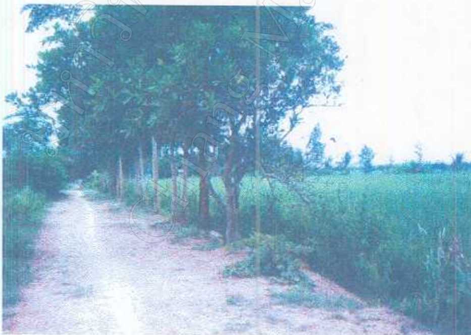
ภาพ 10 การปลูกต้นไม้ที่ให้ร่มเงา รอบ ๆ พื้นที่สาธารณะประโยชน์