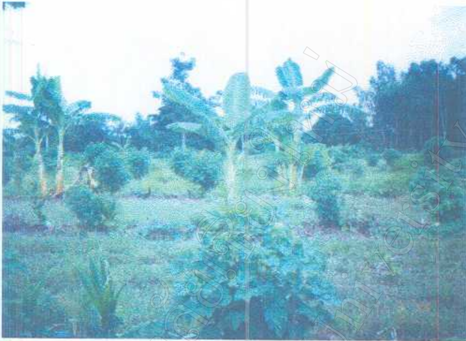
ภาพ 9 การปลูกฝ้ายพันธุ์พื้นบ้านตามพื้นที่หัวไร่ ปลายนา