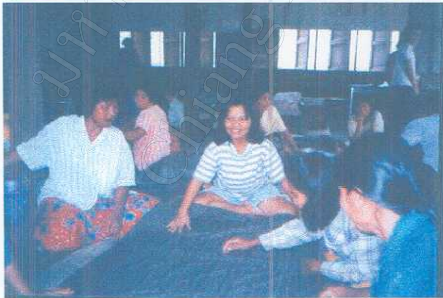
ภาพ 8 การพุดคุยภายในกลุ่มผู้ผลิตในวันวัดขนาดความยาวของผ้าทุกวันที่ 2 ของเดือน