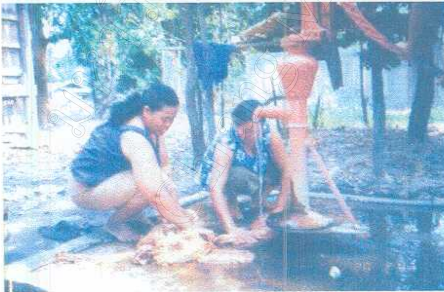
ภาพ 6 การล้างเส้นด้ายที่สร้างลายเสร็จแล้ว