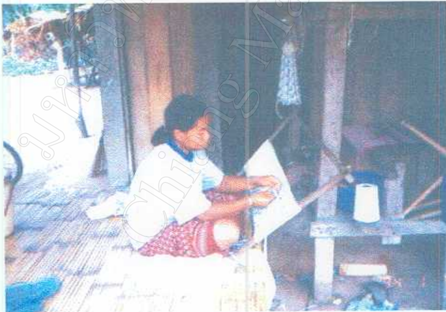
ภาพ 4 การมัดหมี่ หรือการสร้างลวดลายให้แก่ผ้า