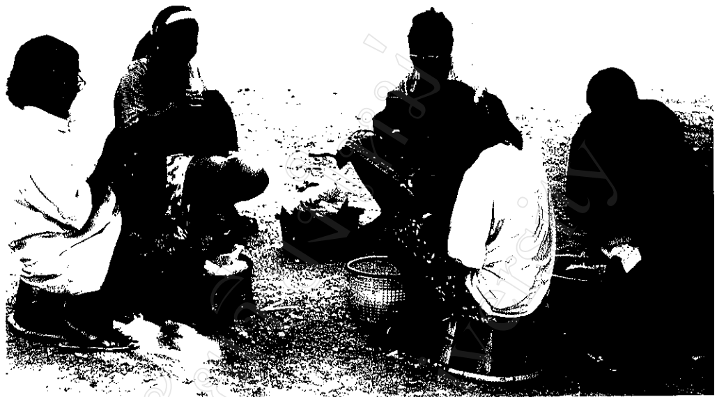
ภาพที่ 13 : กลุ่มแม่บ้านบางส่วนมีอาชีพทอผ้า และปักลายผ้าชาย