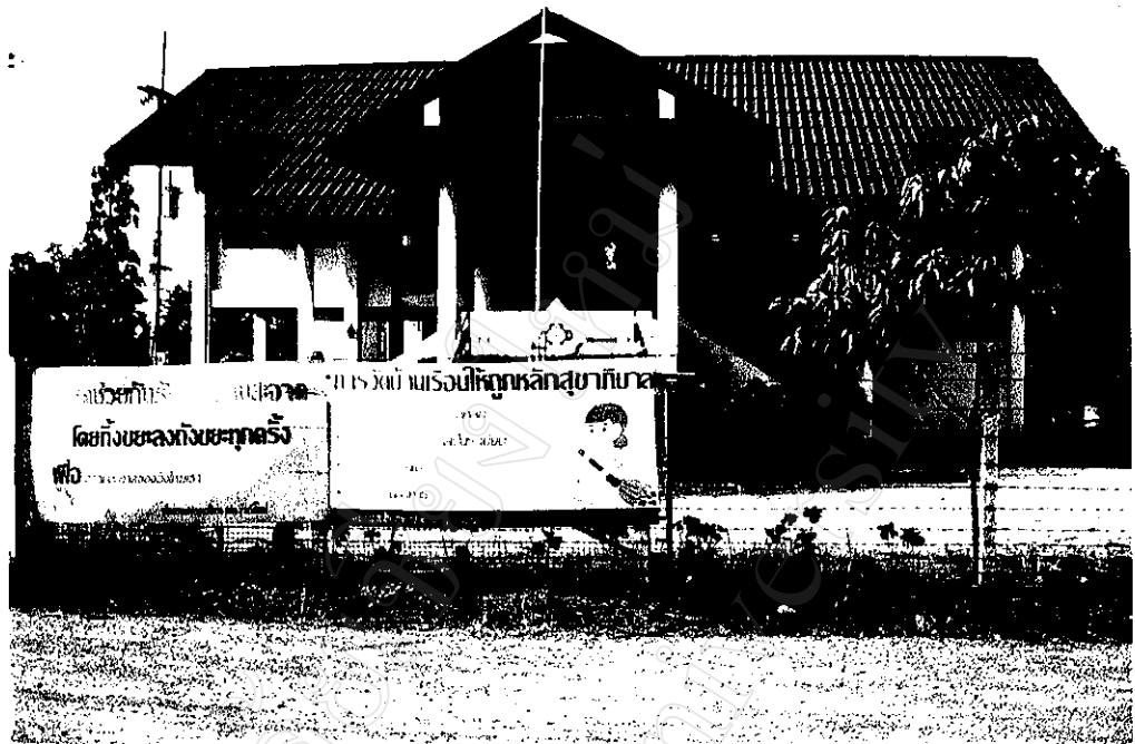
ภาพที่ 3 : สถานีอนามัยบ้านวังใหม่