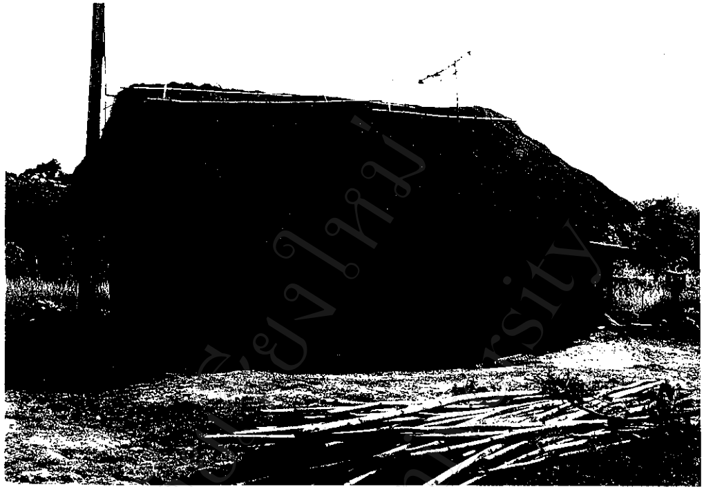
ภาพที่ 7 : สภาพบ้านชาวเขาเผ่าลัวะ