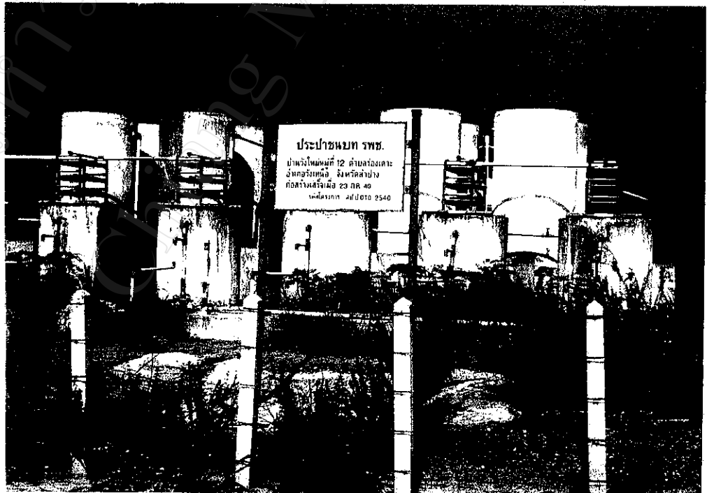
ภาพที่ 6 : ระบบประปาจ่ายน้ำในหมู่บ้านวังใหม่ สร้างโดยสำนักงานเร่งรัดพัฒนาชนบท