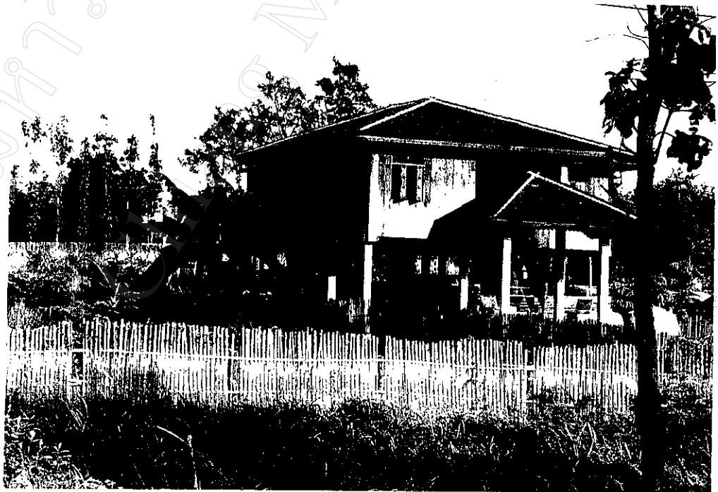
ภาพที่ 8 : สภาพบ้านชาวเขาเผ่าเย้า