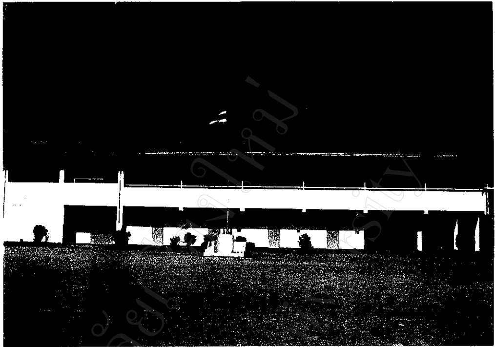
ภาพที่ 1 : โรงเรียนบ้านวังใหม่ที่สำนักงานประถมศึกษาจัดสร้างให้ในหมู่บ้าน