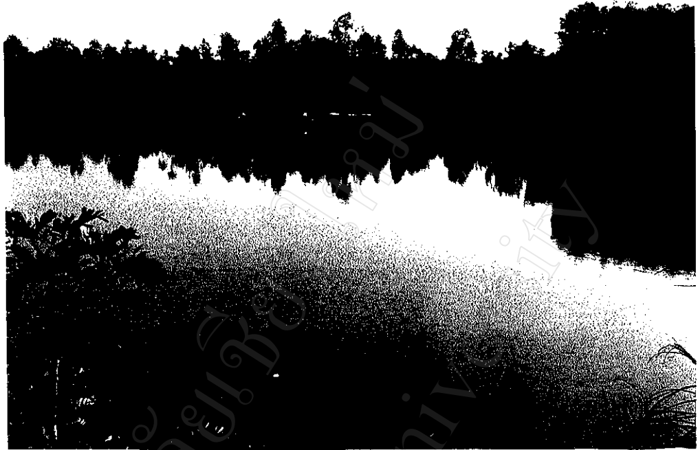
ภาพที่ 5 : สระน้ำขนาดใหญ่ในหมู่บ้านวังใหม่