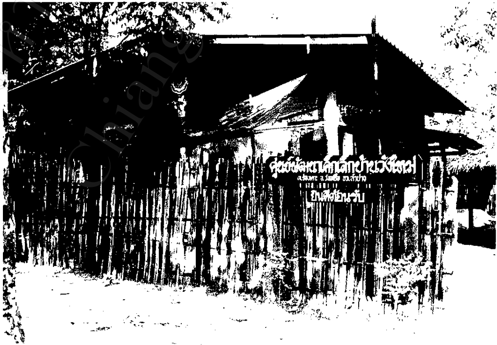
ภาพที่ 2 : ศูนย์พัฒนาเด็กเล็ก จัดสร้างโดยกรมพัฒนาชุมชน