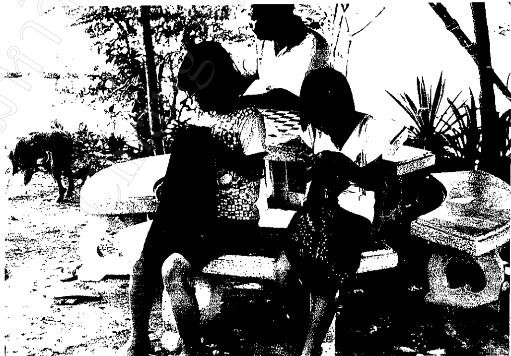
ภาพที่ 14 : เด็กสาวในหมู่บ้านกำลังปักลายผ้าตามเฝ้าของตนเอง