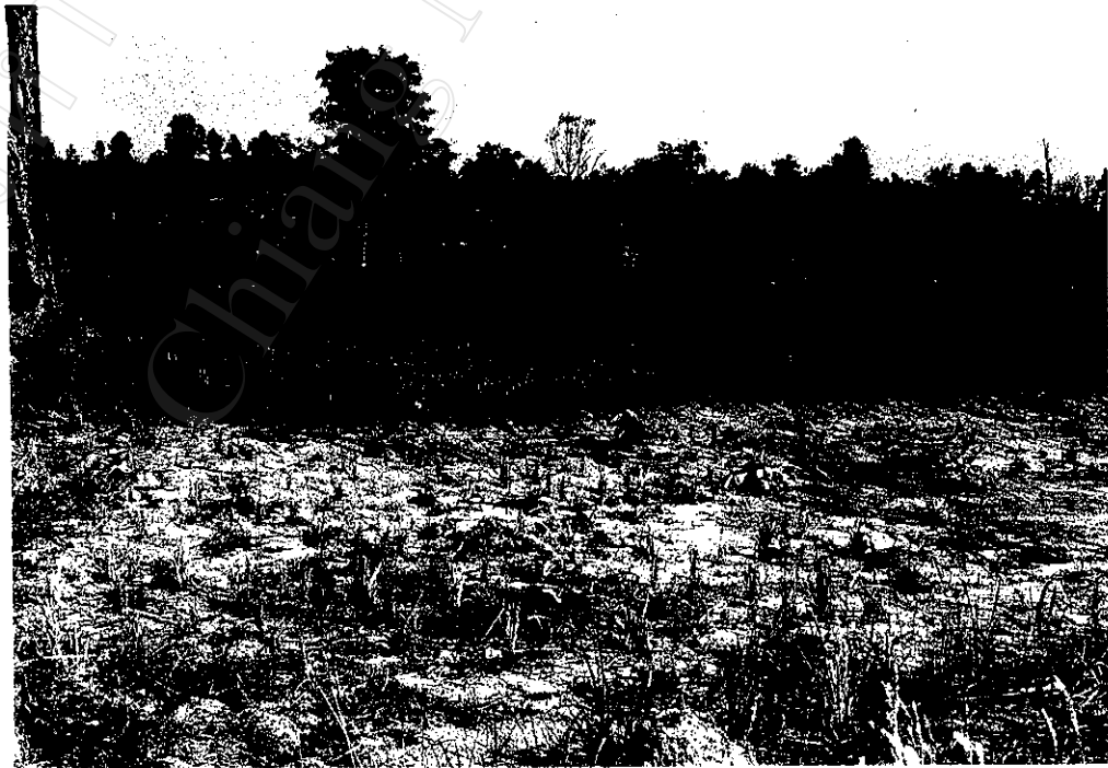
ภาพที่ 10 : แปลงที่ดินทำกินที่สามารถทำกินได้