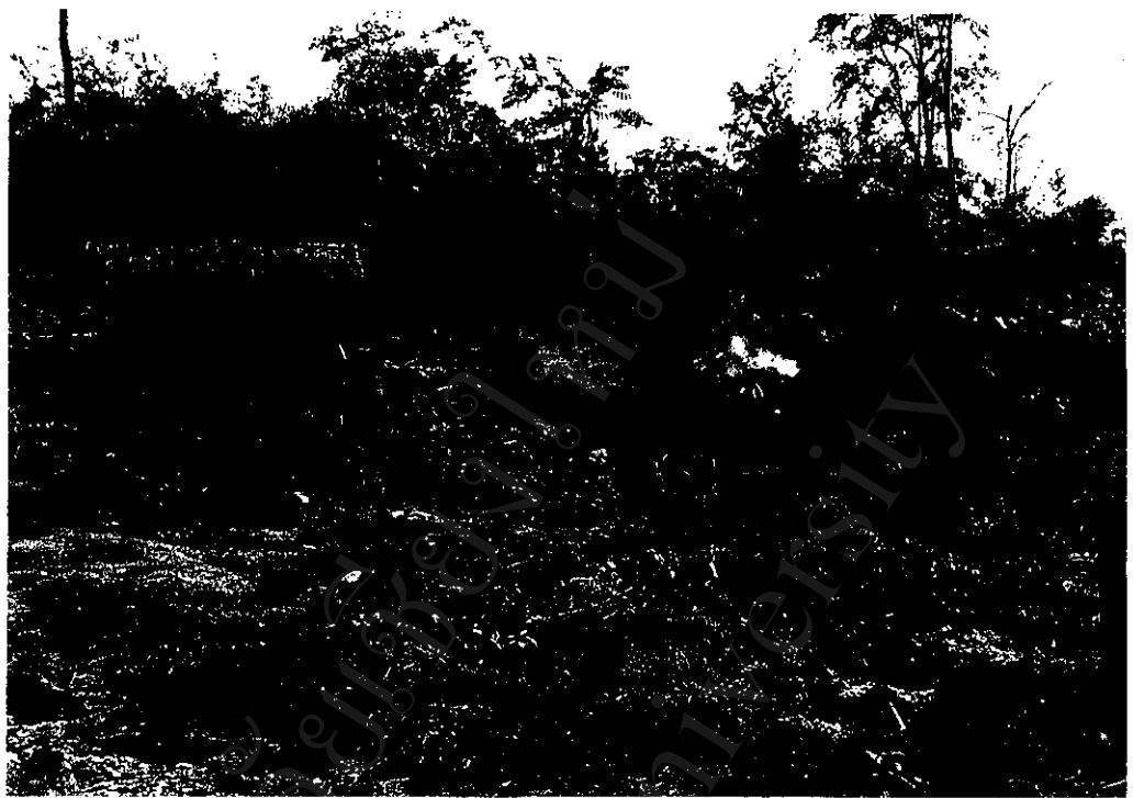
ภาพที่ 11 : ชาวบ้านบางส่วนมีอาชีพเผาถ่านขาย