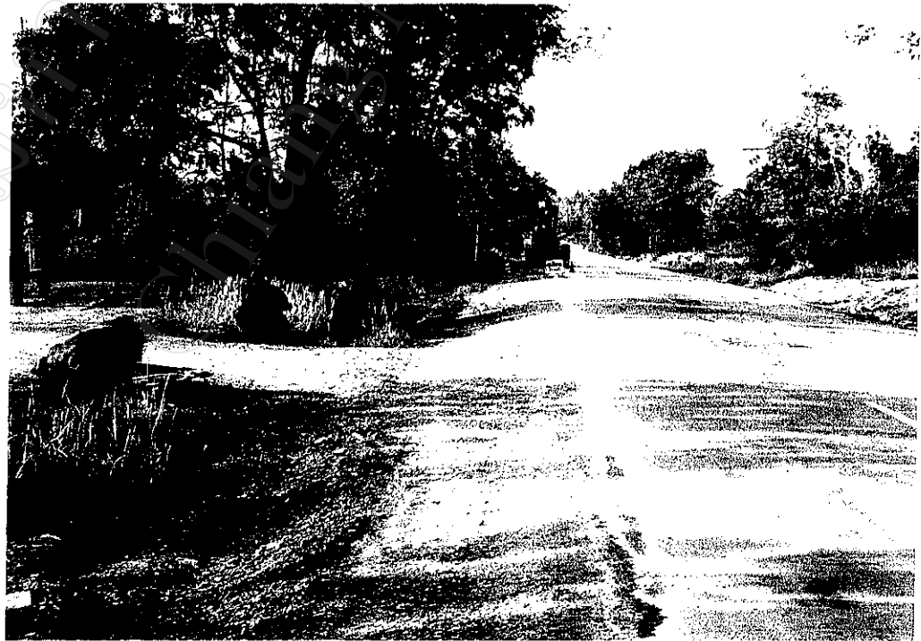
ภาพที่ 12 : เส้นทางผ่านหมู่บ้านวังใหม่ ซึ่งมีถ่านวางขาย