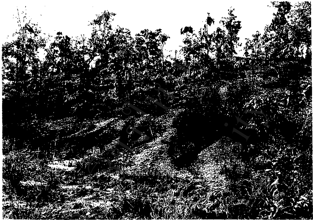
ภาพที่ 9 : แปลงที่ดินทำกินที่ สปก. จัดให้แต่ไม่สามารถทำกินได้