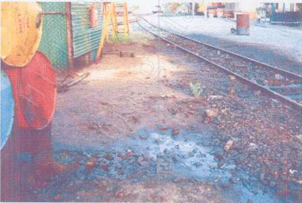
น้ำมันเตาที่ใช้แล้วนำมาเก็บใส่ถัง