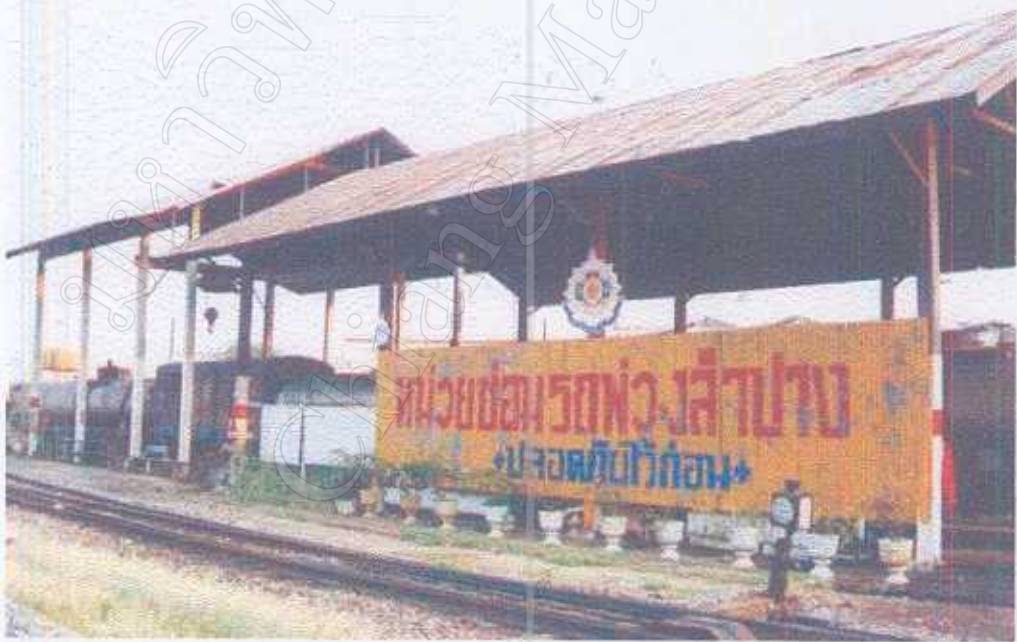
บริเวณที่ทำการซ่อมรถจักรและรถฟอง