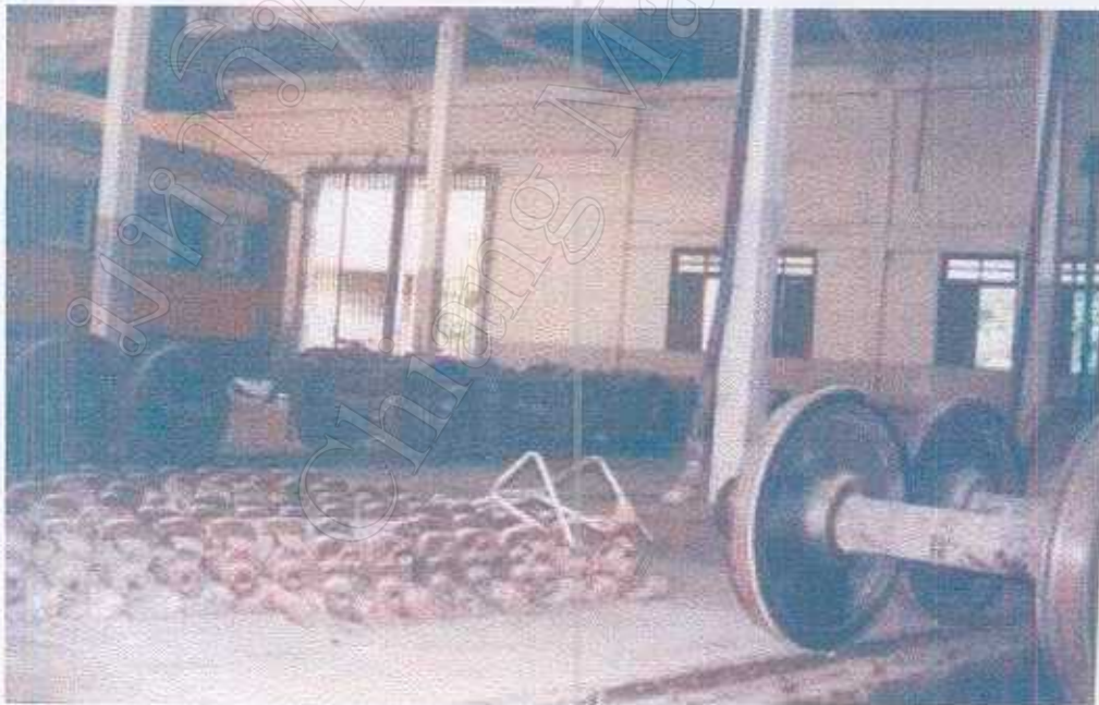
อุปกรณ์ภายในโรงรถจักร