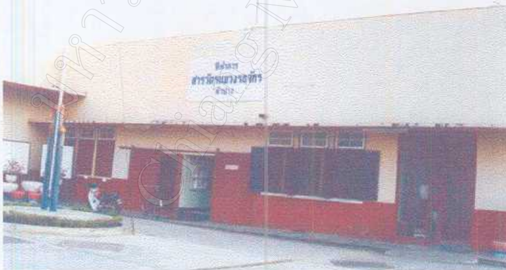
ที่ทำการสารวัตรแขวงรถจักร ลำปาง