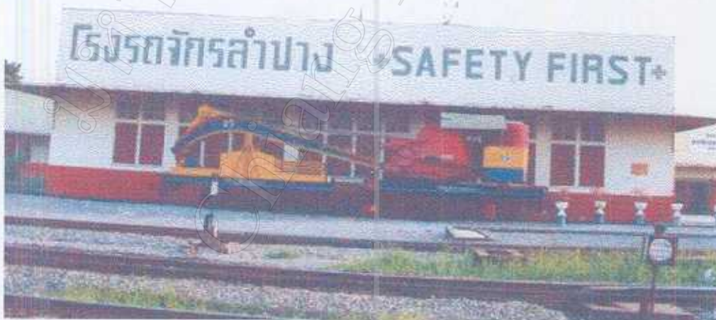
โรงรถจักร ลำปาง