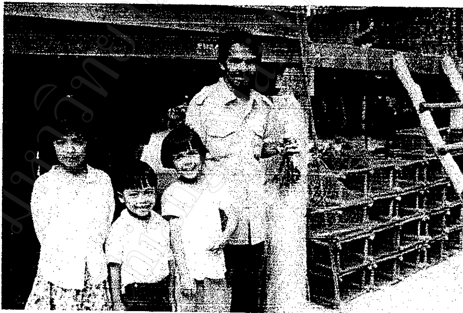
วิถีชีวิตของชาวบ้าน บ้านแหลมมะขามพื้นที่ที่ล้อมรอบด้วยน้ำ การเดินทางจะต้องอาศัยเรือ ตัวบ้านจะมีลักษณะเป็นได้ฤนยกพื้นสูง ตามระดับน้ำขึ้น-น้ำลง