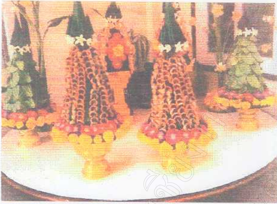
สู่มหามาก