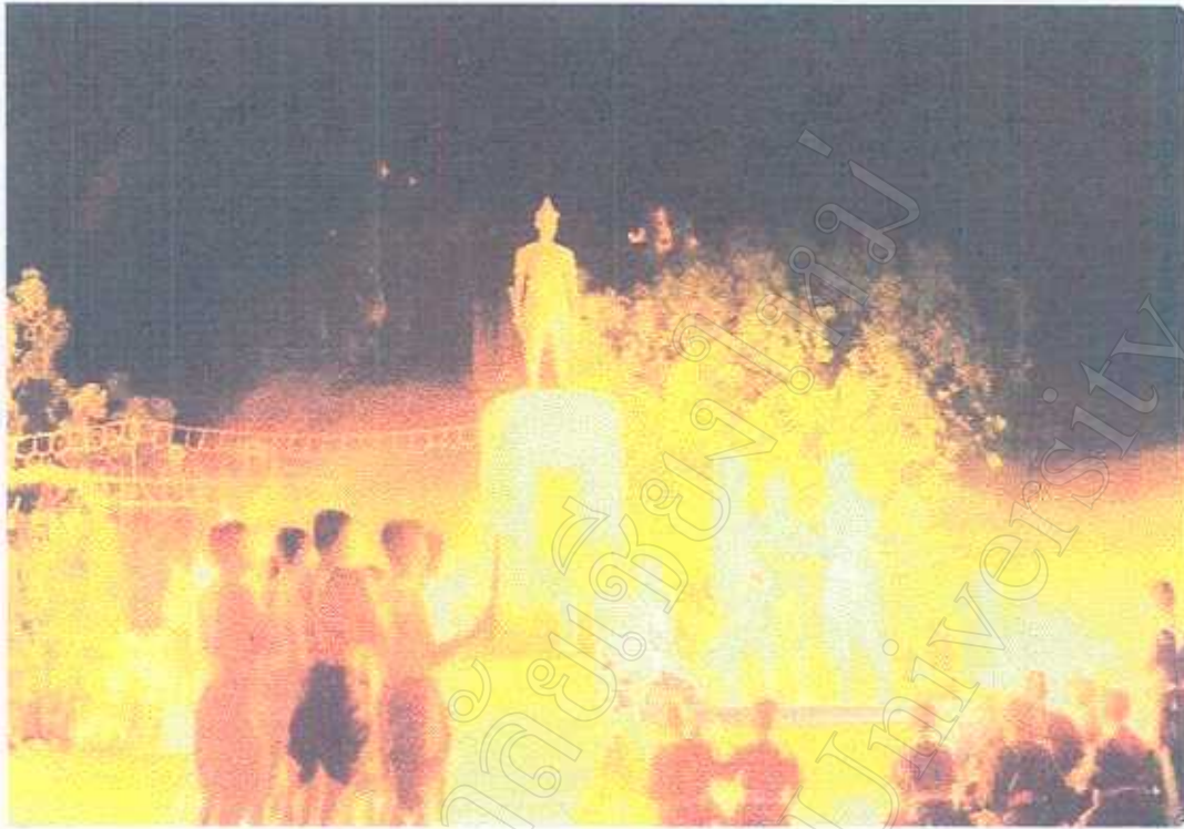
มหาชนร่วมในพิธีบวงสรวงพ่อขุนงำเมือง