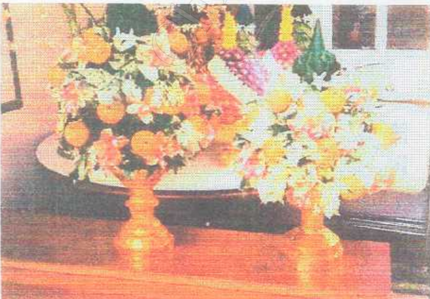
ชั้นต้อมก้อม