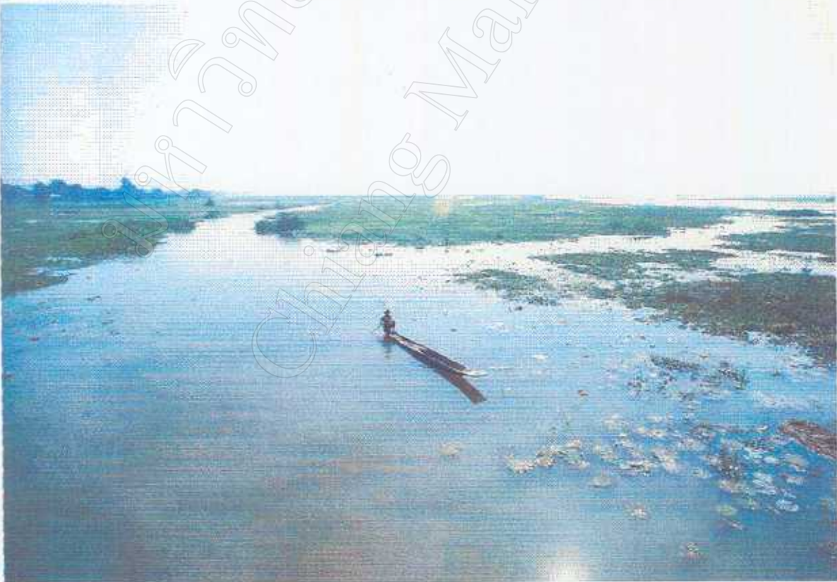
แผนที่ภาคเหนือของประเทศไทย และต้นน้ำอิงที่ไหลลงกว๊านพะเยา