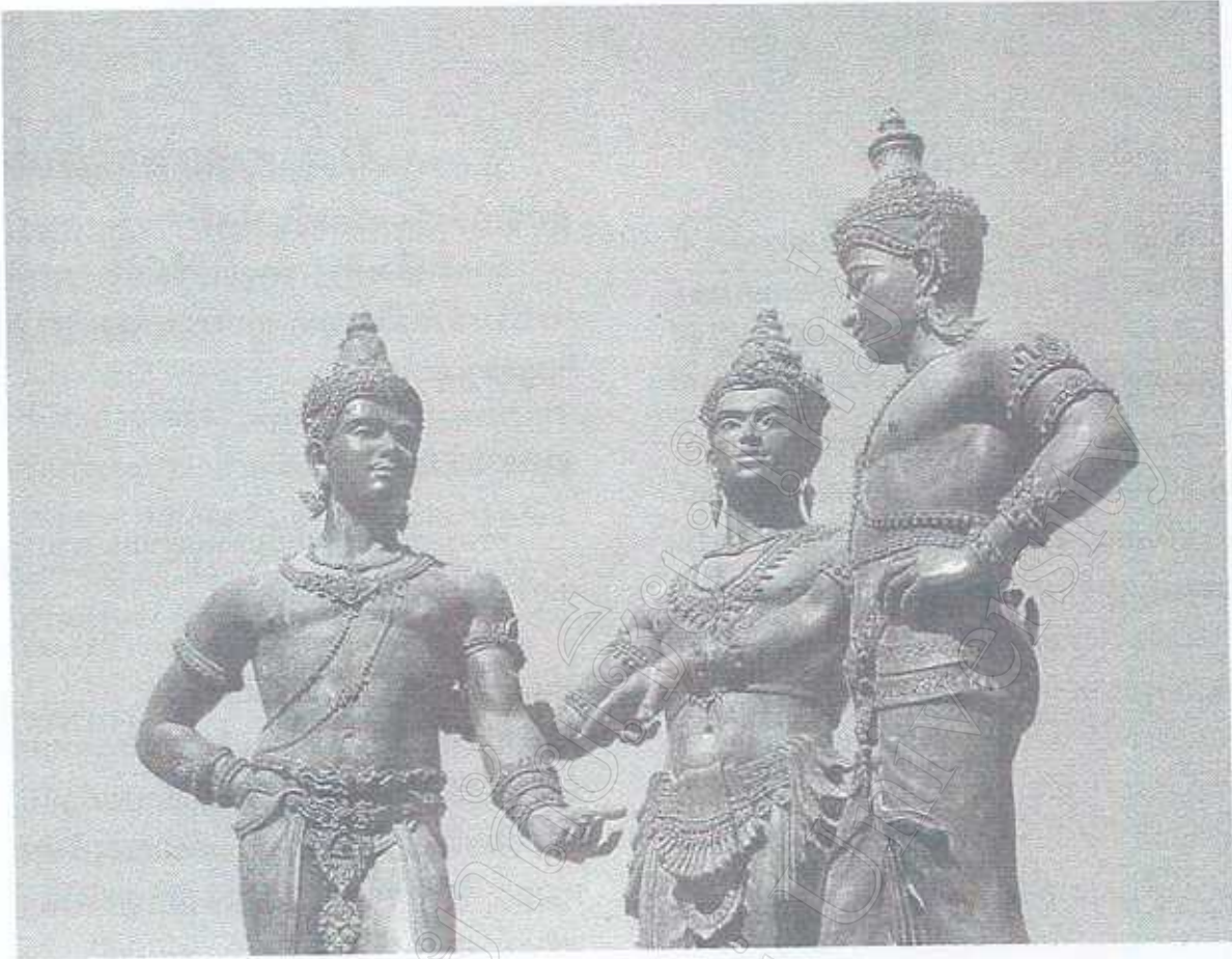
อนุสาวรีย์ ๓ ทศกวี คือ พญามังราย พญางำเมือง และพระร่วง ประดิษฐานอยู่ที่เชียงใหม่ แม่น้ำสายคา หรือน้ำแม่อิงที่เมืองพะเยา