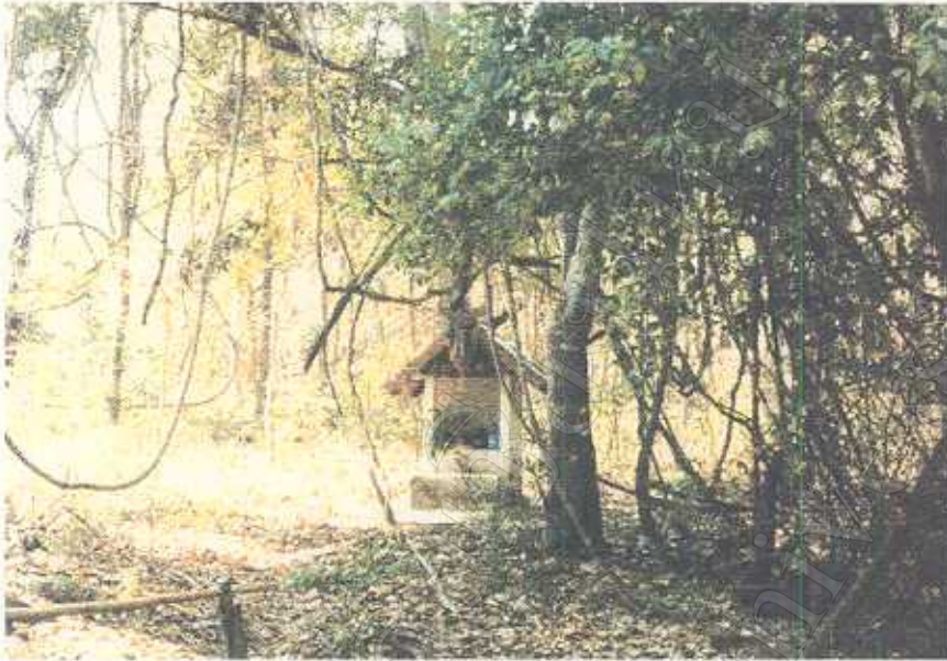
ศาล สังกัดศีลพิธีที่ตั้งอยู่ในป่าชุมชนบ้านทุ่งยาว