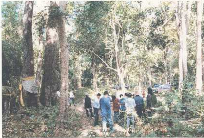
การเดินป่าเพื่อสำรวจสมุนไพร