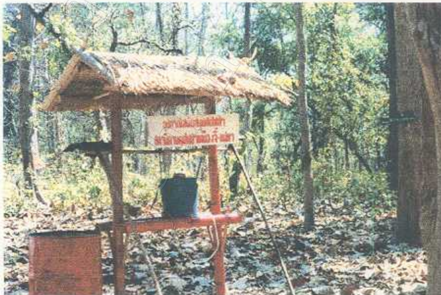
อุปกรณ์ดับไฟป่าที่ตั้งอยู่ในป่าชุมชนบ้านทุ่งยาว