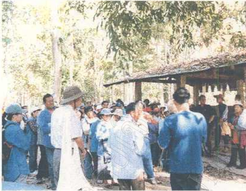
การประชุมกลุ่มของชาวบ้านในการเดินป่าสำรวจสมุนไพร