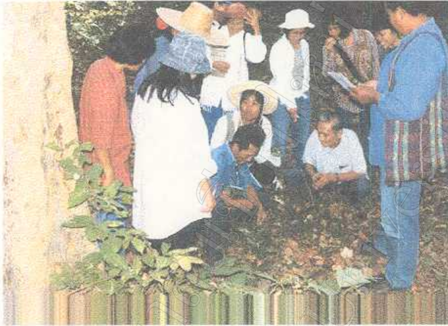
การเดินป่าเพื่อสำรวจชุมชนไพรของชาวบ้าน