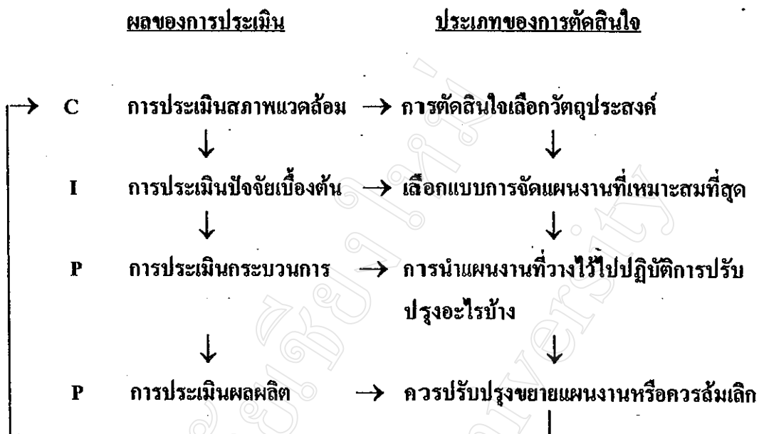
แผนภูมิที่ 2 แผนสร้างความสัมพันธ์ระหว่างการประเมิน กับการตัดสินใจในรูปแบบซิปปี