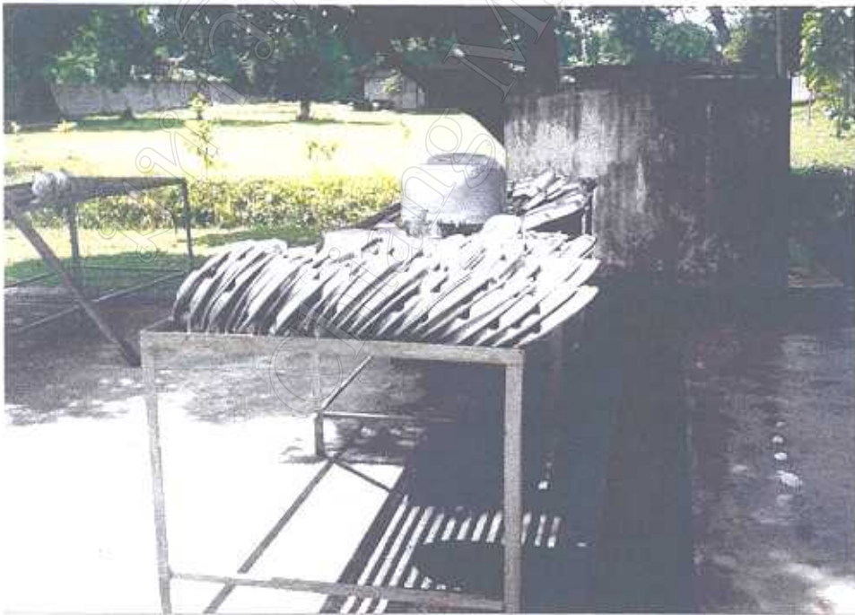
สภาพของโรงเลี้ยง มทบ. 39