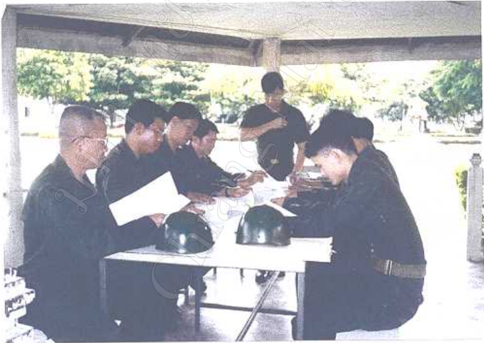
การทำ Focus group Discussion technique. กับ นายทหารชั้นประทวน และนายทหารสัญญาบัตร เมื่อ ๑ ค.ค. ๕๑