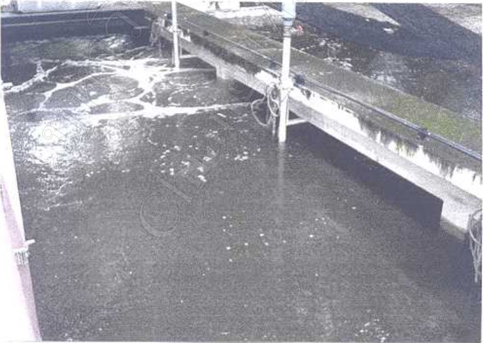
บ่อบำบัดน้ำเสียของโรงพยาบาลค่ายกาวิละ มทบ. 33