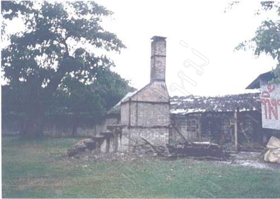
เตาเผาขยะข้างเรือนจำ มทบ. 33