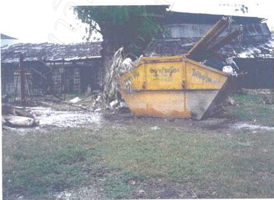
ถังเก็บขยะสำหรับทิ้งเป็นส่วนรวมซึ่งจะนำไปทิ้งหลังสนามยิงปืน มทบ. 33