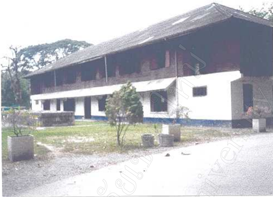
หมวดพลเสนารักษ์ โรงพยาบาลค่ายกาวิละ มทบ. 33