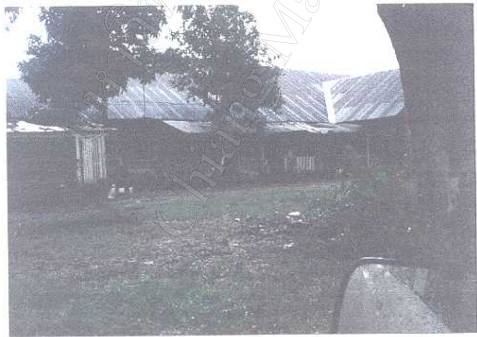
สภาพบ้านพักของ .มทบ. 33 หลังซอย 5