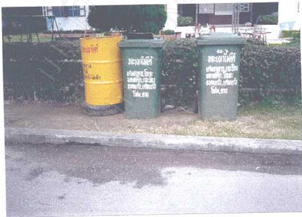
การแยกขยะภายในค่ายกาวิละ เพื่อจัดการนำไปทิ้ง และทำลายตามขยะที่แยก ♡