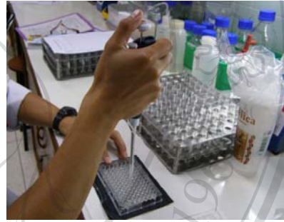
ภาพที่ ข9. การดูดตัวอย่างสารละลายลงใน Microplate