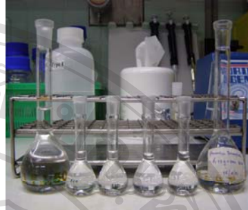
ภาพที่ ๕. การเตรียมสารละลายมาตรฐาน