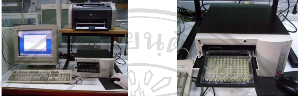
ภาพที่ ข11. การวัดค่า Absorbance ของสารหลังเกิดปฏิกิริยาด้วย Microplate reader

ลิขสิทธิ์มหาวิทยาลัยเชียงใหม่ Copyright© by Chiang Mai University All rights reserved