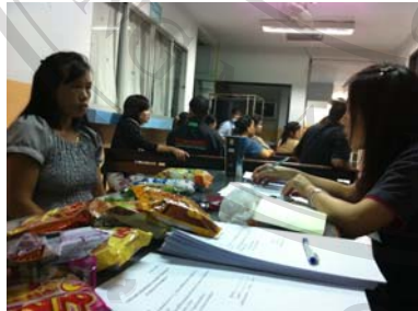
ภาพที่ ข 3. การสัมภาษณ์หญิงตั้งครรภ์ที่เข้าร่วม โครงการ