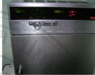
ภาพที่ ข8. การย่อยตัวอย่างปัสสาวะในตู้อบลมร้อนที่อุณหภูมิ 100 องศาเซลเซียส