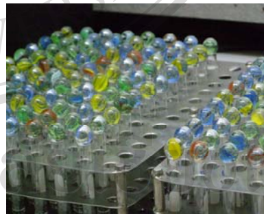
ภาพที่ ๗. การเขย่าผสมสารละลาย Ammonium persulphate กับตัวอย่างปัสสาวะ