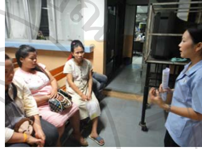
ภาพที่ ข 2. ให้ความรู้เกี่ยวกับเรื่องไอโอดีนกับ หญิงตั้งครรภ์