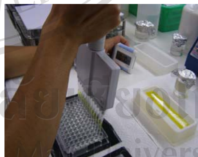
ภาพที่ ข10. การเติมสารละลาย Arsenious oxide และ Ceric sulfate ใน Microplate