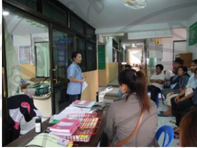
ภาพที่ ข 1. การชี้แจงการดำเนินโครงการโดย หัวหน้าโครงการวิจัย