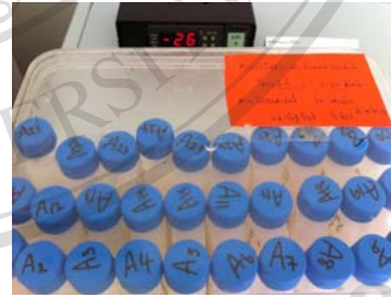
ภาพที่ ข 4. ตัวอย่างปัสสาวะส่งเก็บที่สถาบันวิจัย