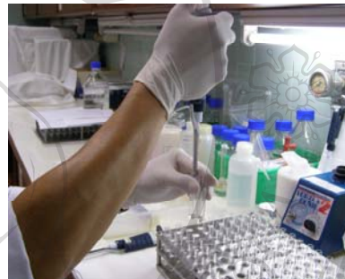
ภาพที่ ๖. การดูดตัวอย่างปัสสาวะลงในหลอดทดลอง