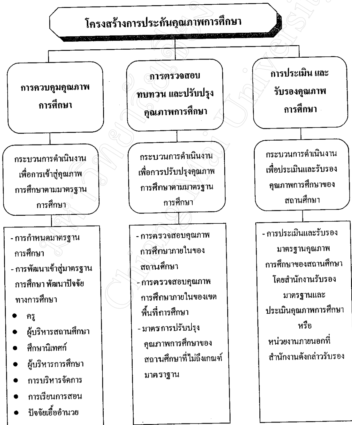
แผนภูมิ 2 แสดง โครงสร้างการประกันคุณภาพการศึกษาของกรมสามัญศึกษา

จากองค์ประกอบหลักของการประกันคุณภาพการศึกษาดังกล่าวสามารถแสดงโครงสร้าง ของการประกันคุณภาพการศึกษาของกรมสามัญศึกษาได้ ตามแผนภูมิ 2 แผนภูมิแสดงโครงสร้าง ของการประกันคุณภาพการศึกษา ดังนี้