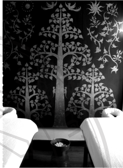
ภาพที่ 1.2 ภาพตกแต่งผนังในโอเอซิส สปา อ.เมือง จังหวัด เชียงใหม่ พ.ศ. 2550

จากภาพข้างต้นจะพบว่า ลายคำนั้นถูกนำไปใช้ตกแต่งในสถานที่อื่นที่ไม่ใช่พุทธสถาน เพราะในปัจจุบันลายคำถูกว่าเป็นองค์ประกอบที่ใช้ประดับตกแต่งเท่านั้น ดังนั้นจึงควรมีการศึกษา ทบทวน ตั้งคำถามต่อกระบวนการวิจัยที่เกิดขึ้นกับ “ลายคำ” เพราะที่ผ่านมาส่วนใหญ่มีศึกษาในด้านของ รูปร่าง รูปทรง ที่มา ที่ตั้ง วิธีการสร้าง ดังนั้นในมุมมองที่ผ่านนี้ “ลายคำเป็นเพียงลวดลายประดับตกแต่ง โดยอาศัยคำอธิบายจากหลักการของการออกแบบวัตถุ รูปร่าง รูปทรง” แต่ยังมีส่วนน้อยมากที่ศึกษาลายคำในฐานะที่เป็นองค์ประกอบหนึ่งของการกำหนดรับรู้และก่อรูปพื้นที่ศักดิ์สิทธิ์