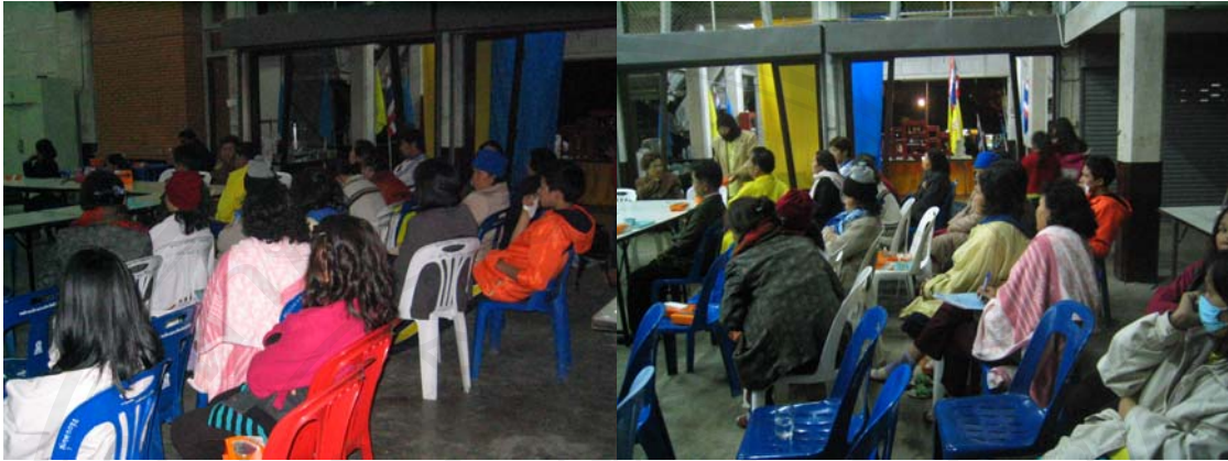
รูปภาพกิจกรรมที่ 4 กิจกรรม “ชุมชนรอบวัดน่าอยู่ครั้งที่ 2”(ต่อ)