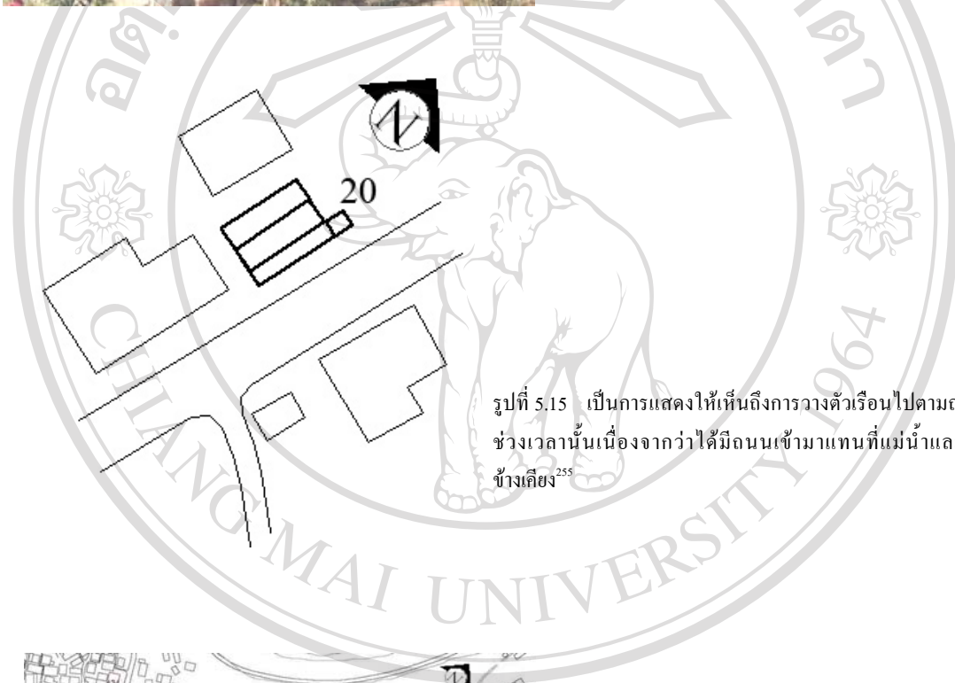
รูปที่ 5.15 เป็นการแสดงให้เห็นถึงการวางตัวเรือนไปตามถนนในช่วงเวลานั้นเนื่องจากว่าได้มีถนนเข้ามาแทนที่แม่น้ำและเรือนข้างเคียง 255