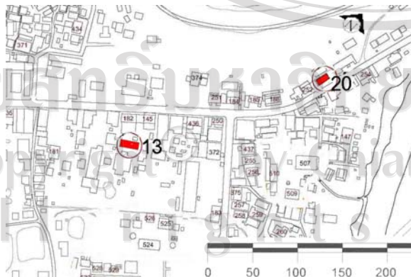
รูปที่ 5.16 แสดงให้เห็นถึงที่ตั้งของเรือนที่ศึกษาและโครงสร้างรวมของการวางทิศทางของตัวเรือน จากการสัมภาษณ์คนที่อยู่เรือนที่ศึกษาได้บอกว่าเรือนส่วนมากจะปลูกไปตามน้ำและได้เทียบกับเรือนข้างเคียงด้วยโดยมีโครงสร้างหลักแบบเดิมในช่วงนั้นได้มีทางรถยนต์แต่โครงสร้างของเรือนยังเหมือนเดิม 256