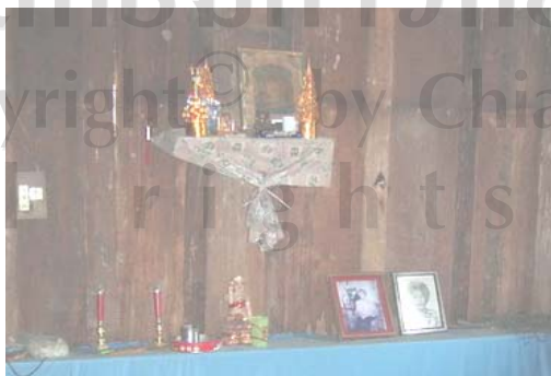
รูปที่ 5.13 เรือนศึกษาหลังที่ 20 แสดงให้เห็นว่าตรงเสาขวัญที่ยังคง อยู่และเป็นที่บูชาเทวดาเรือนหรือเป็นที่บูชาบรรพบุรุษที่ได้ ล่วงลับไปแล้วโดยจัดไว้ทางที่เป็นหัวที่นอนของเรือน 253

รูปที่นำมาเสนอในช่วงนี้อาจจะไม่สามารถตอบสนองตามคติความเชื่อของการปลูกเรือน ได้เนื่องจากว่าคติความเชื่อของการปลูกเรือนหลายอย่างที่ไม่ได้นำมาใช้ในการปลูกเรือน สิ่งที่มีก็คือ ตรงเสาเอกหรือเสาขวัญก็จะเป็นเสาที่เป็นมงคล (ดูรูปที่ 5.13) ซึ่งจะเห็นได้จากรูปถ่ายว่าเป็นที่บูชา เทวดาเรือนหรือเป็นที่บูชาบรรพบุรุษที่ได้ล่วงลับไปแล้ว เมื่อมาถึงปัจจุบันได้มีเรือนบางหลังได้มีการ ต่อเติม เช่น ได้มีการก่อผนังรอบใต้ถุนโดยใช้วัสดุใหม่เข้ามาใช้มากขึ้น ซึ่งเป็นผนังก่ออิฐฉาบ ปูน (ดูรูปที่ 5.14) และเมื่อมีถนนเข้ามาก็จะเห็นว่ามิดถนนด้านหน้าของเรือน (ดูรูปที่ 5.15) และจะ เห็นได้ว่าเรือนที่อยู่ในเขตอนุรักษ์เมืองหลวงพระบางส่วนมากจะวางทิศของเรือนไปตามน้ำหรือ ขนานกับแม่น้ำนั่นเอง (ดูรูปที่ 5.16)