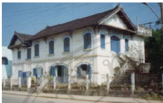
รูปที่ 5.1 เป็นรูปเรือนที่สร้างเพื่อให้แก่คนฝรั่งเศสซึ่งได้สร้างด้วยวัสดุที่ทันสมัย เช่น อิฐ ดินขอ ปูน แต่ยังใช้รูปแบบเดิม 213