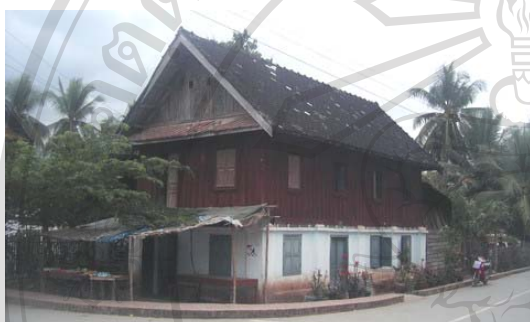
รูปที่ 5.2 เป็นรูปเรือนของผู้ที่เป็นขุนนางใหญ่เท่านั้นที่จะเลียนแบบเรือนที่ปลูกในช่วงของฝรั่งเศส แต่ก็ยังใช้วัสดุที่ผสมผสานระหว่างก่ออิฐฉาบปูนกับไม้ 214