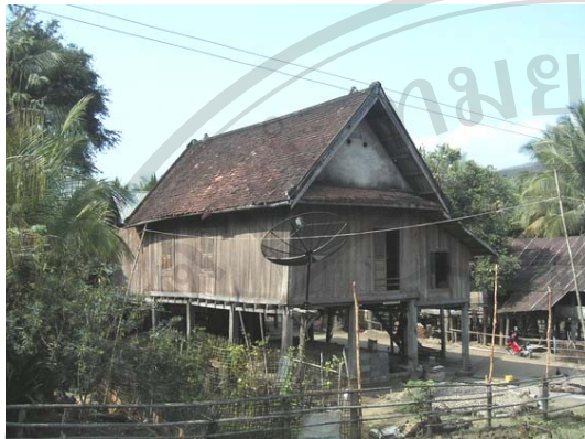
รูปที่ 5.3 เรือนศึกษาหลังที่ 8 ปลูกเมื่อปีค.ศ.1940 เป็นเรือนยกใต้ถุนสูงที่สามารถดำรงชีวิตอยู่ได้ในช่วงมีปัญหาน้ำท่วมในฤดูน้ำหลาก 215

จำนวนมากที่ได้รับผลกระทบจากปัญหาน้ำท่วมในฤดูน้ำหลาก ดังนั้นรูปแบบเรือนส่วนมากเป็นเรือนยกใต้ถุนสูงสามารถดำรงชีวิตอยู่ได้ในช่วงมีปัญหาน้ำท่วม (ดูรูปที่ 5.3)