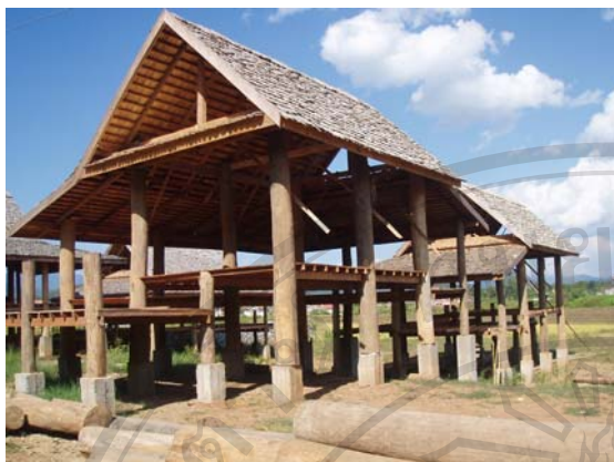
รูปที่ 5.18 เรือนที่ศึกษาหลังที่ 24 ปลูกในปี ค.ศ. 2005 แสดงให้เห็นถึงรูปแบบดั้งเดิมเรือนเผ่าลาวลุ่มที่ได้เปลี่ยนหน้าที่จากเรือนอยู่อาศัยมาเป็นร้านอาหารเพื่อตอบสนองให้กับนักท่องเที่ยว 269