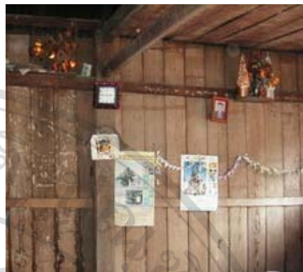
รูปที่ 5.11 ภาพในเรือนหลังที่ 16 แสดงให้เห็นเสาขวัญ ล่วงลับไปแล้วโดยจัดไว้ทางที่เป็นหัวที่นอน 241