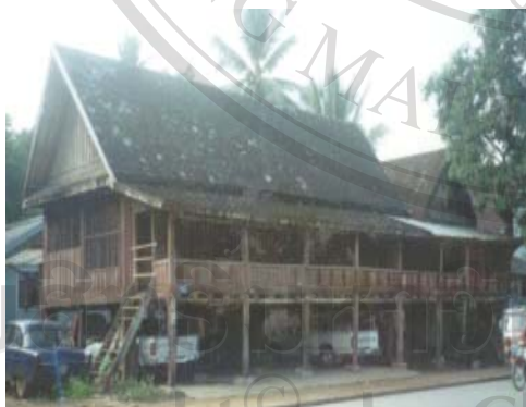
รูปที่ 5.5 เป็นเรือนหลังที่ 1 ปลูกในปีค.ศ.196 เป็นรูปที่แสดงให้เห็นถึงรูปแบบของเรือนลาวลุ่มแบบดั้งเดิมที่ปลูกด้วยไม้ทั้งหมดเนื่องจากว่าในการปลูกเรือนในตอนนั้นได้นำเอาคติความเชื่อของการปลูกเรือนเข้ามาใช้ 223

“ได้มีไม้ห้ามแท่นท่านไม่ให้เอาไม้ตายยืนต้นเพราะกลัวเป็น ไม้ผุพัง ไม้ที่อยู่แคว่น้ำ (ไม้แย่งเงา) กลัวตัดเอาซาก ไม้ที่อยู่ป่าซากกลัวเป็น ไม้ที่มีเจ้า ไม้ที่อยู่ที่แคบจะทำให้ไปตัดเอาซาก ไม้แบบนี้ถ้าเอามาปลูกเรือนก็จะลำบาก และอัปมงคล จะทำให้เจ็บไข้ได้ป่วยถึงกับชีวิต ตอนที่ปลูกเรือนนั้นก็ยิ่งถือกันอยู่ ทิศของ ไม้ล้มนี้จะต้องให้ผู้ที่รู้เรื่องนี้ไปด้วยท่านจะบอกแล้วเราก็ทำตามให้ถูกต้องเพื่อเป็นสิริมงคล ตอนที่ปลูกเรือนนั้นก็ยังมีอยู่ การเลือกไม้ก็เช่นเดียวกัน จะต้องให้ผู้ที่รู้เรื่อง ไม้เลือกให้จะเลือกเอาต้น ไม้เนื้อแข็งที่ใหญ่งามดี ส่วนหลายจะเลือกเอาไม้แคน ไม้คู่ และเป็น ไม้ที่เกิดตามเนินเขาเพื่อสะดวก และสามารถไปเอาไม้ได้ง่ายตอนที่ปลูกเรือนนั้นก็ยิ่งได้ไปเลือกไม้อยู่ป่า” 222