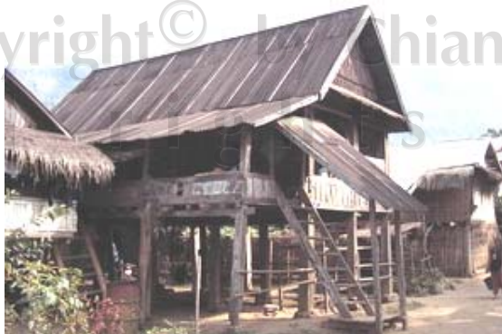
รูปที่ 5.9 เรือนที่ศึกษาหลังที่ 15 ปลูกในปี ค.ศ.1960 239

รูปแบบของเรือนที่ปรากฏให้เห็นจะเป็นเรือนไม้ที่สวยงาม แข็งแรงที่มีความคงทน ซึ่งจะเห็นได้จากรูปถ่าย (ดูรูปที่ 5.9) เรือนของเหล่าลาวลุ่มเป็นผลมาจากคติความเชื่อของการปลูกเรือนนั่นเองดังจะเห็นได้จากรูปที่อยู่ภายในของเรือน (ดูรูปที่ 5.10) ที่เสามงคลมีที่บูชาเทวดาเรือนหรือเป็นที่บูชาบรรพบุรุษที่ได้ล่วงลับไปแล้ว (ดูรูปที่ 5.11) เนื่องจากว่าการปลูกเรือนยังมีได้มีการเปลี่ยนแปลงแต่อย่างใด ในการนำคติความเชื่อมาใช้ในการปลูกเรือนและรูปแบบของเรือนก็ยังเป็นรูปแบบเดิมดังช่วงแรกรวมทั้งการวางทิศทางของเรือนได้วางทิศตามคติความเชื่อที่ว่าเรือนต้องขนานไปกับแม่น้ำ และมีทางเดินด้านหน้าของเรือน (ดูรูปที่ 5.12)