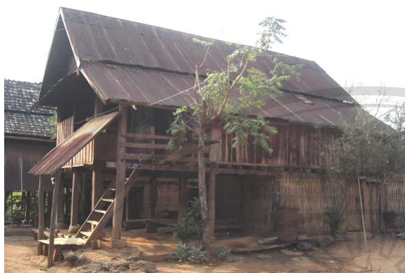
รูปที่ 5.10 เรือนที่ศึกษาหลังที่ 16 ปลูกในปี ค.ศ.1958 240 จะเป็นที่บูชาเทวดาเรือนหรือเป็นที่บูชาบรรพบุรุษก็ได้