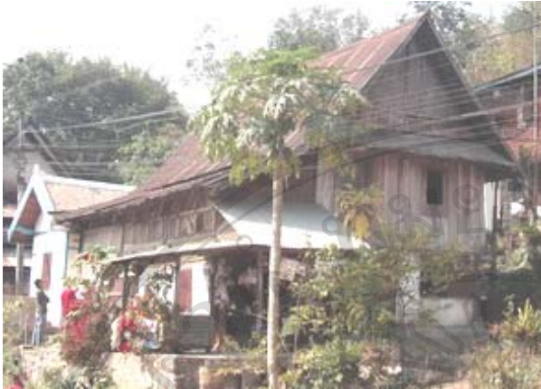
รูปที่ 5.14 เรือนที่ศึกษาหลังที่ 20 ปลูกในปี ค.ศ. 1976 เป็นการแสดงให้เห็นถึงเรือนแฝดลาวลุ่มที่มีรูปแบบดั้งเดิมแต่ได้รับอิทธิพลจากการนำมาของรูปแบบเรือนของฝรั่งเศส ดังนั้นเรือนจึงได้มีการต่อเติมให้ดูให้สามารถเป็นที่นอนหรือให้เป็นที่รับรองแขกคนที่มาเยือนซึ่งคิดกับเมื่อก่อนที่ใช้ได้ดูเป็นที่ทำกิจกรรมของครอบครัวเวลาว่างจากการทำสวนทำไร่ 254