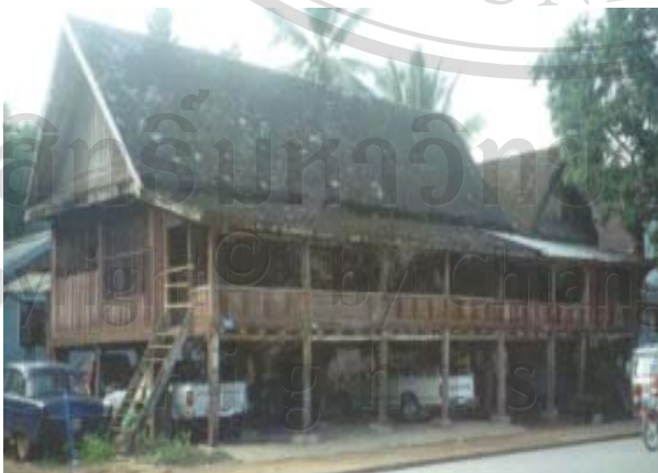
รูปที่ 2.5 เป็นเรือนหลังที่ 3 ปลูกในปี ค.ศ. 1946 เป็นรูปที่แสดงให้เห็นถึงรูปแบบของเรือนลาวลุ่มแบบดั้งเดิมที่ปลูกด้วยไม้ทั้งหลังเนื่องจากว่าในการปลูกเรือนในตอนนั้นได้นำเอาคติความเชื่อของการปลูกเรือนเข้ามาใช้ 34