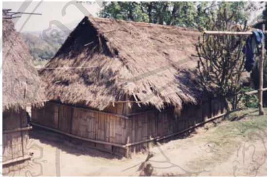
รูปที่ 2.3 เป็นเรือนลาวสูงที่ใช้เป็นที่อยู่อาศัย 18

ลาวสูงเป็นเชื้อสายที่มีการดำรงชีวิตอยู่บนคอยไถ่ค้ำน้ำใน ความสูง 1000 เมตร มีวัฒนธรรมเป็นของตนเองเช่น การแต่งกาย ภาษาและมีคติความเชื่อเกี่ยวกับผี การดำรงชีพตามเนินเขาปลูกข้าว ข้าวโพด โดยการดำรงชีพแบบเคลื่อนที่อันเนื่องมาจากการทำไร่ ดังนั้นการปลูกเรือนจึงเป็นการปลูกแบบไม่ถาวรที่เป็นเรือนปลูกติดกับดินที่ปลูกด้วยไม้ไผ่เหมือนกับเรือนของลาวเทิง (ดูรูปที่ 2.3)