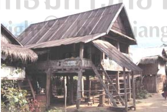
รูปที่ 2.7 เรือนที่ศึกษาหลังที่ 15 ปลูกในปีค.ศ.1960 เป็นรูป ที่แสดงให้เห็นถึงรูปแบบของเรือนลาวลุ่มแบบดั้งเดิมที่ปลูก ด้วยไม้ทั้งหลัง 36

ดังที่ได้กล่าวแล้วถึงที่มาและลักษณะ โดยทั่วไปของเรือน ทั้งที่เป็นแบบดั้งเดิมและที่ได้มีการพัฒนาการเปลี่ยนแปลง ซึ่งเรือนที่เป็นแบบดั้งเดิมแทบจะหาไม่ได้ในท้องถิ่นอีกแล้ว โดยสภาพของเรือนจะแตกต่างออกไปตามวัสดุและรูปแบบตามช่วงเวลา ที่มีการก่อสร้างหรือต่อเติม เรือนในช่วงแรก คือเรือนแบบดั้งเดิมและเรือนที่มีพัฒนาการมาจากเรือนดั้งเดิม มีลักษณะและสภาพโดยทั่วไปของเรือนและองค์ประกอบที่มีความคล้ายคลึงกันเป็นอย่างมาก เริ่มจากตัวเรือนสภาพแวดล้อม เรือนมีได้สูงทั้งหมด โครงสร้างเป็นไม้จริง ไม้ไผ่เหมือนกันหรือฝาเป็นไม้จริงหรือไม้ไผ่ที่เรียกว่าฝาขัดแตะ ซึ่งเป็นที่น่าสังเกตว่าล้วนแต่เป็นวัสดุที่หาได้จากธรรมชาติในท้องถิ่นทั้งสิ้น (ดูรูปที่ 2.7) ผสมผสานกับภูมิปัญญาท้องถิ่นที่มีความรู้ความเข้าใจในธรรมชาติ เน้นการพึ่งพาธรรมชาติ ไม่ปรุงแต่งให้เกินเลยไปจากประโยชน์ใช้สอยตามการอยู่อาศัยที่จำเป็นต่อการดำรงชีวิต ไม่ได้เริ่มต้นจากเรือนที่มีความสวยงาม หรือความต้องการของผู้อยู่อาศัยในเรือน ผิดกับเรือนปัจจุบัน หรือบ้านของสังคมเมือง ที่มีแนวคิดในการสร้างที่ตรงกันข้ามกับวัฒนธรรมและวิถีชีวิตของชาวชนบทโดยสิ้นเชิง การที่จะมีเรือนต้องเริ่มจากความมีหน้ามีตา เรือนจะต้องมีความสวยงาม ประชันกัน ได้สร้างจากวัสดุใหม่ๆ ไม่ใช่ของท้องถิ่นยึดถือเอาความทันสมัยและค่านิยมทางการบริโภคเป็นเกณฑ์ในการสร้างบ้านปลูกเรือน (ดูรูปที่ 2.8)