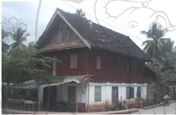
รูปที่ 2.4 เป็นรูปเรือนของผู้ที่เป็นขุนนางใหญ่เท่านั้นที่จะเลียนแบบเรือนที่ปลูกในช่วงที่ฝรั่งเศสปกครอง แต่ก็ยังนำวัสดุที่ผสมผสานระหว่างก่ออิฐฉาบปูนกับไม้ 33

ปี ค.ศ. 1950 อาคารที่ชาวหลวงพระบางเรียกว่า อาคารสมัยใหม่ได้ปรากฏขึ้น เป็นอาคารที่มีขนาดใหญ่ มีโครงสร้างทำด้วยคอนกรีตเสริมเหล็ก การก่อสร้างด้วยเทคนิค และวัสดุสมัยใหม่ที่นำเข้ามาจากต่างประเทศ โดยส่วนใหญ่ได้มาจากประเทศไทย (ดูรูปที่ 2.4) เห็นได้อย่างชัดเจนในเรือนไม้ที่สร้างขึ้นในยุคนี้จนถึงศตวรรษที่ 20 การสร้างอาคารรูปแบบใหม่ที่ได้รับอิทธิพลจากต่างประเทศ ทำให้สถาปัตยกรรมอาคารพักที่อาศัยในหลวงพระบางมีสองแบบคือ อาคารเรือนแบบดั้งเดิม (ดูรูปที่ 2.5) และอาคารที่ได้รับอิทธิพลจากต่างประเทศ (ดูรูปที่ 2.6) เมืองหลวงพระบางได้มีสถาปัตยกรรมเรือนอยู่อาศัยรวมกันไว้อย่างหลากหลาย นอกจากเรือนลาวลุ่มที่กล่าวมา ยังมีเรือนพื้นถิ่นของชนกลุ่มน้อยจำนวนมากที่ยังคงสภาพดั้งเดิมแต่มีจำนวนลดลงไปทุกปี