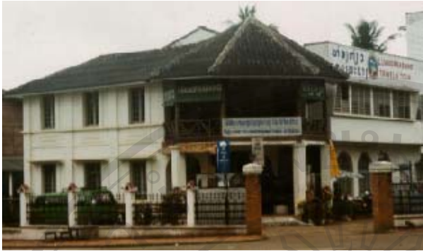
รูปที่ 2.8 เรือนสมัยใหม่ได้ปรากฏขึ้น เป็นอาคารที่มีขนาดใหญ่ มีโครงสร้างทำด้วยคอนกรีตเสริมเหล็ก การก่อสร้างทำด้วยเทคนิคและวัสดุสมัยใหม่ที่นำเข้ามาจากต่างประเทศ โดยเฉพาะประเทศไทย และรูปแบบก็ได้รับอิทธิพลจากต่างประเทศ 37