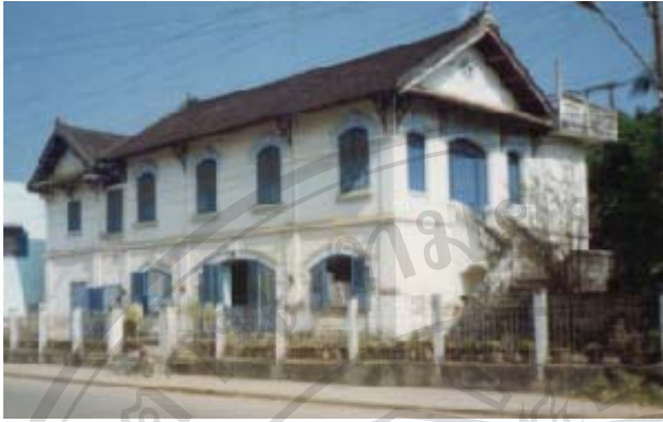
รูปที่ 2.6 เป็นรูปเรือนที่สร้างเพื่อคนฝรั่งเสสรสร้างด้วยวัสดุที่ทันสมัย เช่น อิฐ ดินขอ ปูน แต่ยังใช้รูปแบบเดิม 35

ดังที่ได้กล่าวแล้วถึงที่มาและลักษณะ โดยทั่วไปของเรือน ทั้งที่เป็นแบบดั้งเดิมและที่ได้มีการพัฒนาการเปลี่ยนแปลง ซึ่งเรือนที่เป็นแบบดั้งเดิมแทบจะหาไม่ได้ในท้องถิ่นอีกแล้ว โดยสภาพของเรือนจะแตกต่างออกไปตามวัสดุและรูปแบบตามช่วงเวลา ที่มีการก่อสร้างหรือต่อเติม เรือนในช่วงแรก คือเรือนแบบดั้งเดิมและเรือนที่มีพัฒนาการมาจากเรือนดั้งเดิม มีลักษณะและสภาพโดยทั่วไปของเรือนและองค์ประกอบที่มีความคล้ายคลึงกันเป็นอย่างมาก เริ่มจากตัวเรือนสภาพแวดล้อม เรือนมีได้สูงทั้งหมด โครงสร้างเป็นไม้จริง ไม้ไผ่เหมือนกันหรือฝาเป็นไม้จริงหรือไม้ไผ่ที่เรียกว่าฝาขัดแตะ ซึ่งเป็นที่น่าสังเกตว่าล้วนแต่เป็นวัสดุที่หาได้จากธรรมชาติในท้องถิ่นทั้งสิ้น (ดูรูปที่ 2.7) ผสมผสานกับภูมิปัญญาท้องถิ่นที่มีความรู้ความเข้าใจในธรรมชาติ เน้นการพึ่งพาธรรมชาติ ไม่ปรุงแต่งให้เกินเลยไปจากประโยชน์ใช้สอยตามการอยู่อาศัยที่จำเป็นต่อการดำรงชีวิต ไม่ได้เริ่มต้นจากเรือนที่มีความสวยงาม หรือความต้องการของผู้อยู่อาศัยในเรือน ผิดกับเรือนปัจจุบัน หรือบ้านของสังคมเมือง ที่มีแนวคิดในการสร้างที่ตรงกันข้ามกับวัฒนธรรมและวิถีชีวิตของชาวชนบทโดยสิ้นเชิง การที่จะมีเรือนต้องเริ่มจากความมีหน้ามีตา เรือนจะต้องมีความสวยงาม ประชันกัน ได้สร้างจากวัสดุใหม่ๆ ไม่ใช่ของท้องถิ่นยึดถือเอาความทันสมัยและค่านิยมทางการบริโภคเป็นเกณฑ์ในการสร้างบ้านปลูกเรือน (ดูรูปที่ 2.8)