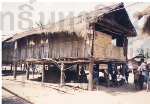
รูปที่ 2.2 เป็นเรือนลาวเทิงที่ใช้เป็นที่อยู่อาศัย 17

ลาวเทิงเป็นเชื้อสายเดียวกับมอญ ที่มีการดำรงชีวิตอยู่บนคอกไม้ไผ่ตั้งในที่สูง 300-900 เมตร มีวัฒนธรรมเป็นของตนเองเช่น การแต่งกาย ภาษาและมีคติความเชื่อเกี่ยวกับผี การดำรงชีพตามเนินเขาปลูกข้าว ข้าวโพด กาแฟ ปลูกยา และปลูกฝ้าย โดยการดำรงชีพแบบไม่เป็นหลักแหล่งแน่นอนอันเนื่องมาจากการทำไร่ ดังนั้นการปลูกเรือนจึงเป็นการปลูกแบบไม่ถาวร เช่น เรือนที่ปลูกด้วยไม้ไผ่ (ดูรูปที่ 2.2)