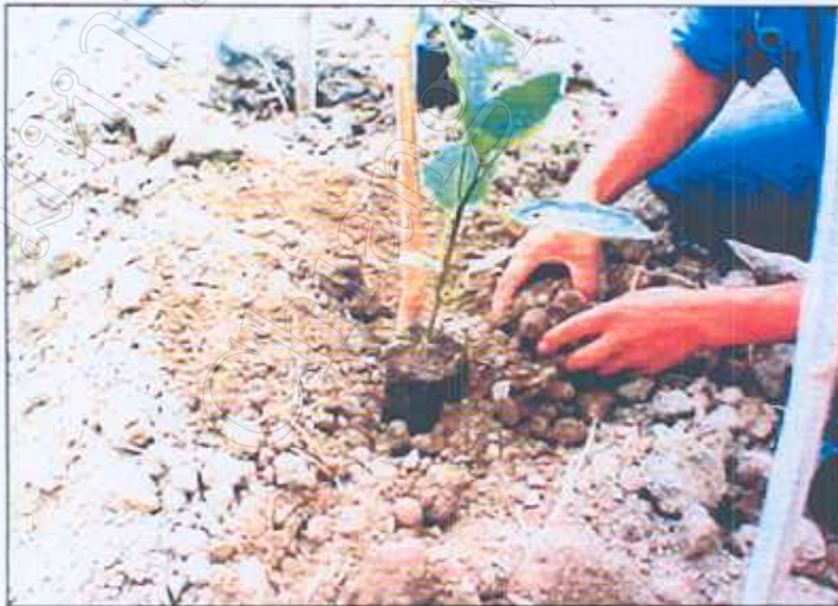
ภาพที่ 2 : ต้นกล้าอายุประมาณ 50 วัน ข้ายดงแปลงปลูก