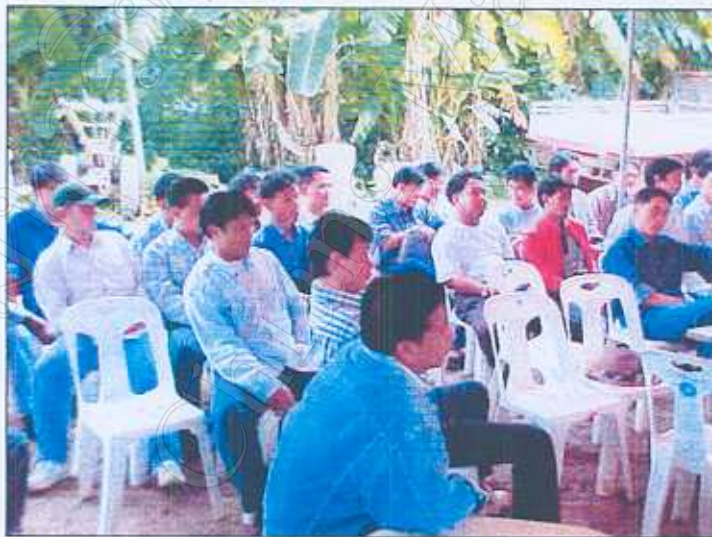
ภาพที่ 6 : การประชุมกลุ่มเกษตรกร