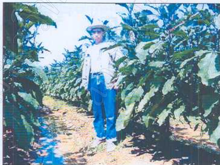
ภาพที่ 4 : สภาพต้นมะเขือม่วงญี่ปุ่น ที่เก็บผลผลิตมาแล้วประมาณ 2.5 เดือน พักติระยะเวลาการเก็บผลผลิต 4.5 เดือน