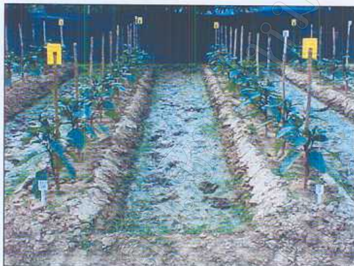
ภาพที่ 3 : ต้นมะเขือหลังย้ายลงแปลงปลูกประมาณ 20 วัน ขนาดแปลงปลูกกว้าง 1 เมตร ร่อง 1 เมตร