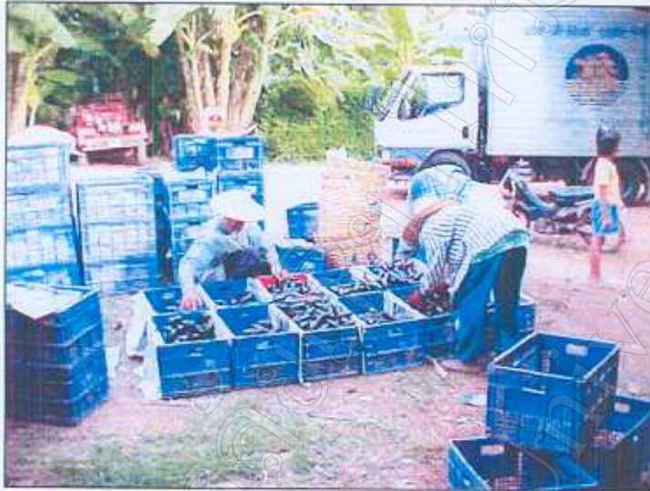
ภาพที่ 5 : จุดรับซื้อวัตถุดิบ และการขนส่ง