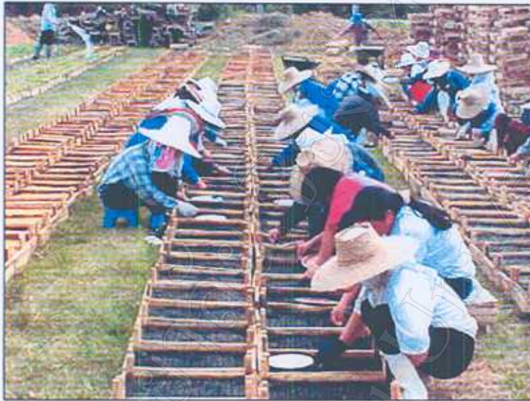
ภาพที่ 1 : การเพาะเมล็ดพันธุ์ มะเขือม่วงญี่ปุ่น ทำการเพาะที่บริษัทฯ