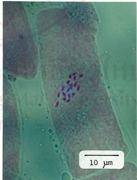
ภาพที่ 2 แสดงจำนวนโครโมโซมของ ผักกาดหัว 2n=18