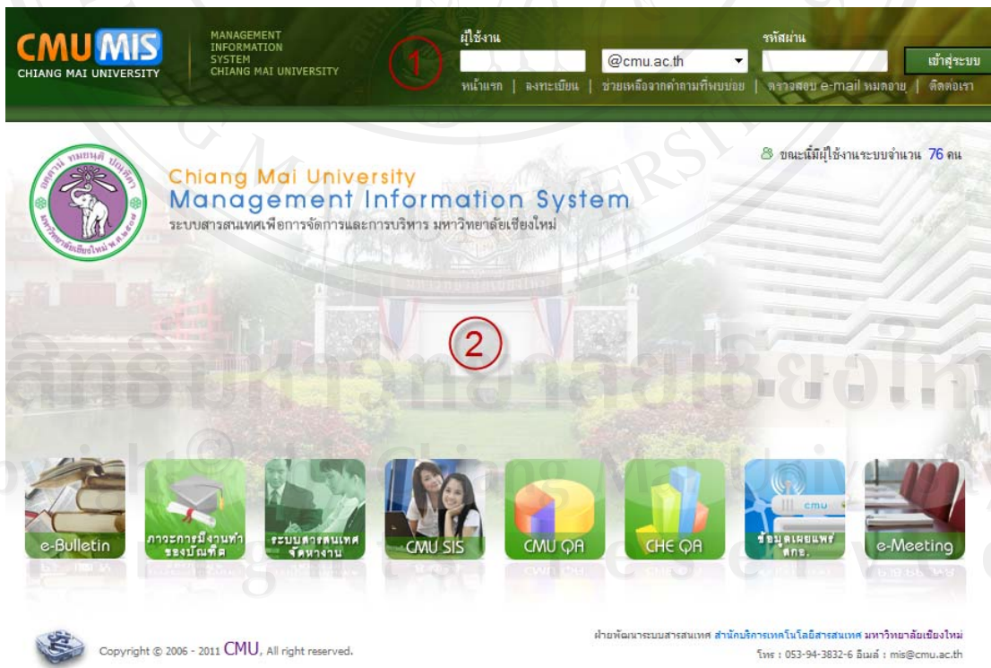
รูป 5.1 แสดงจอภาพเริ่มต้นการใช้งาน

จอภาพเริ่มต้นการใช้งานระบบ ซึ่งจะ เป็น หน้าแรกในการเข้าใช้งานระบบจัดการยานพาหนะของมหาวิทยาลัยเชียงใหม่ แสดงดังรูป 5.1