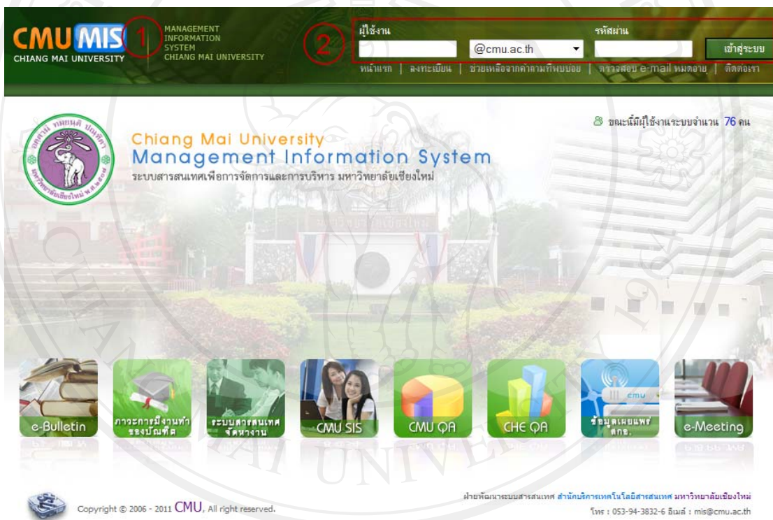
รูป 5.2 แสดงจอภาพส่วนการล็อกอินเข้าสู่ระบบ

จอภาพส่วนการล็อกอินเข้าสู่ระบบเป็นหน้าจอสำหรับตรวจสอบการเข้าใช้งานระบบของผู้ใช้งาน แสดงดังรูป 5.2