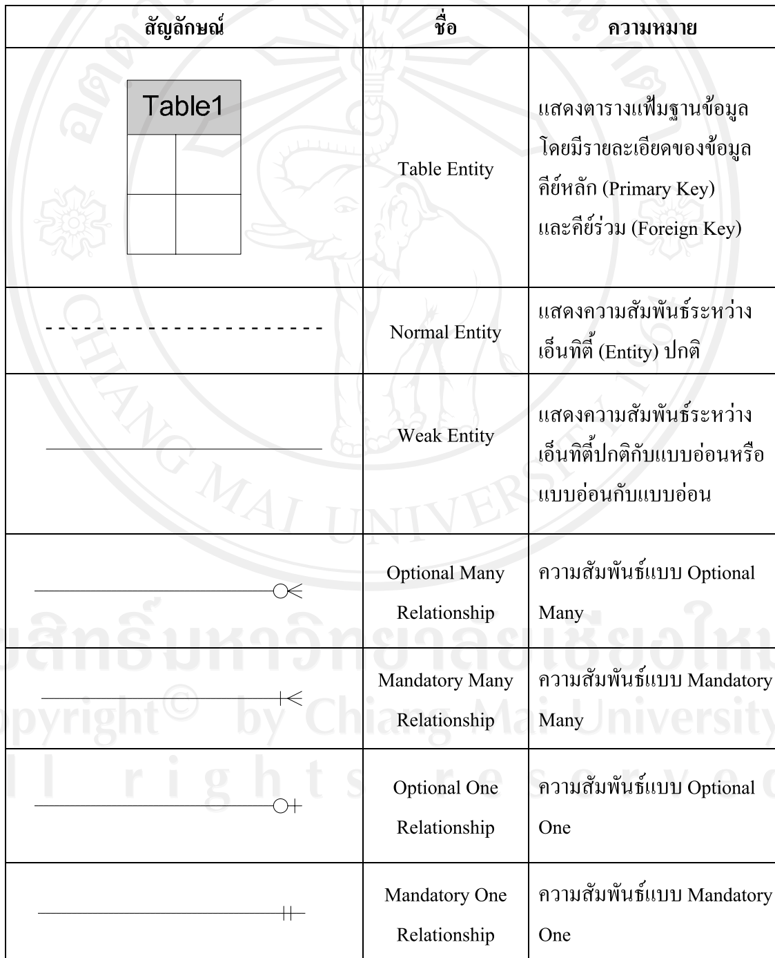
ตาราง 4.36 แสดงสัญลักษณ์ที่ใช้ในการออกแบบความสัมพันธ์ของตาราง

จากการวิเคราะห์ความสัมพันธ์ของข้อมูลในระบบพบว่า มีข้อมูลหลายตารางเกี่ยวข้องกัน โดยแสดงในรูปแบบของความสัมพันธ์ของตาราง (Table Relationship) แสดงดังรูป 4.1 โดยใช้สัญลักษณ์ในการออกแบบ แสดงดังตาราง 4.36 ดังนี้