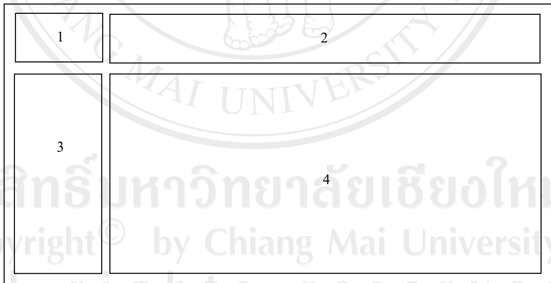
รูป 5.1 แสดงการออกแบบหน้าจอหลัก

การออกแบบหน้าจอหลัก มีวัตถุประสงค์เพื่อเป็นจอภาพเริ่มต้นของการเข้าสู่ระบบสารสนเทศอิเล็กทรอนิกส์สำหรับฝ่ายสำนักงาน มูลนิธิธรรมาทร ดังรูป 5.1