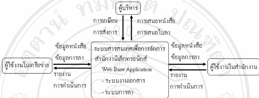
รูป 3.3 แสดงระบบจัดการระบบสำนักงานอิเล็กทรอนิกส์ในระบบงานใหม่

จากรูป 3.3 แสดงระบบสารสนเทศเพื่อจัดการสำนักงานอิเล็กทรอนิกส์ในระบบงานใหม่ เป็นการนำระบบที่เป็นเอกสารต่าง ๆ และระบบการลาของเจ้าหน้าที่สาธารณสุข สังกัดสำนักงานสาธารณสุขอำเภอเวียงสา เข้าสู่ระบบฐานข้อมูลอิเล็กทรอนิกส์ทั้งหมดโดยใช้เทคโนโลยีเว็บแอปพลิเคชัน (Web Application) และเว็บเบส (Web Base) มาใช้ ทำให้สามารถดำเนินงาน ติดตามควบคุม กำกับ และประเมินผล ตลอดจนระบบรายงาน ได้อย่างสะดวก รวดเร็วและมีประสิทธิภาพยิ่งขึ้น