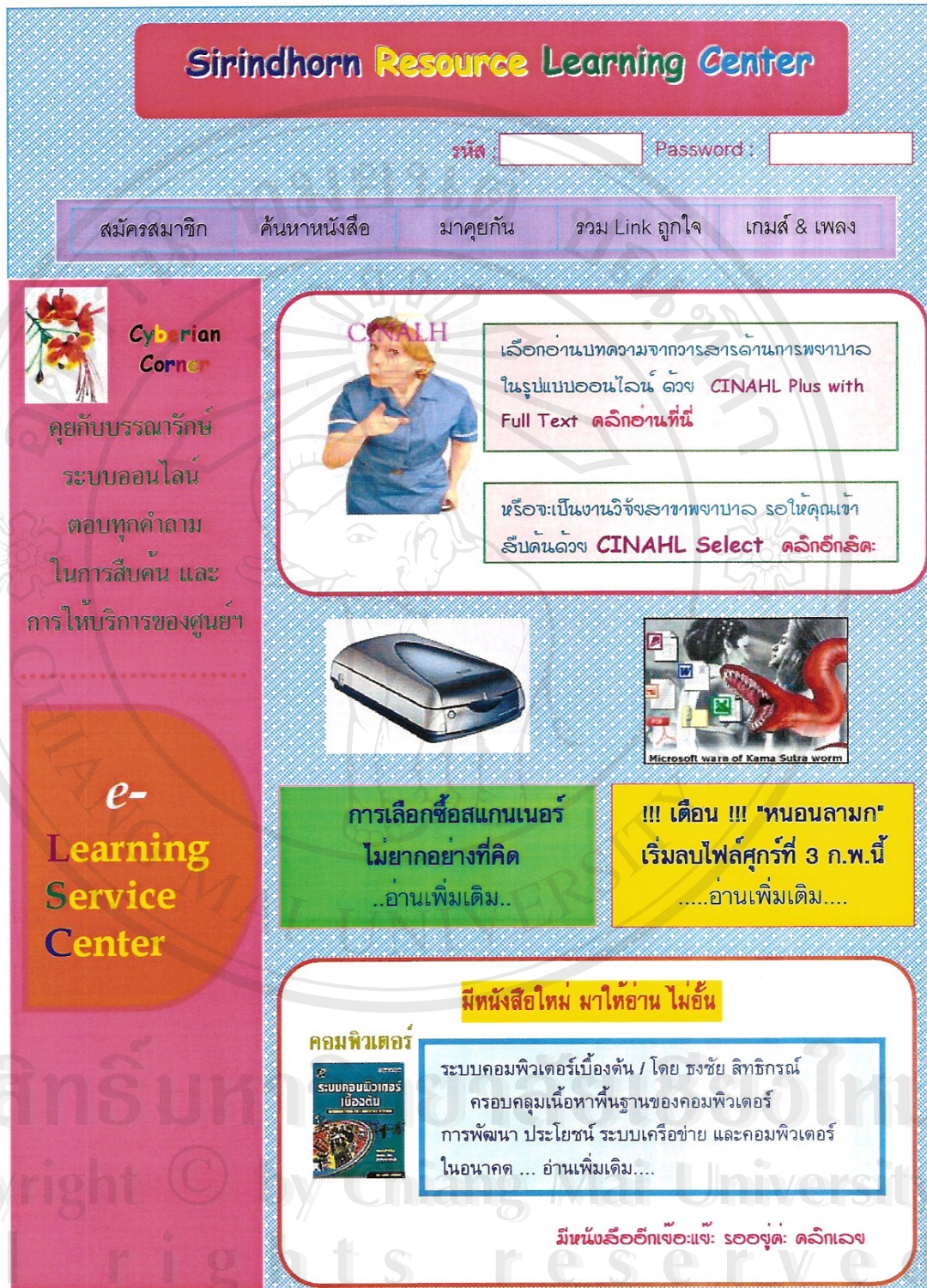
รูป 5.2 ตัวอย่างรูปแบบการนำเสนอข้อมูลบนเว็บไซต์