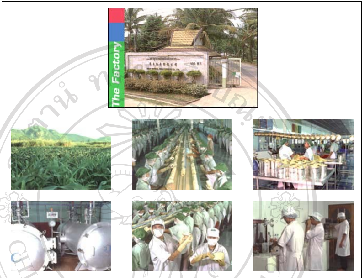
ภาพแสดงที่ตั้งบริษัทและภายในโรงผลิต