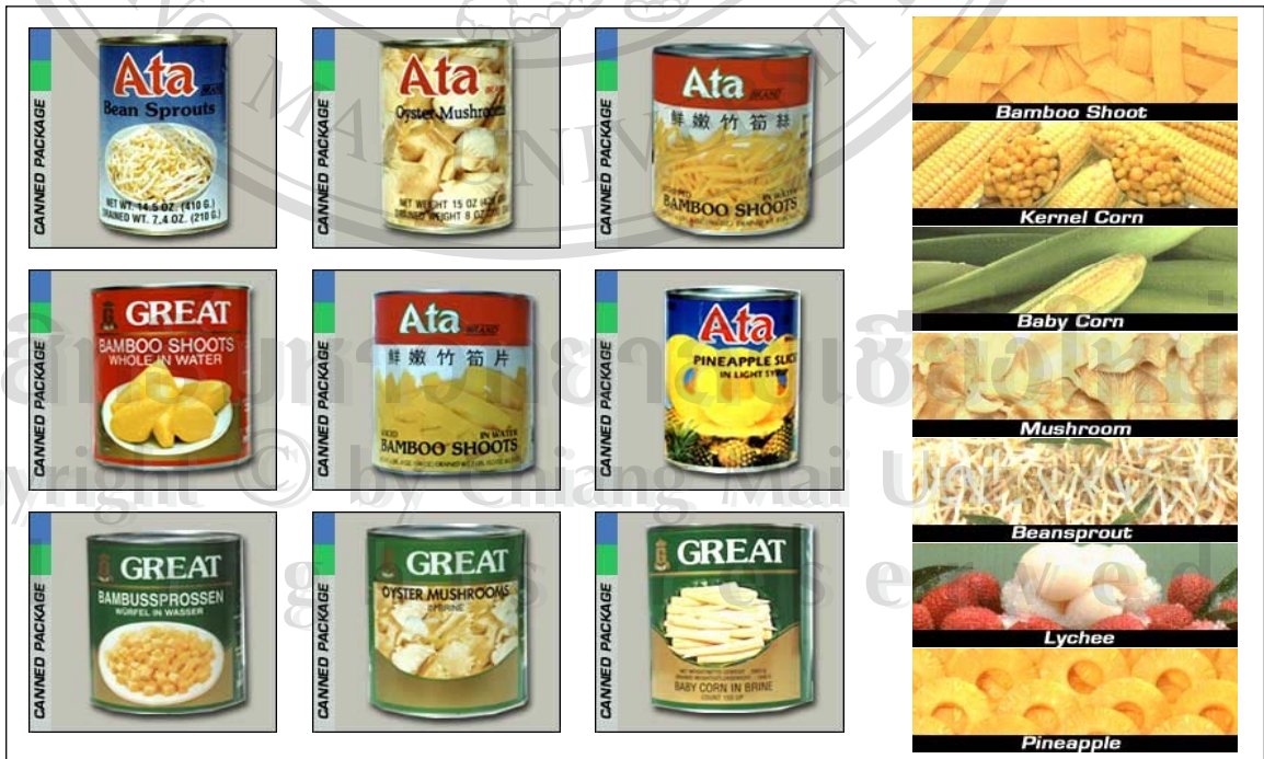
ภาพแสดงผลิตภัณฑ์ของบริษัท มหาบูรพาผลิตภัณ์อาหาร จำกัด