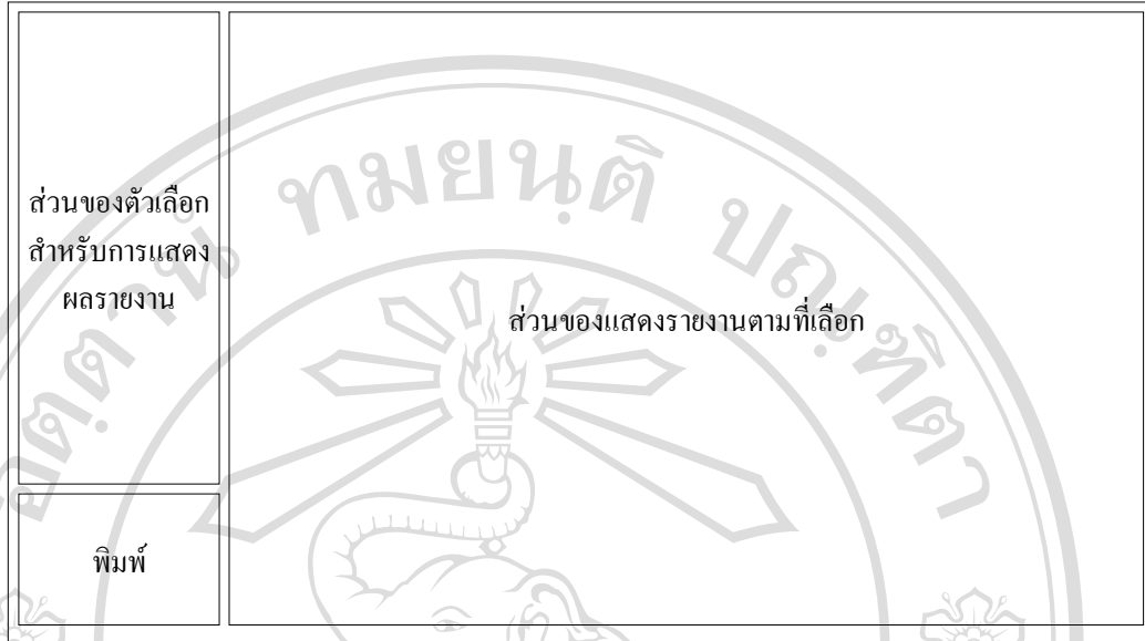
รูป 4.7 แสดงหน้าจอสำหรับการแสดงผลรายงาน โดยมีรายละเอียดของรายงานที่แสดงดังต่อไปนี้