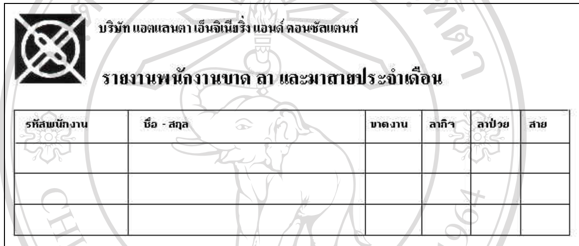
รูปที่ 4.32 แสดงการออกแบบหน้าจอรายงานพนักงานขาด ลา และมาสายประจำเดือน

11) รายงานการจ่ายเงินค่าแรงประจำเดือน : แสดงการจ่ายเงินค่าแรงประจำเดือนของผู้ปฏิบัติงานภายในโครงการ