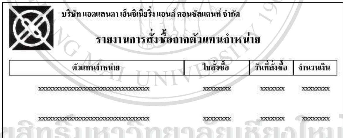
รูปที่ 4.30 แสดงการออกแบบหน้าจอรายงานการสั่งซื้อจากตัวแทนจำหน่าย

9) รายงานการสั่งซื้อจากตัวแทนจำหน่าย : สำหรับแสดงการสั่งซื้อจากตัวแทนจำหน่าย