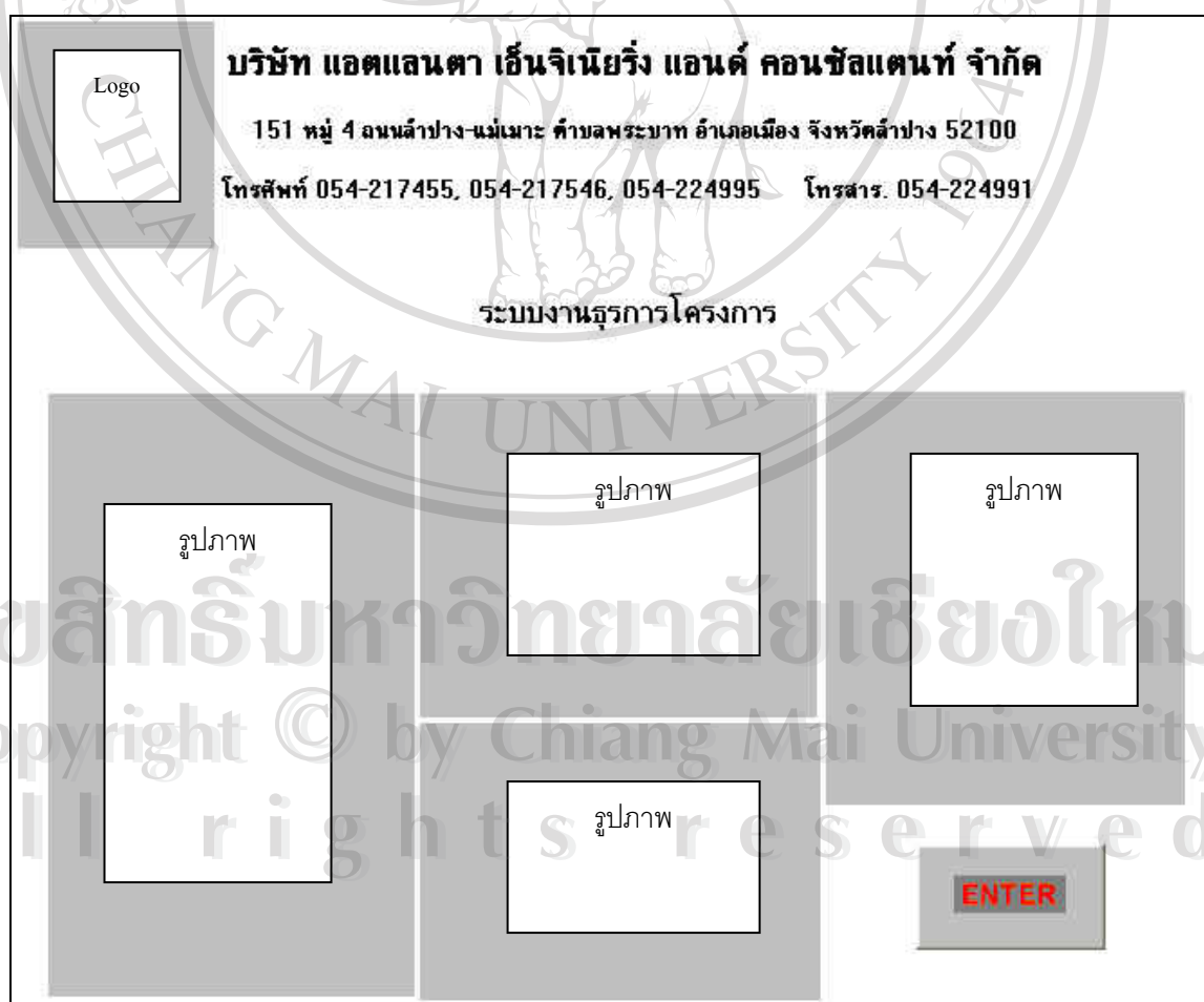
รูปที่ 4.1 แสดงการออกแบบหน้าจอแรกของระบบ

1) จอภาพหลัก : เป็นหน้าหลักของการเข้าระบบ เพื่อนำไปสู่การใช้งานในหน้าต่อไป