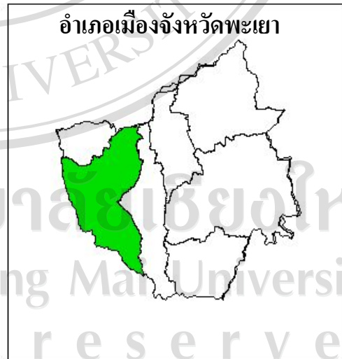
แผนที่ 1 พื้นที่ศึกษา