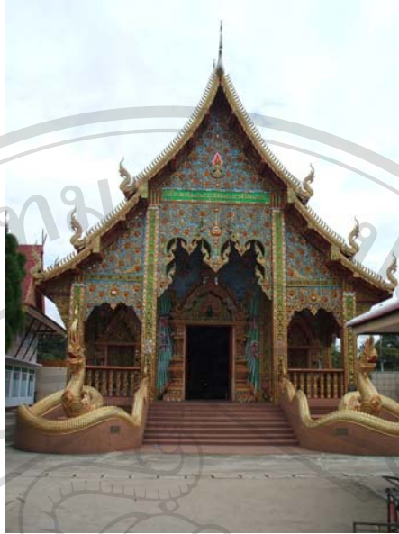
ภาพที่ 7 วัดในหมู่บ้าน