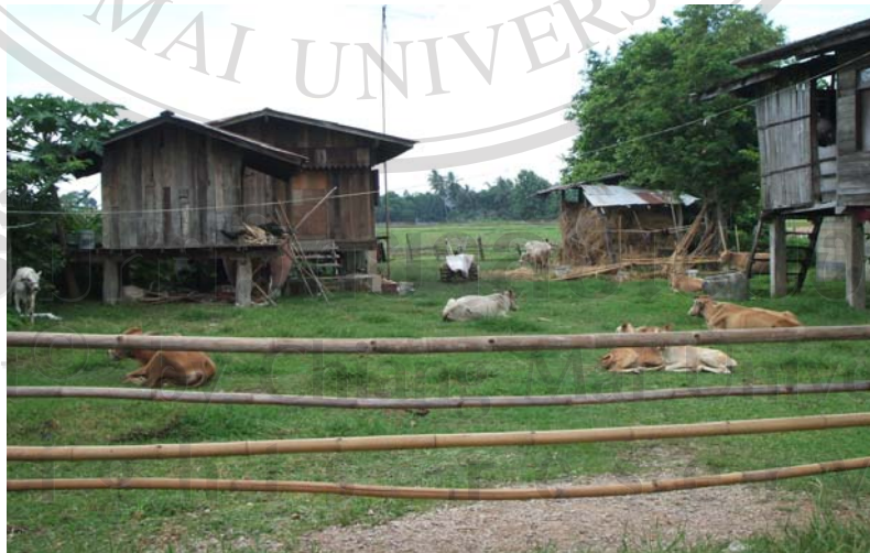
ภาพที่ 8 การเลี้ยงสัตว์

กลุ่มเลี้ยงวัว เป็นกิจกรรมส่งเสริมอาชีพของเกษตรกรผู้เลี้ยงวัวในพื้นที่ทำให้เกษตรกรมีอาชีพเสริม เพิ่มรายได้ให้ครอบครัวมีการรวมกลุ่มและมีการออมเพื่อช่วยเหลือในด้านสวัสดิการแก่สมาชิกของกลุ่ม โดยได้รับการสนับสนุนงบประมาณจาก อบต.บ้านต้อม