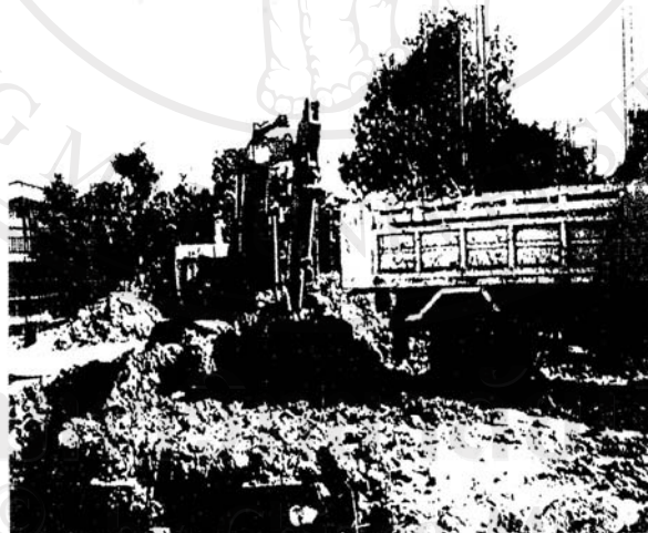
ภาพที่ 4 การขนย้ายทำให้เกิดฝุ่นละออง

ลิขสิทธิ์ © 2564 โดย Chiang Mai University All rights reserved