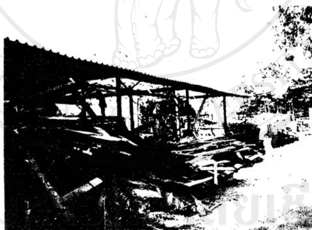
ภาพที่ 2 มลภาวะจากการรื้อถอน