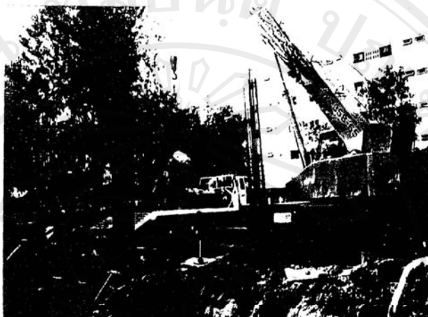
ภาพที่ 1 เครื่องจักรจุดดินทำให้เกิดมลภาวะทางเสียงและมลภาวะทางอากาศ