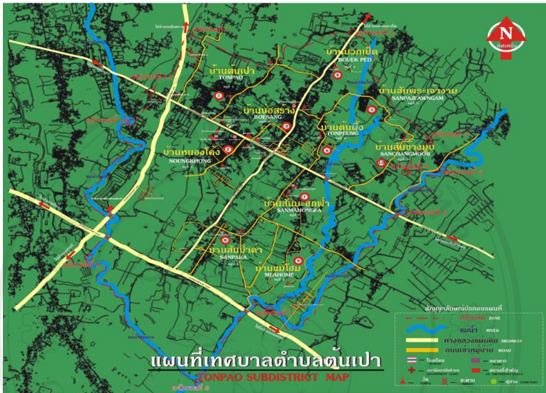
ภาพ 1 แผนที่เทศบาลตำบลต้นเปา