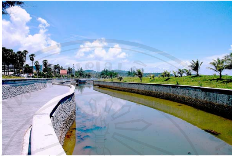
ภาพ 4.7 มีการอนุรักษ์คลองน้ำและสันเขื่อนธรรมชาติ เพื่อป้องกันภัยธรรมชาติ เช่น เมื่อครั้งที่ประสบภัยพิบัติคลื่นยักษ์สึนามิ วันที่ 26 ธันวาคม พ.ศ. 2546 ก่อนที่คลื่นยักษ์จะพัดพากระแสน้ำเข้าสู่ชุมชนกระรอน คลองบางลาและสันเขื่อนธรรมชาติทำหน้าที่กั้นและเก็บกักน้ำได้ในระดับหนึ่ง จึงสามารถลดระดับความรุนแรงของกระแสน้ำ ทำให้ชุมชนกระรอนได้รับความเสียหายจากภัยพิบัติครั้งนี้ไม่มาก