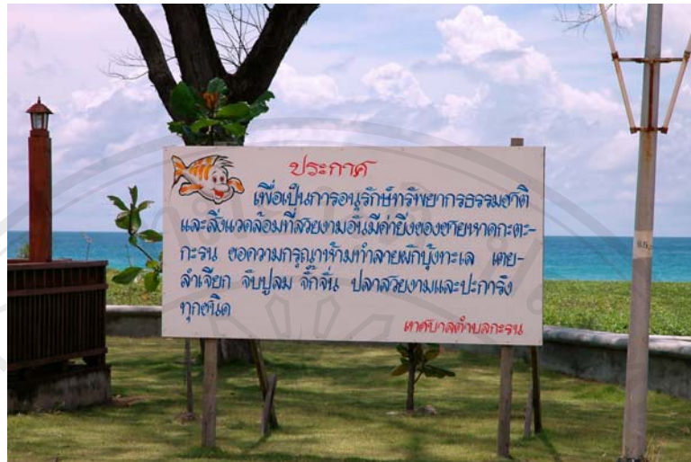
ภาพ 4.4 มีการติดป้ายประกาศเพื่อขอความร่วมมือ