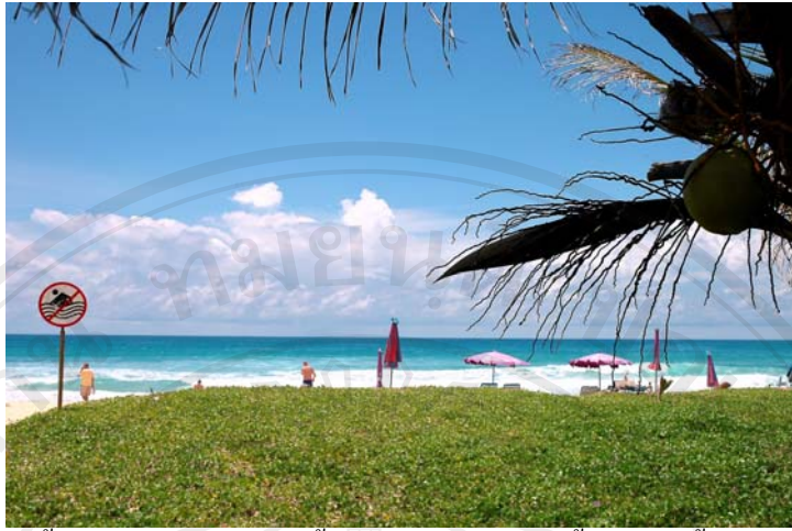
ภาพ 4.9 ป้ายเตือนพื้นที่สีแดงห้ามลงเล่นน้ำเนื่องจากมีคลื่นใต้น้ำบริเวณนี้