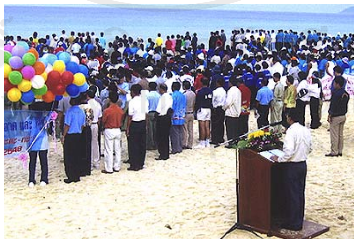
ภาพ 4.16 การให้ความร่วมมือในการเข้าร่วมกิจกรรมหรือโครงการของกลุ่มไตรภาคี