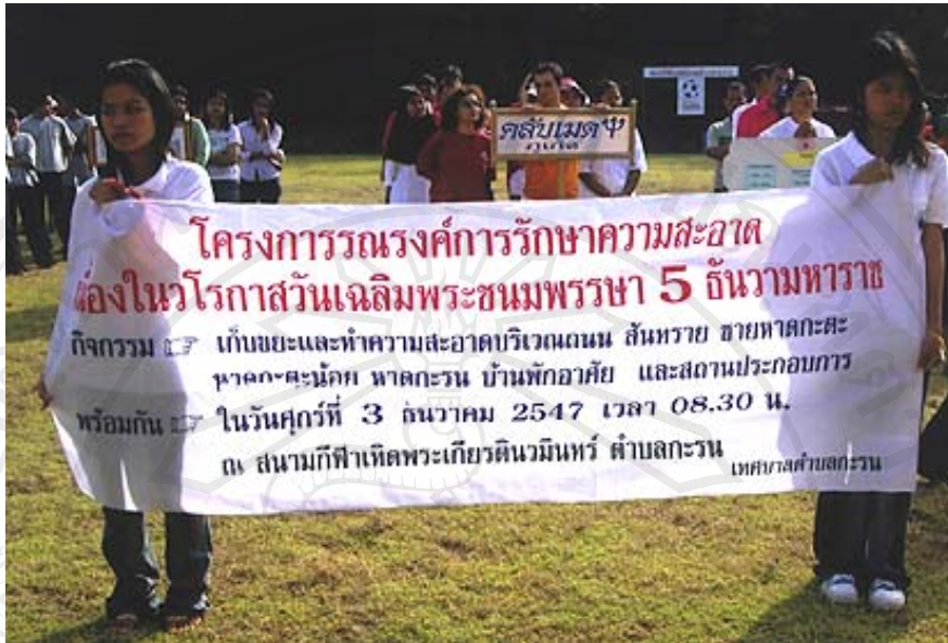
ภาพ 4.12 โครงการรณรงค์การรักษาความสะอาด เนื่องในวโรกาสวันเฉลิมพระชนมพรรษา 5 ธันวาคมหาราช