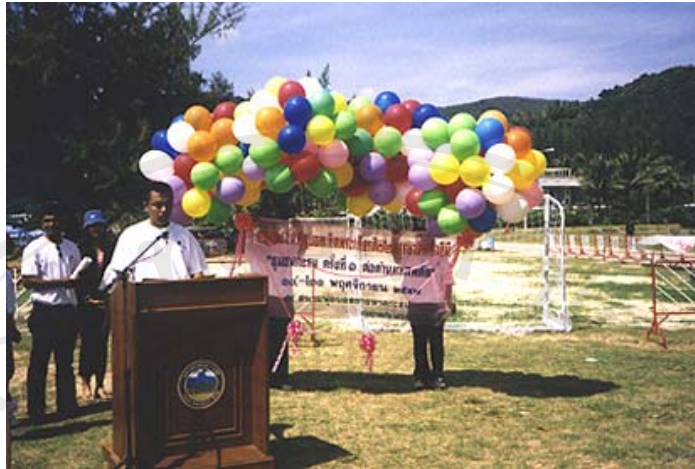
ภาพ 4.17 โครงการต่อต้านยาเสพติดเกิดพระเกียรติสมเด็จพระนางเจ้าฯ 19-20 พฤศจิกายน 2547