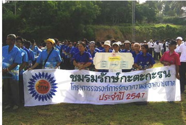
ภาพ 4.14 โครงการรณรงค์รักษาความสะอาดบริเวณชายหาดประจำปี 2547