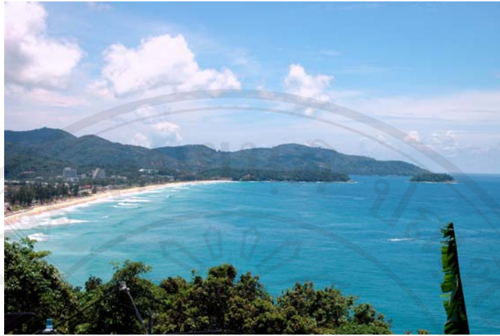
ภาพ 4.1 ชุมชนกะรน