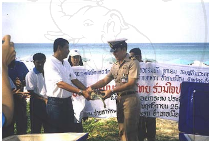
ภาพ 4.18 โครงการอนุรักษ์พันธุ์เต่าทะเลไทยของเทศบาลตำบลกระนวน ร่วมกับกองทัพเรือภาค 3 ฃชายหาดกระนวน เมื่อพฤศจิกายน 2548