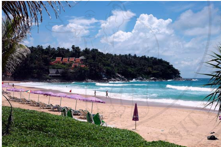
ภาพ 4.2 ชายหาดกะรน