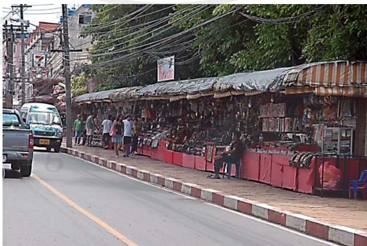
ภาพ 4.11 การจัดระเบียบแผงลอย