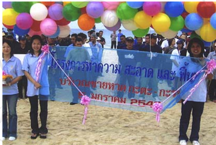
ภาพ 4.15 โครงการทำความสะอาดและฟื้นฟูชายหาดกะตะ-กะรน เมื่อวันที่ 5 มกราคม พ.ศ. 2548