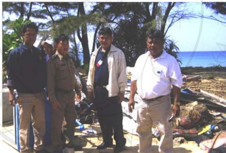
ภาพ 4.21 การลงพื้นที่และทำงานร่วมกันของกลุ่มไตรภาคี หลังเกิดเหตุภัยพิบัติคลื่นยักษ์สึนามิ

4.2.7 ปัญหาและอุปสรรคในการพัฒนาชุมชนกะเหรี่ยงของกลุ่มไตรภาคี สํารวจพบปัญหาและอุปสรรคทั้งหมด 5 ส่วนดังนี้