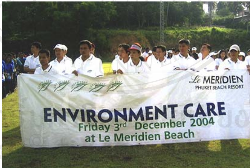
ภาพ 4.13 โรงแรมเลอ เมอริเดียน ภูเก็ต บีช รีสอร์ท เข้าร่วมโครงการรณรงค์การรักษาความสะอาด เนื่องในวโรกาสวันเฉลิมพระชนมพรรษา 5 ธันวาคมหาราชด้วย