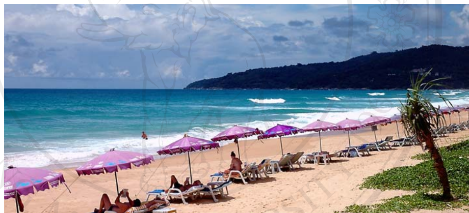
ภาพ 4.5 มีการจัดระเบียบระยะห่างแนวร่วมในการให้บริการแก่นักท่องเที่ยวเพื่อความเป็นระเบียบ