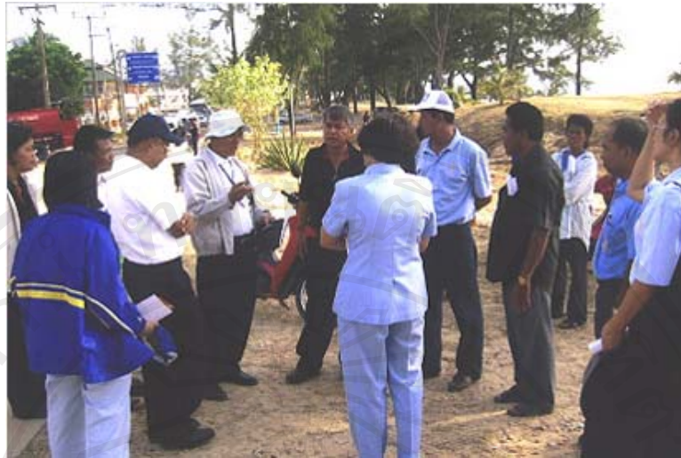
ภาพ 4.20 เจ้าหน้าที่ฝ่ายต่างๆ ลงสำรวจปัญหาและวางแผนงานร่วมกัน