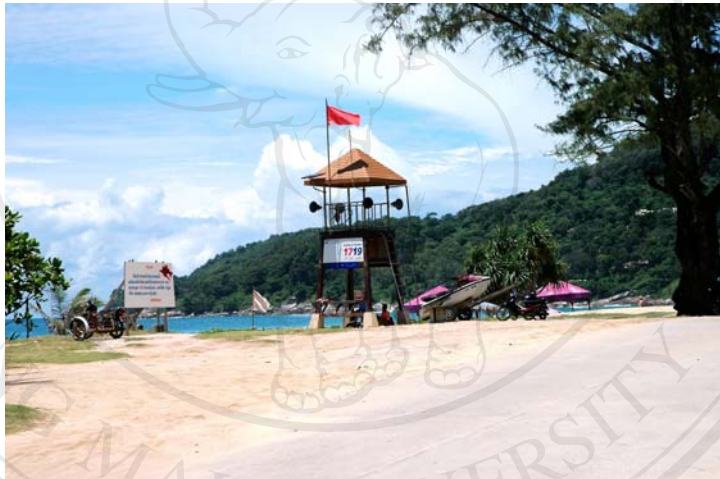
ภาพ 4.10 หน่วยรักษาความปลอดภัยบริเวณชายหาดกะรน