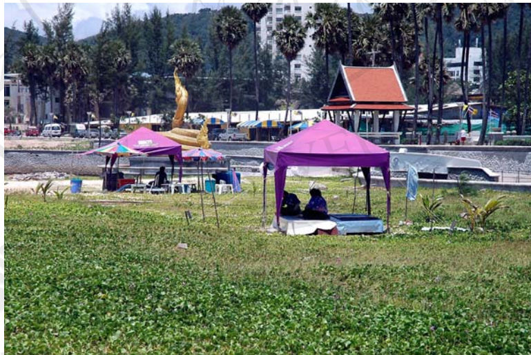
ภาพ 4.8 มีการกำหนดระยะเวลาห่างของจุดบริการนวดแผนโบราณ โดยใช้ความหนาแน่นของจำนวนนักท่องเที่ยวในพื้นที่เป็นเกณฑ์กำหนด เพื่อให้มีการบริการแก่นักท่องเที่ยวอย่างทั่วถึงและไม่ก่อให้เกิดการแย่งลูกค้ากัน