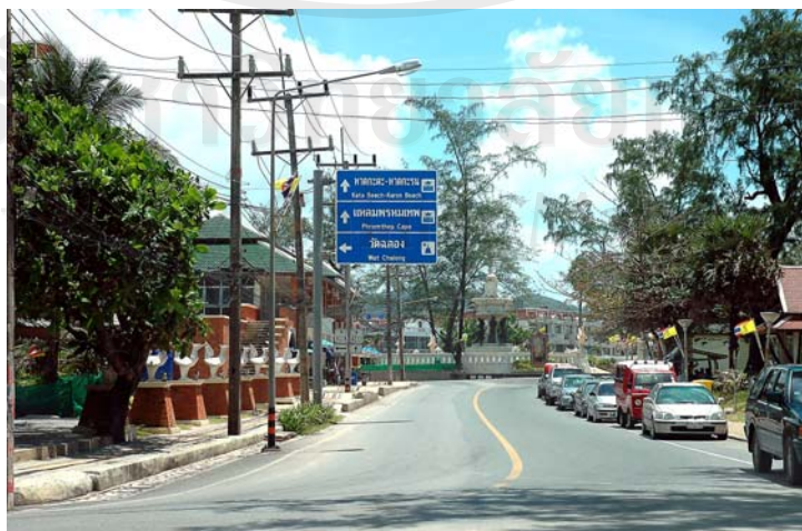
ภาพ 4.3 การจัดระเบียบถนนเลียบชายหาดและชุมชนกะรน