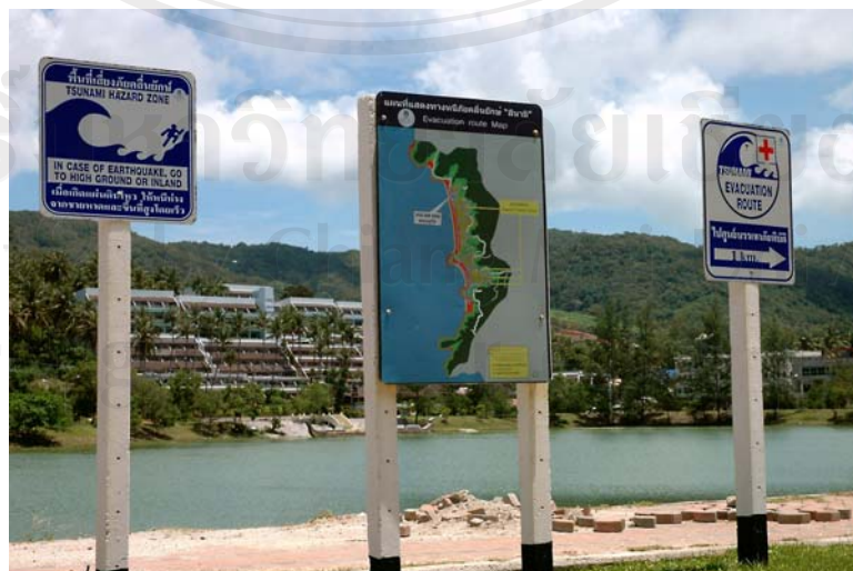
ภาพ 4.6 ป้ายแผนที่แสดงเส้นทางหนีคลื่นยักษ์สึนามิ