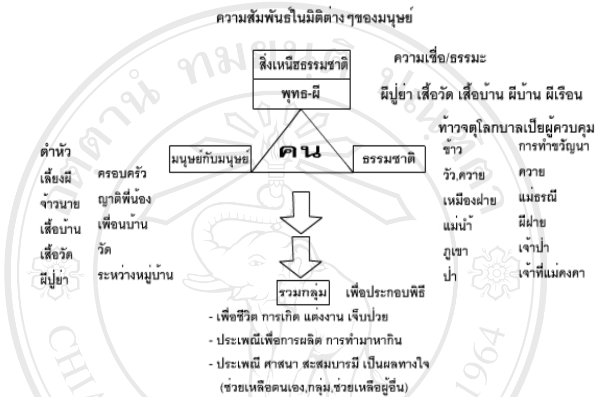
ภาพที่ 2.1 ภูมิปัญญาจากประเพณี