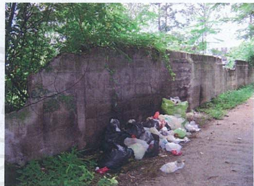
ภาพที่ 1 กองขยะบริเวณสามแยกกลางชุมชน