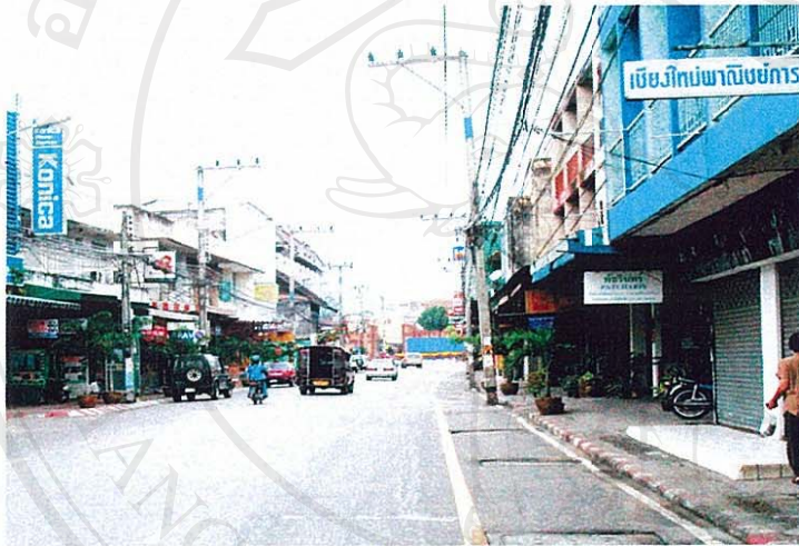
ภาพที่ 12 ตัวอย่างถนนท่าแพในปัจจุบัน