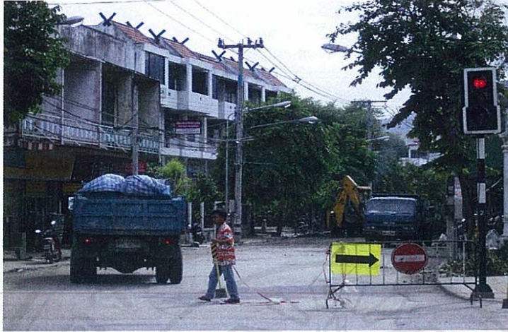
ภาพที่ 11 ตัวอย่างการปิดกั้นถนนเพื่อการพัฒนาบริเวณถนนราชดำเนินบริเวณสี่แยกกลางเวียง