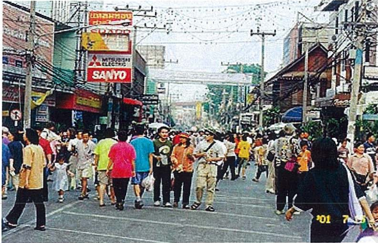
ภาพที่ 5 งานถนนคนเดินบนพื้นที่ถนนท่าแพ