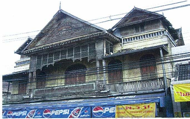
ภาพที่ 8 ภูมิทัศน์ด้านสาธารณูปโภคกับสิ่งปลูกสร้างโบราณ ร้านคิม บนถนนท่าแพ