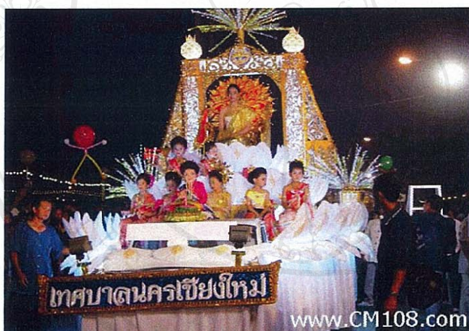
ภาพที่ 3 กิจกรรมขบวนแห่กระทงในงานลอยกระทงบนพื้นที่ถนนท่าแพ