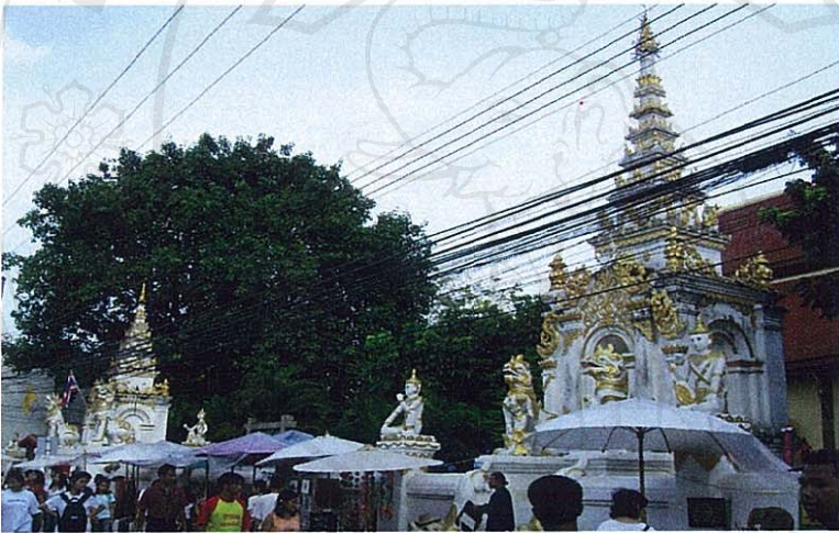
ภาพที่ 6 ภูมิทัศน์ระบบสาธารณูปโภคกับศาสนสถานวัดมหาวันบนพื้นที่ถนนท่าแพ