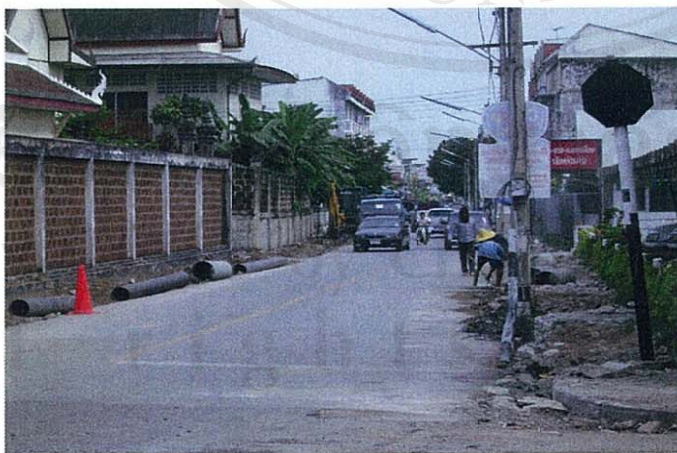
ภาพที่ 10 ตัวอย่างการพัฒนากระบบสาธารณูปโภคประปาบริเวณถนนราชดำเนิน