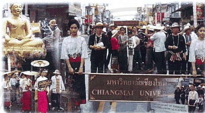
ภาพที่ 2 กิจกรรมงานสงกรานต์ต้นพื้นที่ถนนท่าแพ