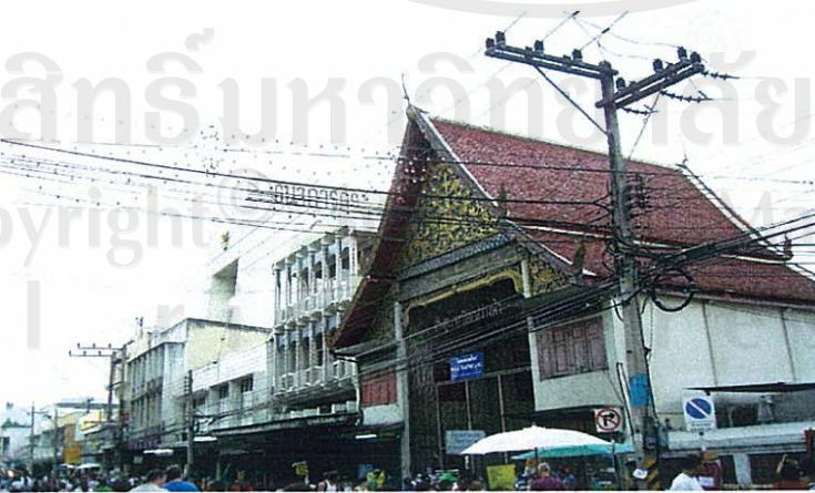
ภาพที่ 7 ภูมิทัศน์ระบบสาธารณูปโภคกับศาสนสถานวัดแสนฝางพื้นที่ถนนท่าแพ