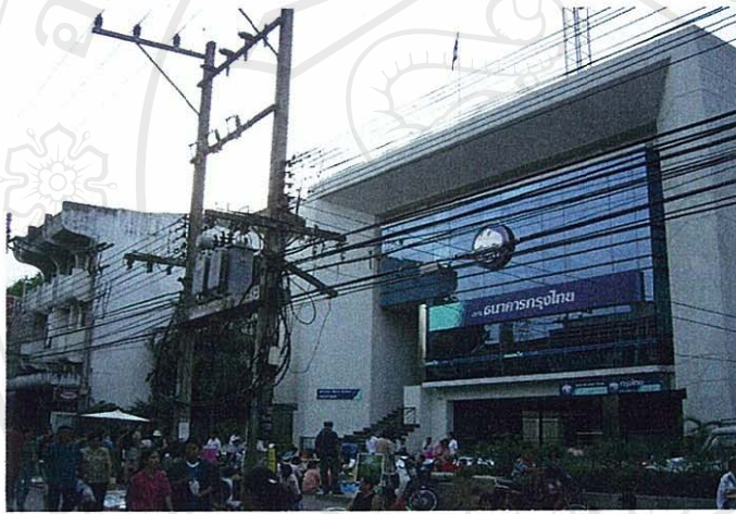
ภาพที่ 9 ภูมิทัศน์ด้านสาธารณูปโภคกับสิ่งปลูกสร้างสมัยใหม่ ธนาคารกรุงไทย บนถนนท่าแพ