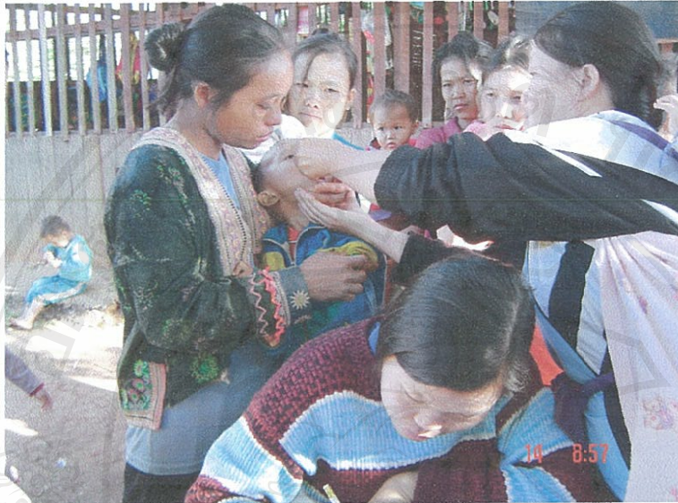
รูปภาพที่ 4.29. แสดงเด็กกำลังรับการหยอดวัคซีนป้องกันโรคซึ่งได้รับการสนับสนุนจากสถานีนอนามัยตำบลบ่อแก้ว

กล่าวคือ หากมีความเคลื่อนไหวทางด้านสาธารณสุขใดๆ สถานีนอนามัยบ่อแก้วจะแจ้งให้หอสม. ประจำหมู่บ้านหรือผู้ใหญ่บ้านทราบเพื่อจะได้ประกาศให้สมาชิกในชุมชนรับทราบต่อไป เช่น กิจกรรม สัปดาห์กำจัดขยะ หรือการฉีดวัคซีนและตรวจโรคฟัน เป็นต้น