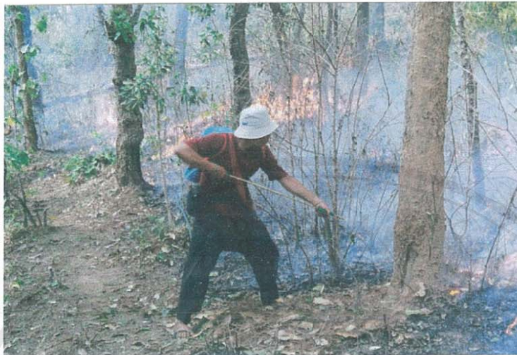
รูปภาพที่ 4.28. แสดงเวรยามที่เฟิระวังไฟป่ากำลังทำการดับไฟป่า