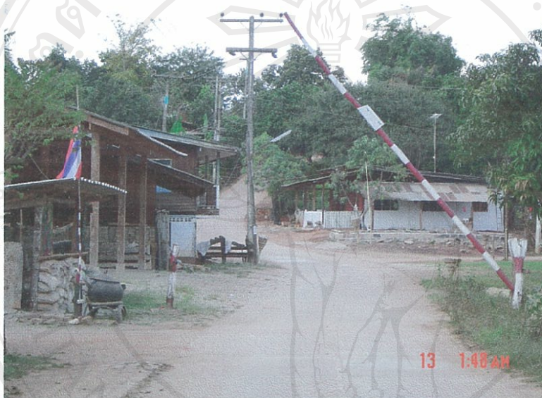
รูปถ่ายที่ 4.27. แสดงป้อมยามอยู่เวรเพื่อตรวจรถและบุคคลที่เดินทางเข้า-ออกในช่วงเกิดปัญหาหาเสพติด

กล่าวคือ ในช่วงที่มีปัญหาหาเสพติดกำลังระบอบอย่างหนักรวมทั้งปัญหาการลักเล็ก ขโมยน้อย ทางคณะกรรมการฯ ได้จัดให้มีการอยู่เวรยามในช่วงกลางคืน และอาจช่วงกลางวันด้วย หากสถานการณ์ช่วงดังกล่าวไม่น่าไว้วางใจ โดยทำเป็นป้อมค่านและจัดให้มีเวรยามอยู่ประจำ ซึ่งเวรยามที่อยู่เวรก็คือสมาชิกชาวบ้านทั่วไปภายในชุมชน แต่ต้องเป็นผู้ชาย โดยชุดหนึ่งอาจอยู่เวรเป็นระยะเวลา 2-3 ชั่วโมง ทั้งนี้เพื่อทำการตรวจตราและบุคคลที่เดินทางเข้า-ออกภายในชุมชน ซึ่งสมาชิกในชุมชนทุกคนต่างก็ให้ความร่วมมืออย่างดี อย่างไรก็ตามปัจจุบันกิจกรรมการอยู่เวรยามนี้ได้ยกเลิกไปแล้ว เนื่องจากขณะนี้สถานการณ์ปัญหาหาเสพติดได้คลี่คลายลงจนหมดไปจากชุมชนแล้ว จึงไม่จำเป็นต้องมีกิจกรรมการอยู่เวรยามอีก