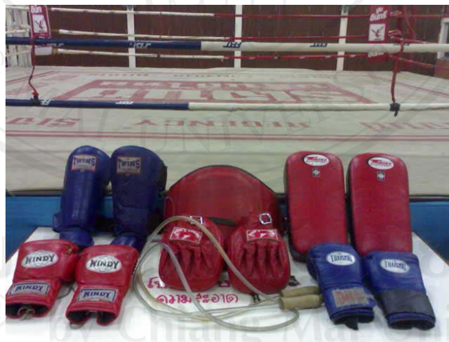
ภาพ 15 แสดงภาพอุปกรณ์ฝึกมวย