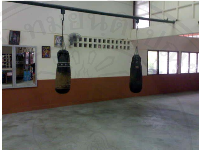
ภาพ 14 แสดงภาพกระสอบทรายฝึกมวย