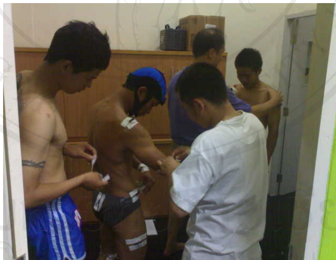
ภาพ 9 แสดงจุดแปะเทปเพื่อวัดมุมในร่างกาย