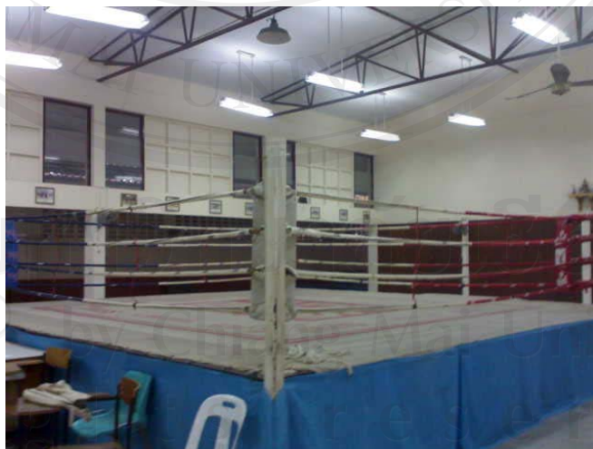
ภาพ 13 แสดงภาพเวทีมวย