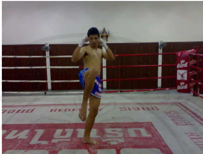
ภาพ 8 แสดงลักษณะการตั้งการ์ด