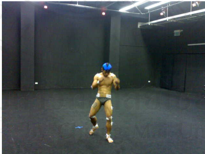
ภาพ 11 แสดงทำยีนอย่างสามซุมด้านหน้า

ลิขสิทธิ์ © 2015 มหาวิทยาลัยเชียงใหม่ Copyright © 2015 Chiang Mai University All rights reserved