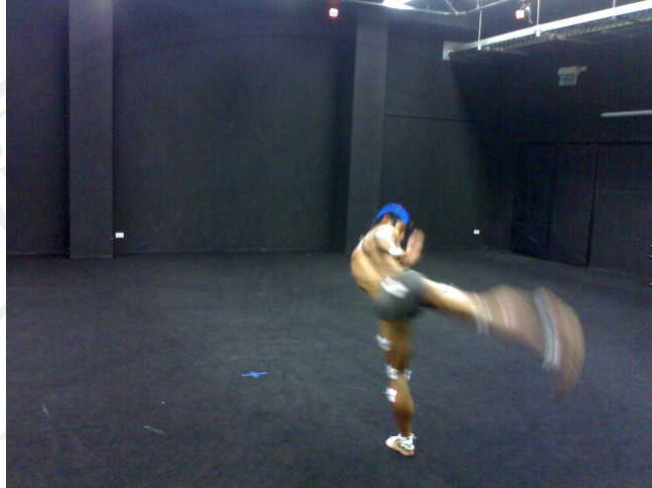
ภาพ 12 แสดงท่าการเตะ