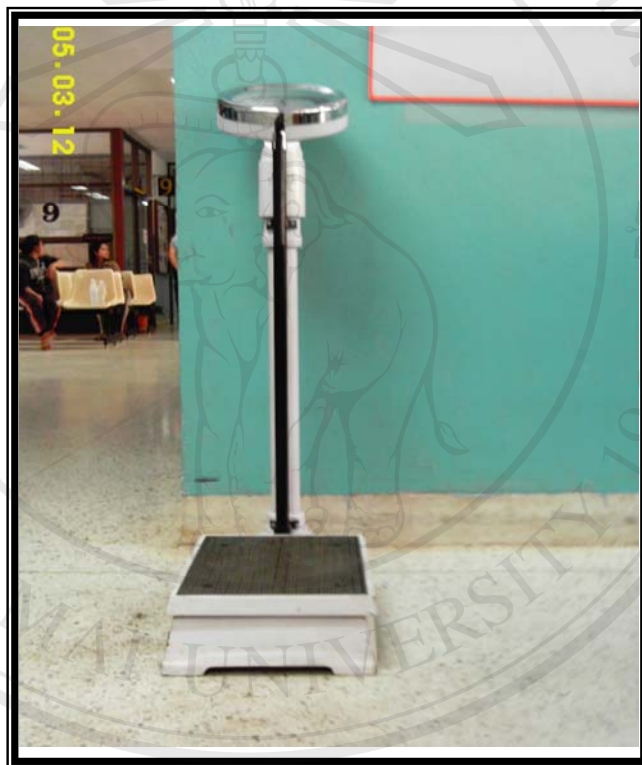
ภาพ 1 เครื่องชั่งน้ำหนักและวัดส่วนสูง

ภาพการอธิบายในการตอบแบบสอบถาม การชั่งน้ำหนัก และวัดส่วนสูง ของบุคลากรด้านสุขภาพ