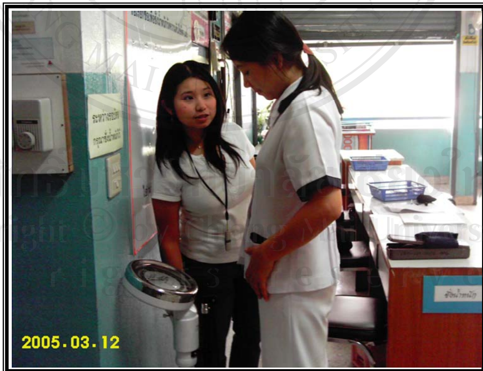
ภาพ 3 ชั่งน้ำหนัก