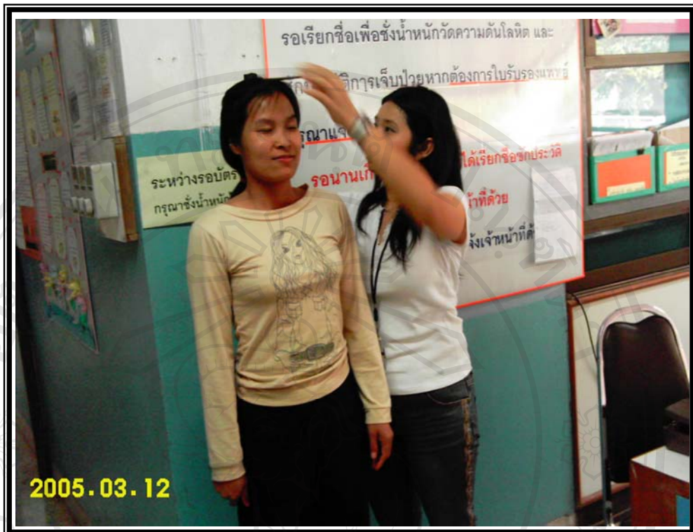
ภาพ 4 วัดส่วนสูง

ลิขสิทธิ์มหาวิทยาลัยเชียงใหม่ Copyright © by Chiang Mai University All rights reserved