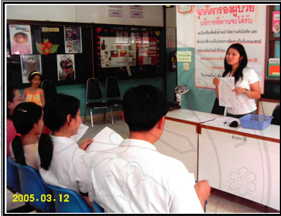
ภาพ 2 การอธิบายการตอบแบบสอบถาม