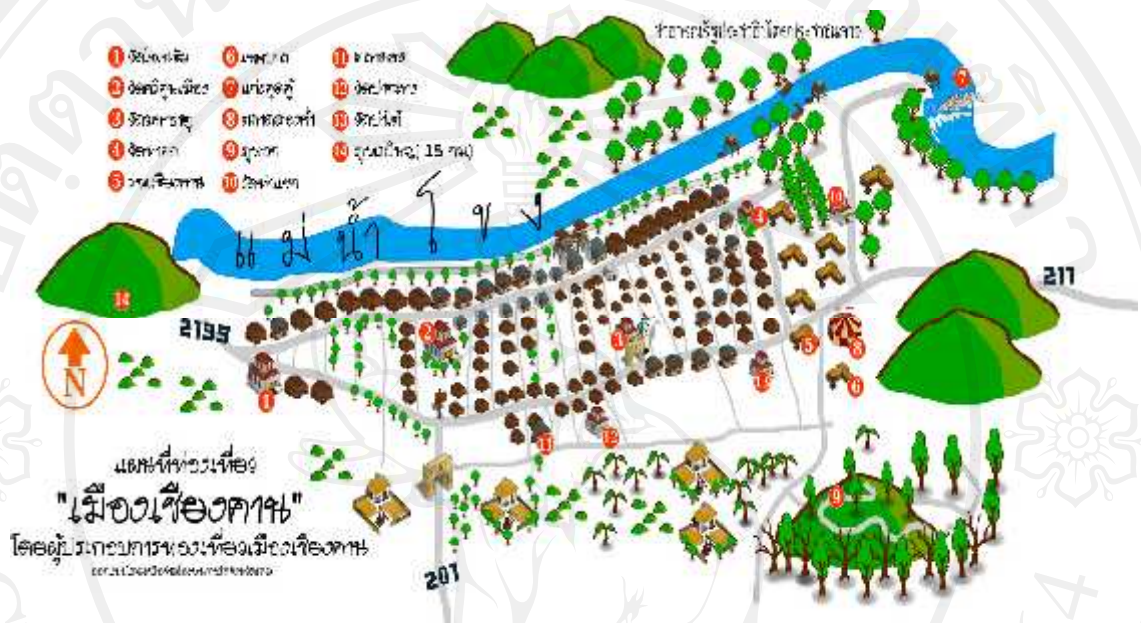
ภาพที่ 1.2 แสดงแหล่งท่องเที่ยวในอำเภอเชียงคาน จังหวัดเลย

เป็นอย่างมาก ซึ่งได้แสดงภาพให้เห็นแหล่งท่องเที่ยวต่างๆที่สำคัญของอำเภอเชียงคาน จังหวัดเลย ดังที่กล่าวไว้ข้างต้น ดังภาพที่ 1.2