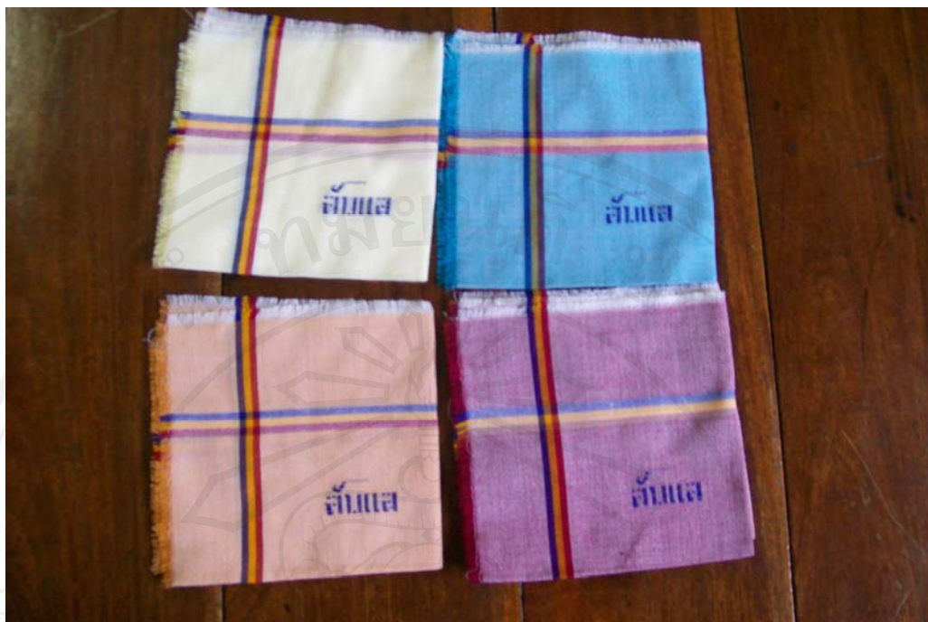
รูปที่ 4.8 ผ้าเช็ดหน้า กลุ่มอาชีพทอผ้าตำบลฝายหลวง