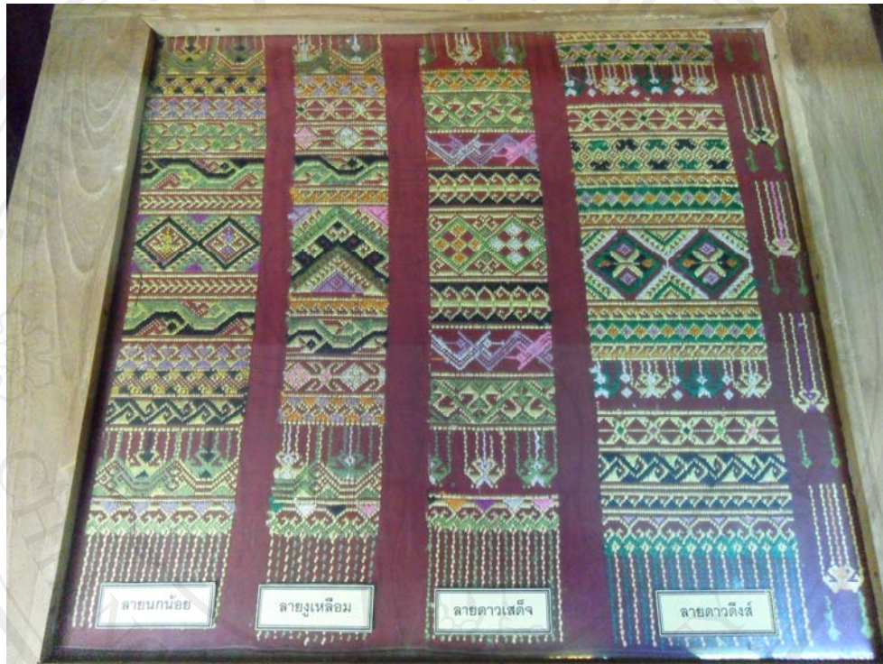
รูปที่ 4.1 ตัวอย่างลายผ้าทอของกลุ่มทอผ้าบ้านคุ้ม

เมื่อนำทั้ง 3 ส่วนมาเย็บต่อกันเป็นซิ่นตีนจกก็จะได้ซิ่นตีนจก 1 ผืน