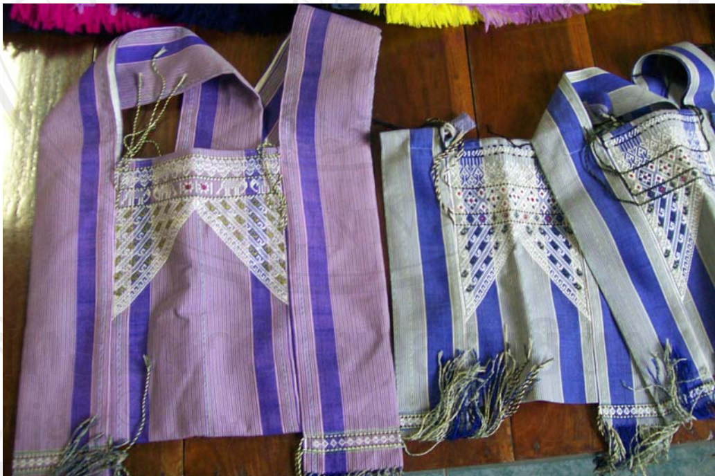
รูปที่ 4.7 ถุงย่าม กลุ่มอาชีพทอผ้าตำบลฝายหลวง