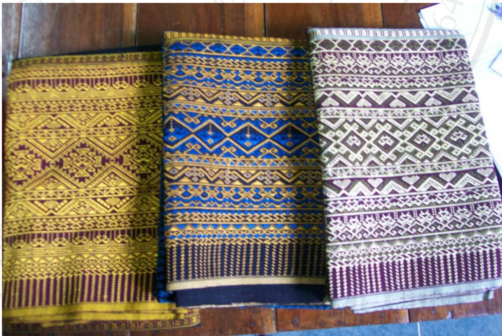
รูปที่ 4.5 ผ้าฝ้ายทอมือลายประยุกต์ กลุ่มอาชีพทอผ้าตำบลฝายหลวง