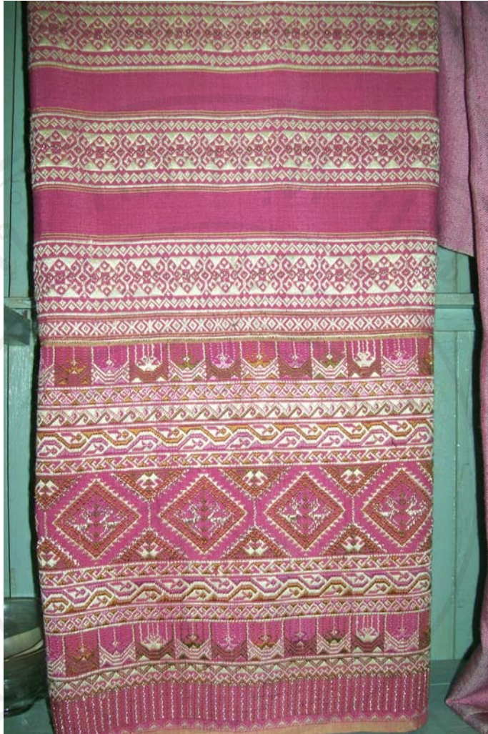
รูปที่ 4.3 ชินตินจกลายดาวดิ่งส์ กลุ่มทอผ้าบ้านคุ้ม