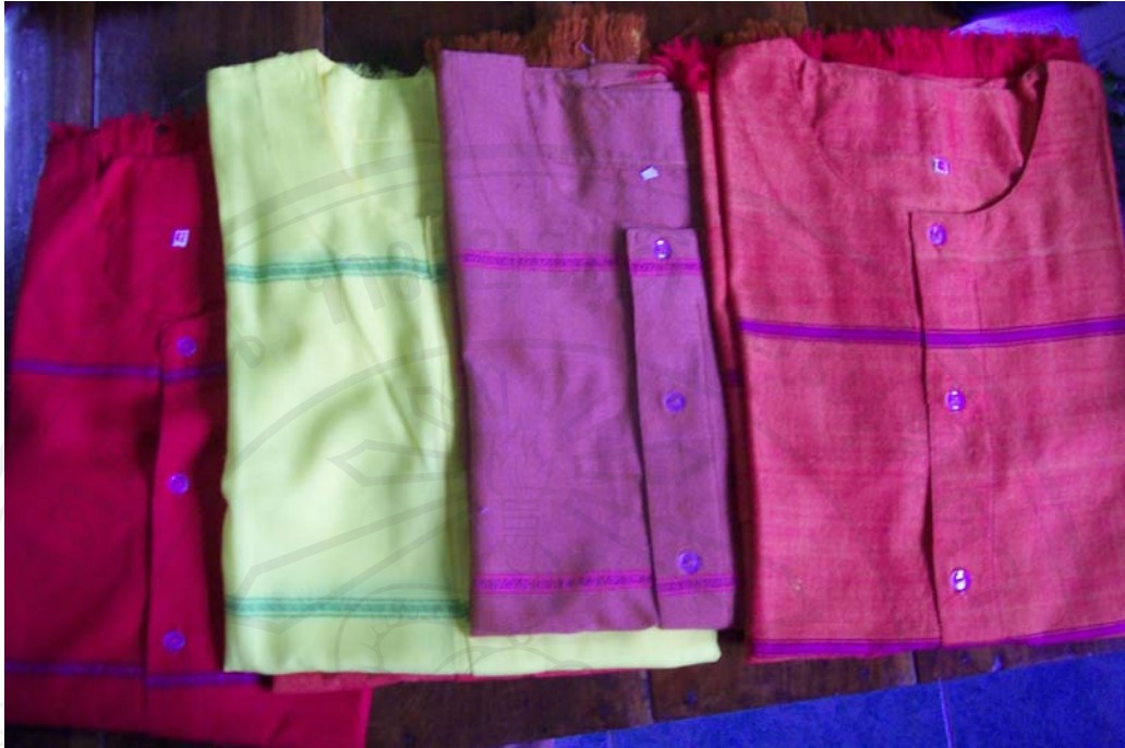
รูปที่ 4.6 เสื้อตัดเย็บจากผ้าทอพื้นเมือง กลุ่มอาชีพทอผ้าตำบลฝายหลวง