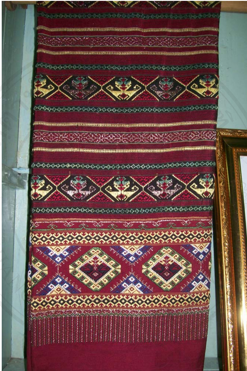
รูปที่ 4.2 ชิ้นตีนจกลายดอกแปดขอ กลุ่มทอผ้าบ้านคุ้ม

ลิขสิทธิ์มหาวิทยาลัยเชียงใหม่ Copyright © by Chiang Mai University All rights reserved