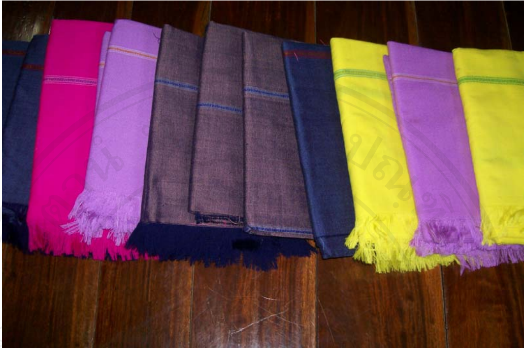
รูปที่ 4.4 ผ้าฝ้ายทอมือลายพื้นเมือง กลุ่มอาชีพทอผ้าตำบลฝายหลวง