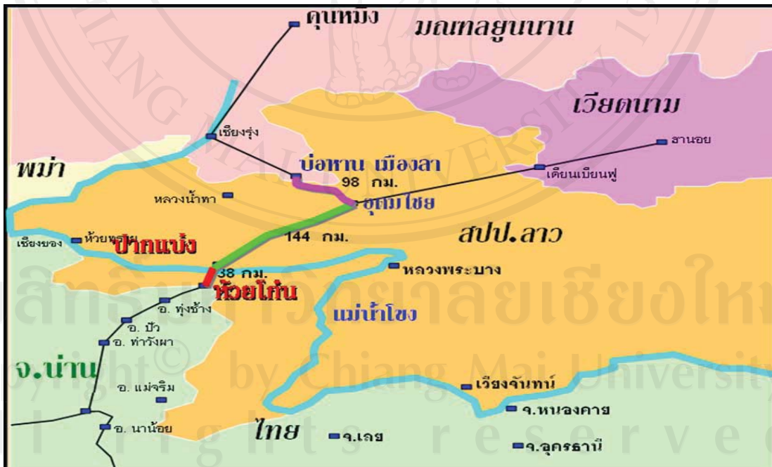
รูปที่ 1.2 แสดงแผนที่แสดงเส้นทางการค้าชายแดนไทย – ลาว ในจังหวัดน่าน โครงการเส้นทาง R 6 (น่าน-ห้วยโก๋น-ปากแบ่ง-อุดมไชย)