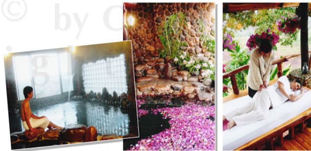
รูปที่ 3.1 แสดงการบริการสปาในปัจจุบัน

7. Medical Spa คือ สปาที่ตั้งโดยพ.ร.บ สถานพยาบาล โดยมีแพทย์ และพยาบาลดูแลกำกับ มีวัตถุประสงค์เพื่อบำบัดรักษาสุขภาพและความสวยงาม โปรแกรมการบริการประกอบด้วย โภชนาการบำบัดและอาหารสุขภาพ การออกกำลังกาย กิจกรรมเพื่อสุขภาพ การนวดแบบต่างๆ การบำบัดและดูแลลูกค้าโดยใช้ความรู้ด้านสุขภาพ มีบริการทางการแพทย์ให้เลือก ทั้งแพทย์แผนปัจจุบันและการแพทย์ไทย แพทย์จีน ฯลฯ มีโปรแกรมการนวดที่รักษาอาการเจ็บป่วย เช่น การนวดกดจุด การบำบัดด้วยสมุนไพร การปรับโครงสร้างร่างกาย การสะกดจิต การฝังเข็ม ศัลยกรรมผิวหน้า การต่อต้านริ้วรอย ผู้มาใช้บริการส่วนใหญ่มักจะมีความต้องการการพำนักระยะยาวและการบำบัดที่เฉพาะเจาะจง เช่น การลดน้ำหนัก การออกกำลังกายที่ถูกต้อง การเลิกบุหรี่ เป็นต้น โดยทีมงานที่เชี่ยวชาญจะเป็นผู้พิจารณาจัดโปรแกรมให้เหมาะสมกับลักษณะสุขภาพบุคคลแต่ละคน